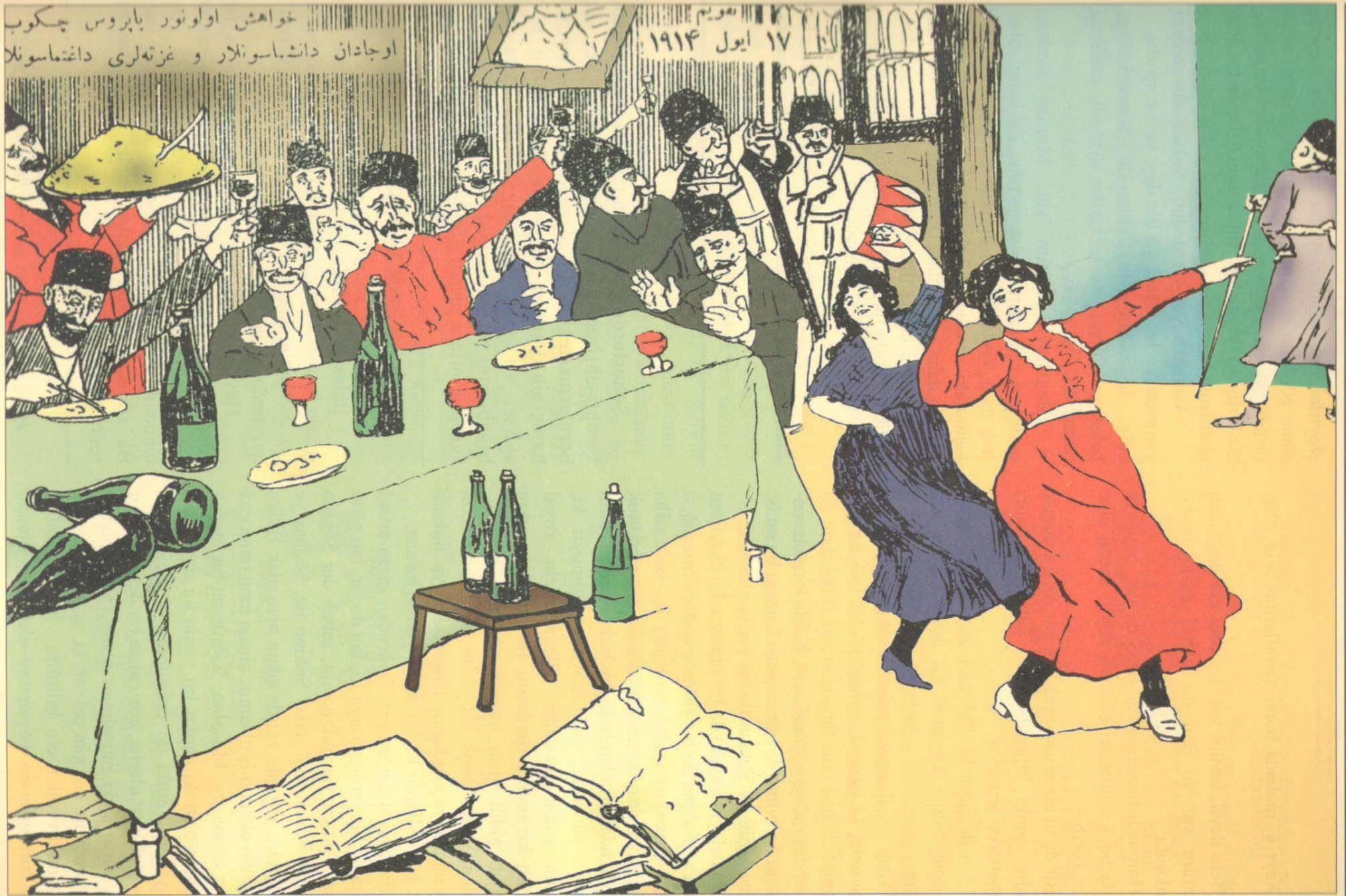
Şüvəlanda qiraətxanada toy Свадьба в Шувеланской читальне.