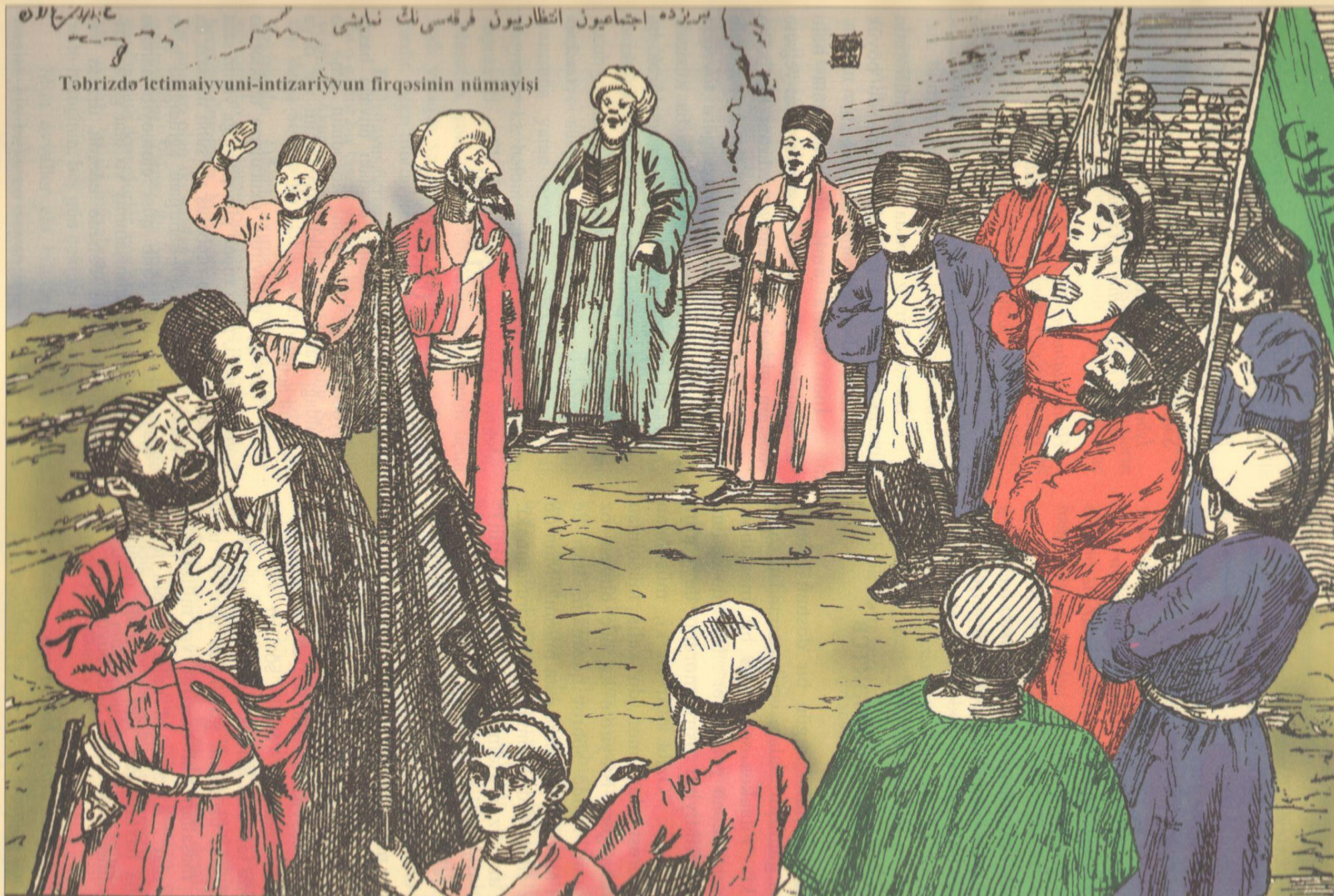
Gərək piyada gedib Sərmənra quyusundan həzrəti-höccəti hökmən çıxardıb gətirək ki, din əldən getdi.