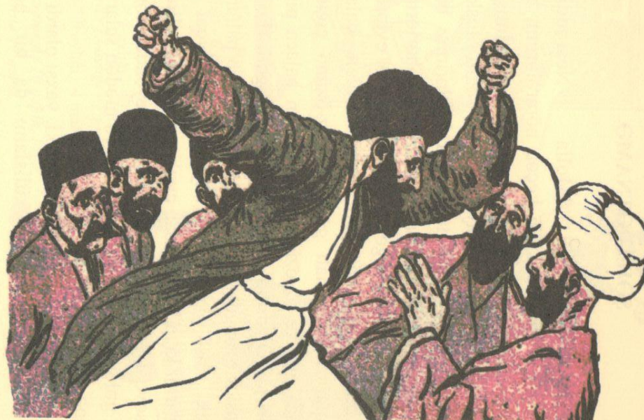
Naxçıvan: Hacı Məhəmməd Həsənin mərsiyəsində mollaların ərəbi davası.