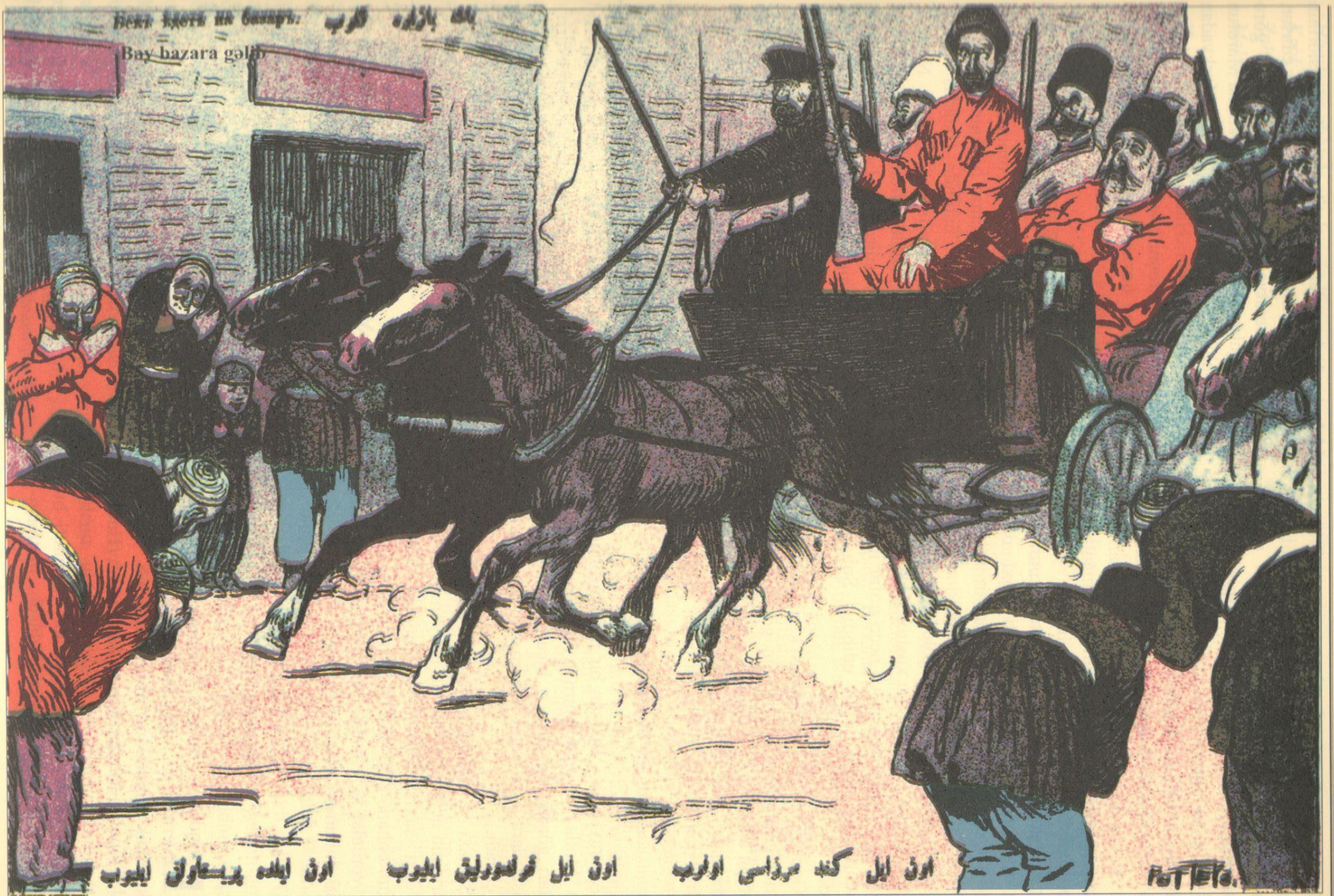
On il kənd mirzəsi olub. On il quldurluq eləyib. On il də pristavlıq eləyib. Десять лет был писарем, десять лет разбойником, десять лет приставомь.