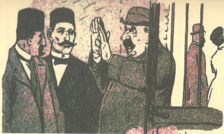
Təbriz ermənilərinin millət bağçası. Bizə də bilet ver. Börkülləri bu bağa qoymaq.

یزەدە بیلەت ویر بوردکی لری بو باغە قویماق