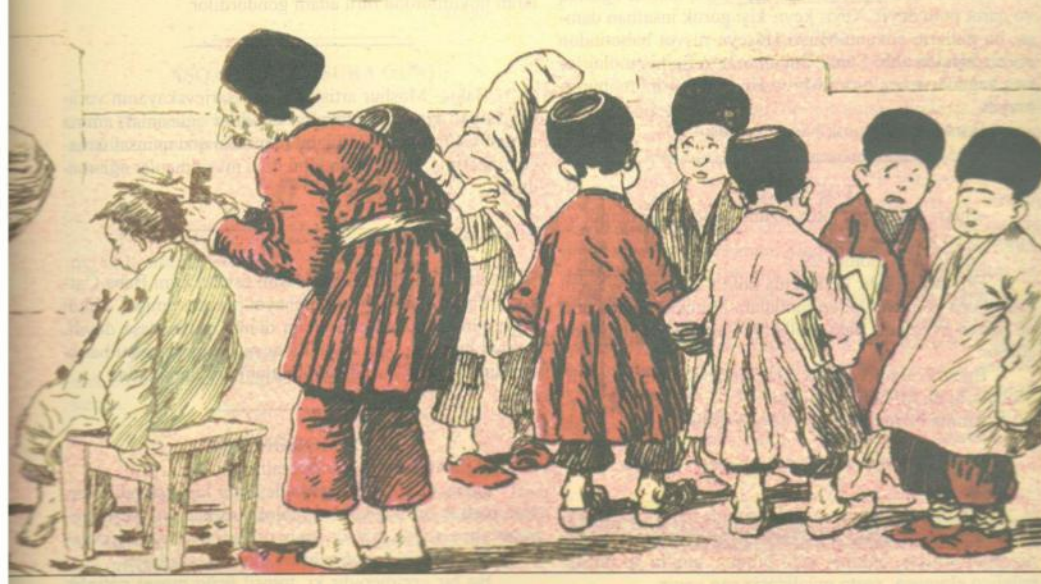
bir alafraq baş qalmadı ki, qırılmamış olsun.