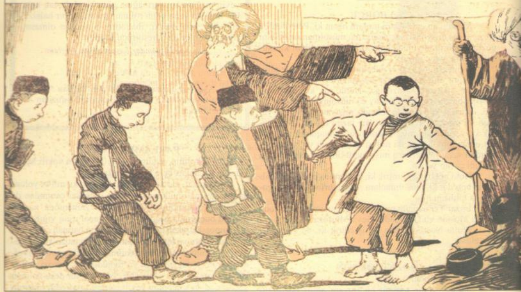
Öncünün qərarına görə Təbr