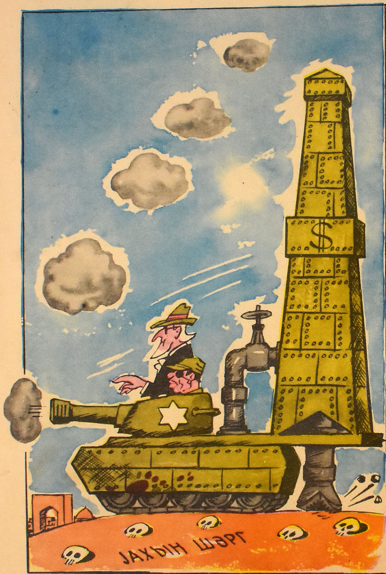
Гулдурун истигамәтвәрәни Разбой с наводчиком