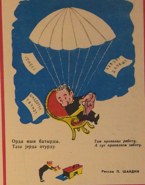
Орда иши батырды, Тәзә јердә отурду.

Шөрбала дөндүрманың кағзымы зилбил габына атыб, үл-үнә-үшүшә деди: