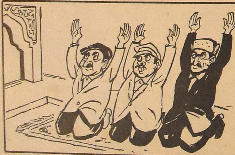
— Илаһи, экэр күнаһымыз варса, кеч күнаһымыздан! — Ай аллах, если и есть у нас грехи, отпусти их нам.