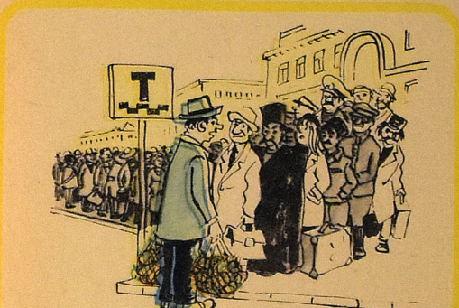
— Ичәзә версәјдиниз, нөвбәдәнкәнар минәрдим, јохса, базарлығымын зајы чыхар. — Разрешите присесть мне очереди, иначе у меня испор-тятся продукты.