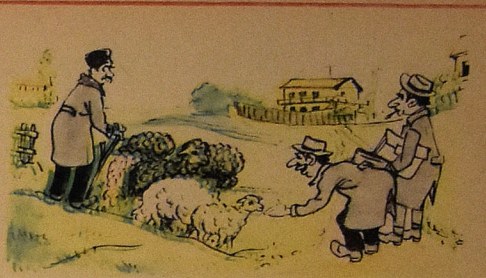
— Не каблыгысан!.. һейф ки, ферманыңы дејилсэн! — Ах, какой ты шалымыңы! Жаль что ты не из фермы.

Сорушмада: — Нәјә көрә? Бәлкә тә'мир пулуузу вермәләйр, һә?.. — Чаваб вериләр ки: — Хејр! Тә'мир пулуу сәк-киз јүз манат мәбләғидә га-багчадан көчүрүләр. — Амма вердиклери ва'ддән бир ај әвәзинә алты ај кечир. Нә тә'мирдән хәбәр-әтәр вар, нә дә хәстәхана мүдириниң завод унванына вуруду теле-грамлара чаваб верән. Одур ки, Порсова көнд хәстәләринә вах-тында тә'чил Јардым көстөрә билмирләр.