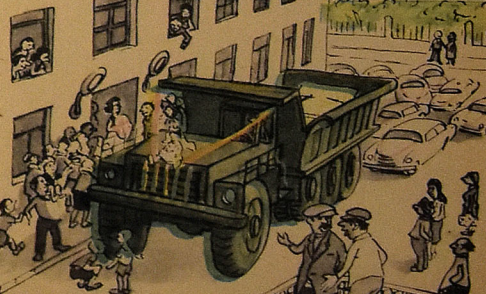
— Ата-анасы дејиб ки, көлиң чох кағыр гыздыр. — Родители говорят, что невеста веселая.