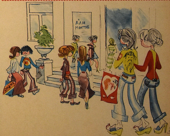
Сабир демикшәң: һара кәдир бу чаванлар, аһан, бу көкдә, бу көкдә... Рәссам Ә. ЗЕЈНАЛОВ