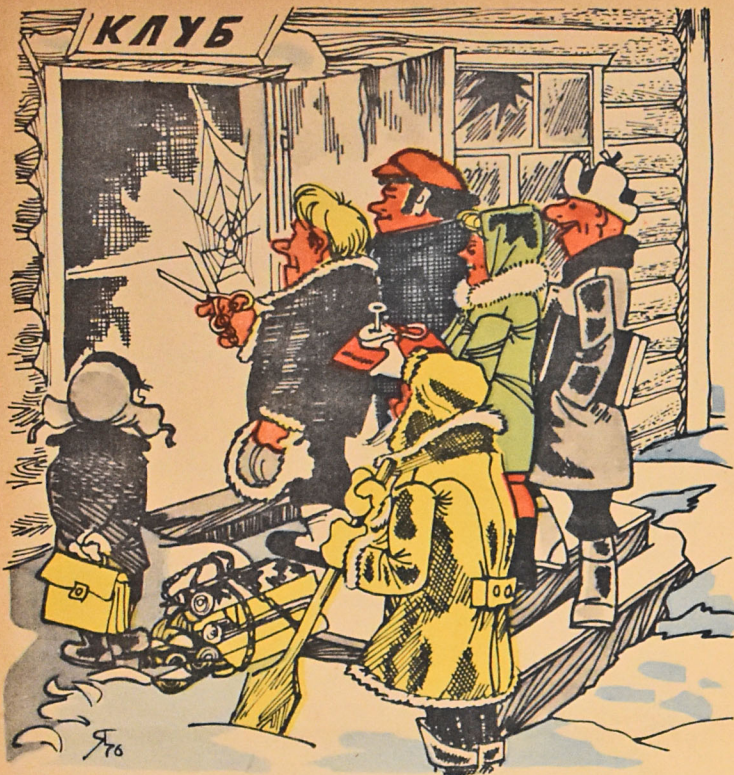
Гыш јухусундан сонра