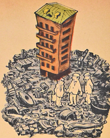
— Бу өзө һеч өзүмүз јахынлаша билмирик, адамларыз нечө көчүрөк! — Ках дам совагыт бүдем, если к немү не добротасы?