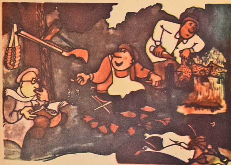
— Биркаларыны Елмпэр Академијасына апармагы јадындан чыхарма! — Не забудь отвести козвца в Академию наук...