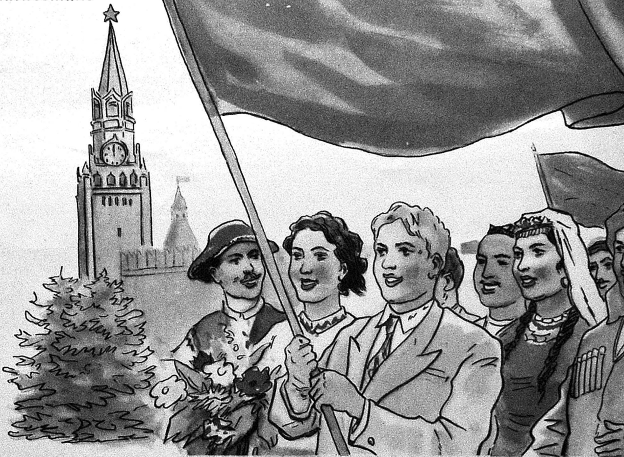
— Хейр, мән дедийим вә мән яздығым бош вә хамхәял дейил. Көрдүнүз милләтләр („Загафгазия Комиссарлығы“)