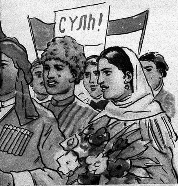
Бирләшәр вә гардаш ола биләрләрмиш. «Сосялист үзвләринә ачыг мәктүб».