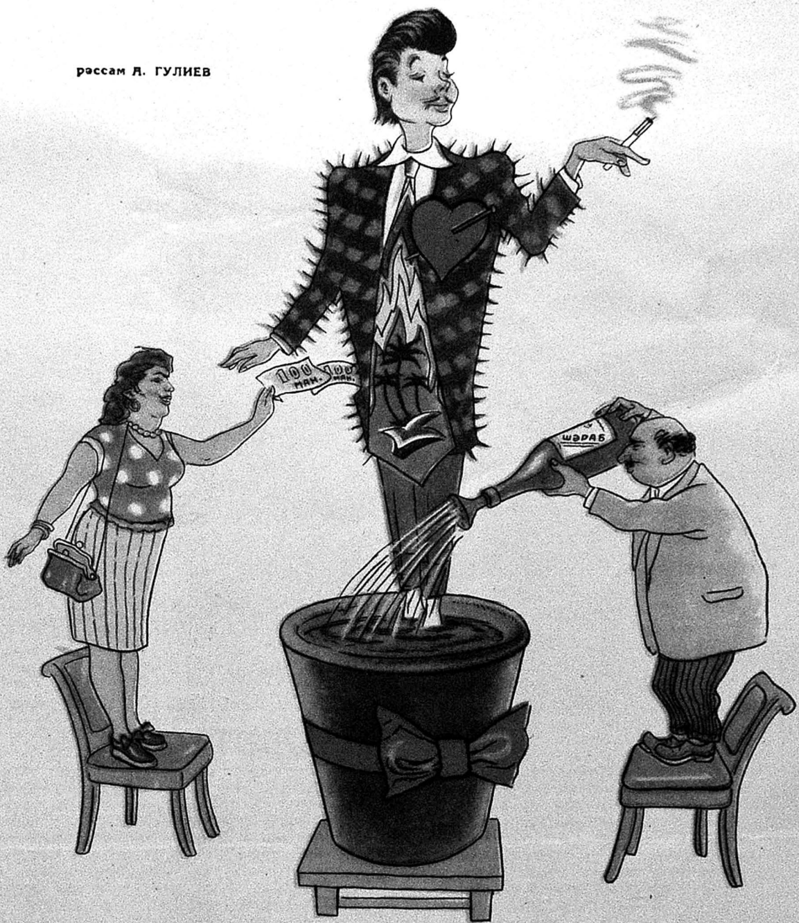
Ата-ананын күл оғлу.