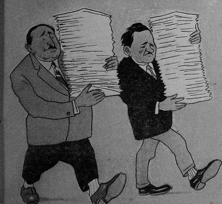
Көчмишдә күндә йүз әмр язырдылар

Бир күн кечир арадан Бир соргу кәдир "Билдирин, Куур'ерлар Редаксия Телефонун "Рича эдирик завхоз һаггында Айдамы бир чабә бу мәғалә Тәләб эләйрәм ки, Мәктүб, яландыр Бу бир һәзәсләгәдир, Бәли, бәли, Демәк кооперативни Мүхбир—бөһтанчы адам Имза, ва мөһүр. Тарихи дә чабә