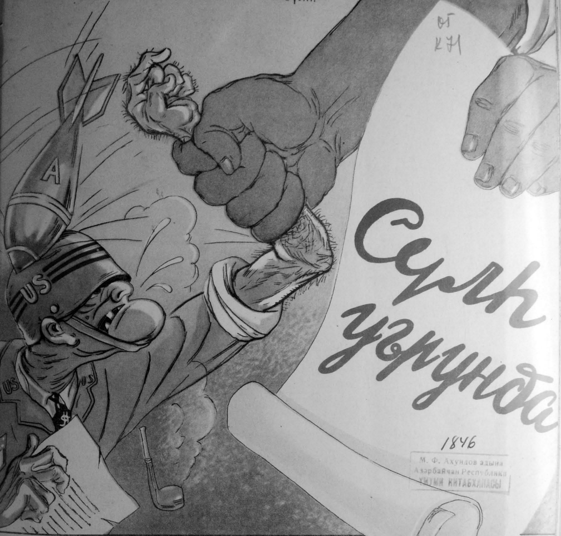
Рәссам Г. ХАЛЫГОВ