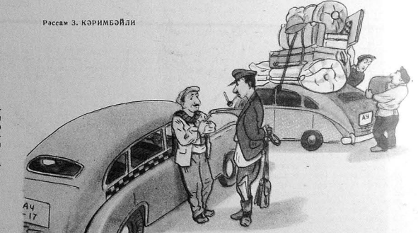
Рисунг 3. КӨРИМБӨЙЛИ