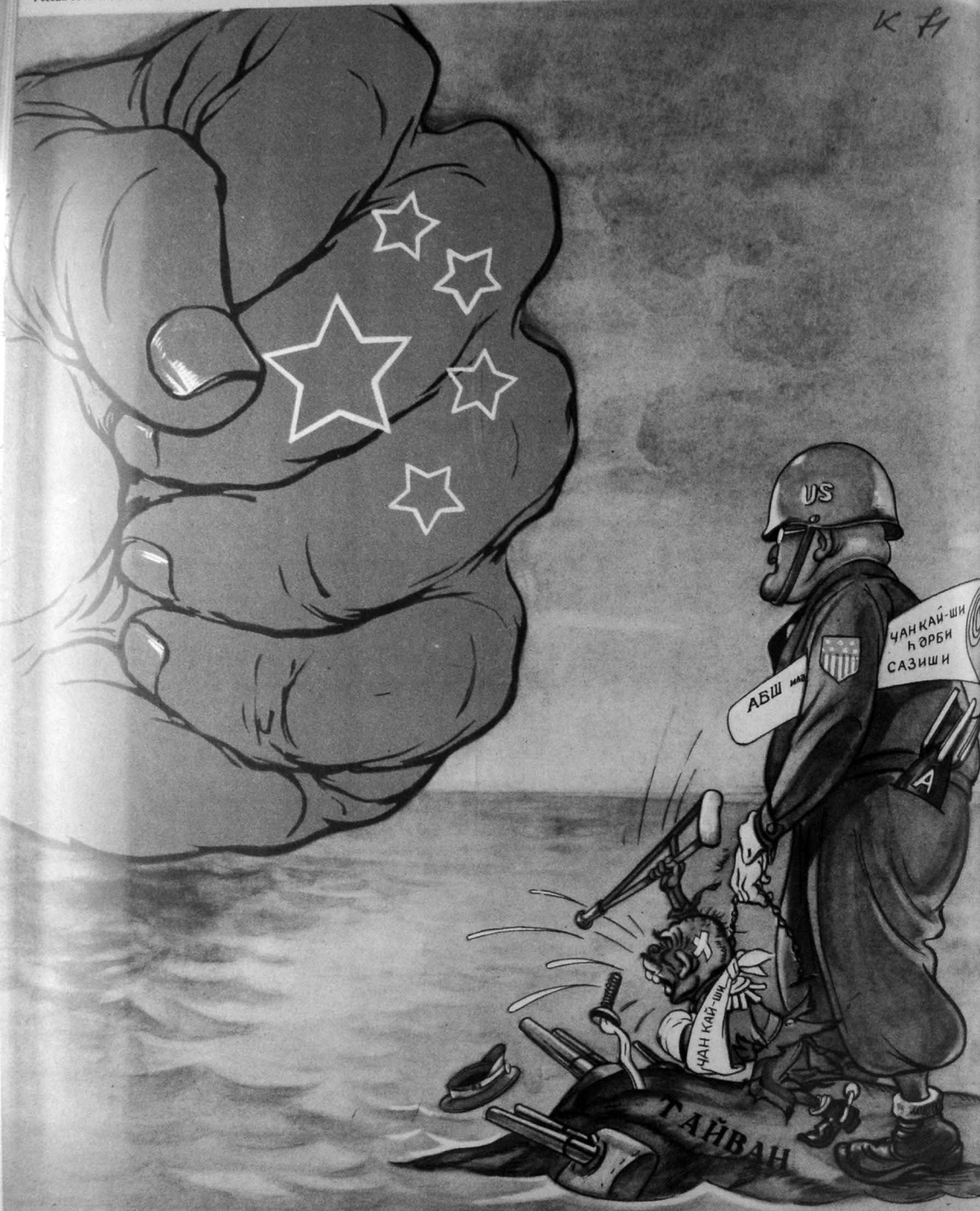
—Белә юруга ким таб кәтирәр?