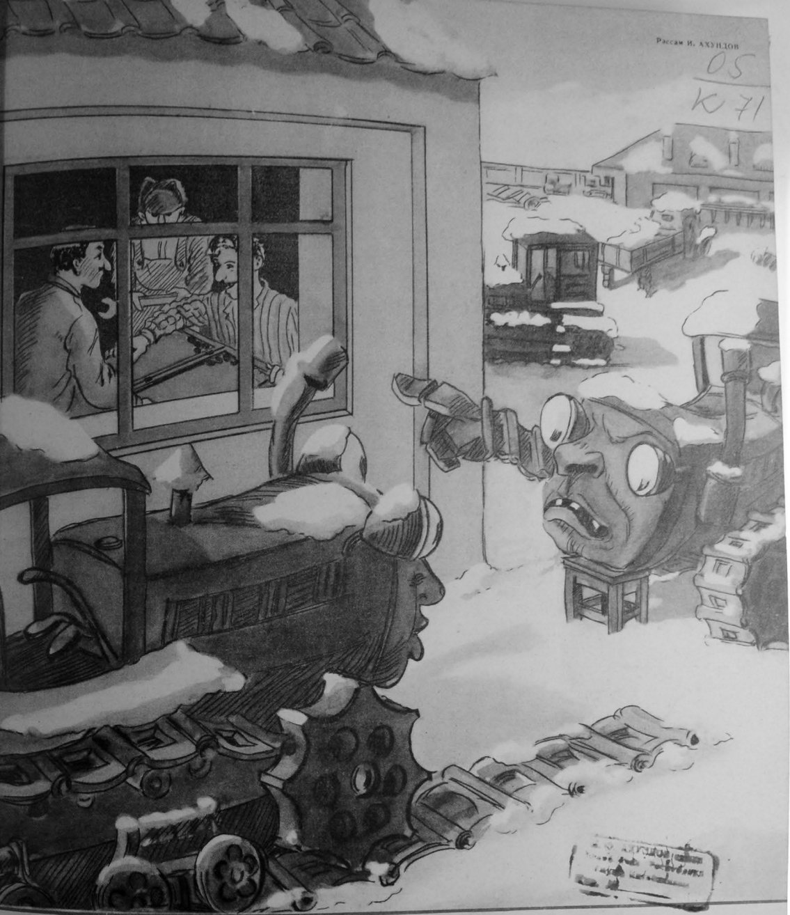
ТРАКТОР: — Инди отуруб нәрд вурурлар, яз кәләндә исә башларына вурачаглар.