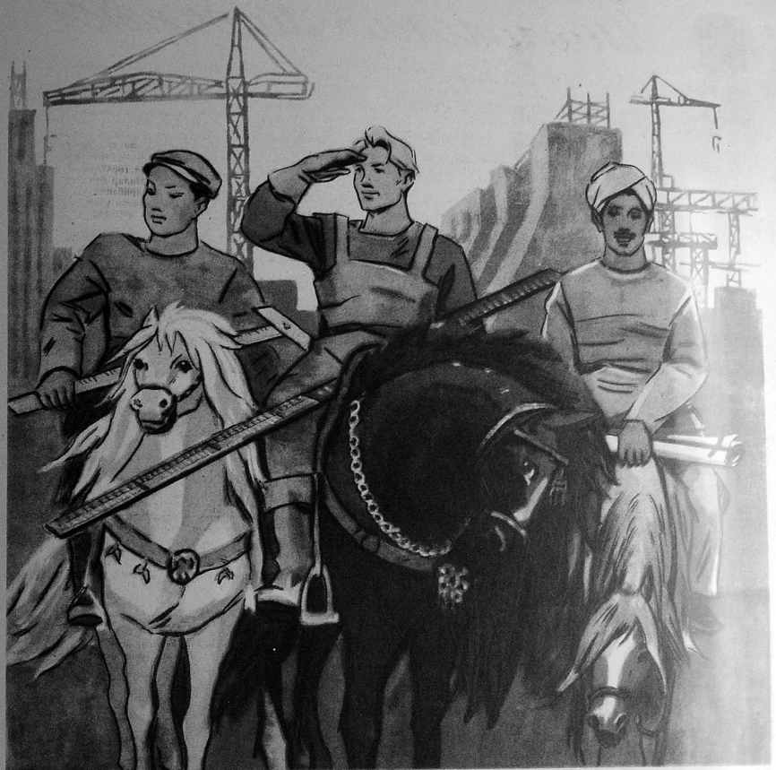
СУЛУҲ ЧӨБҲӘСИ ПӘЙЛИВАНЛАРЫ