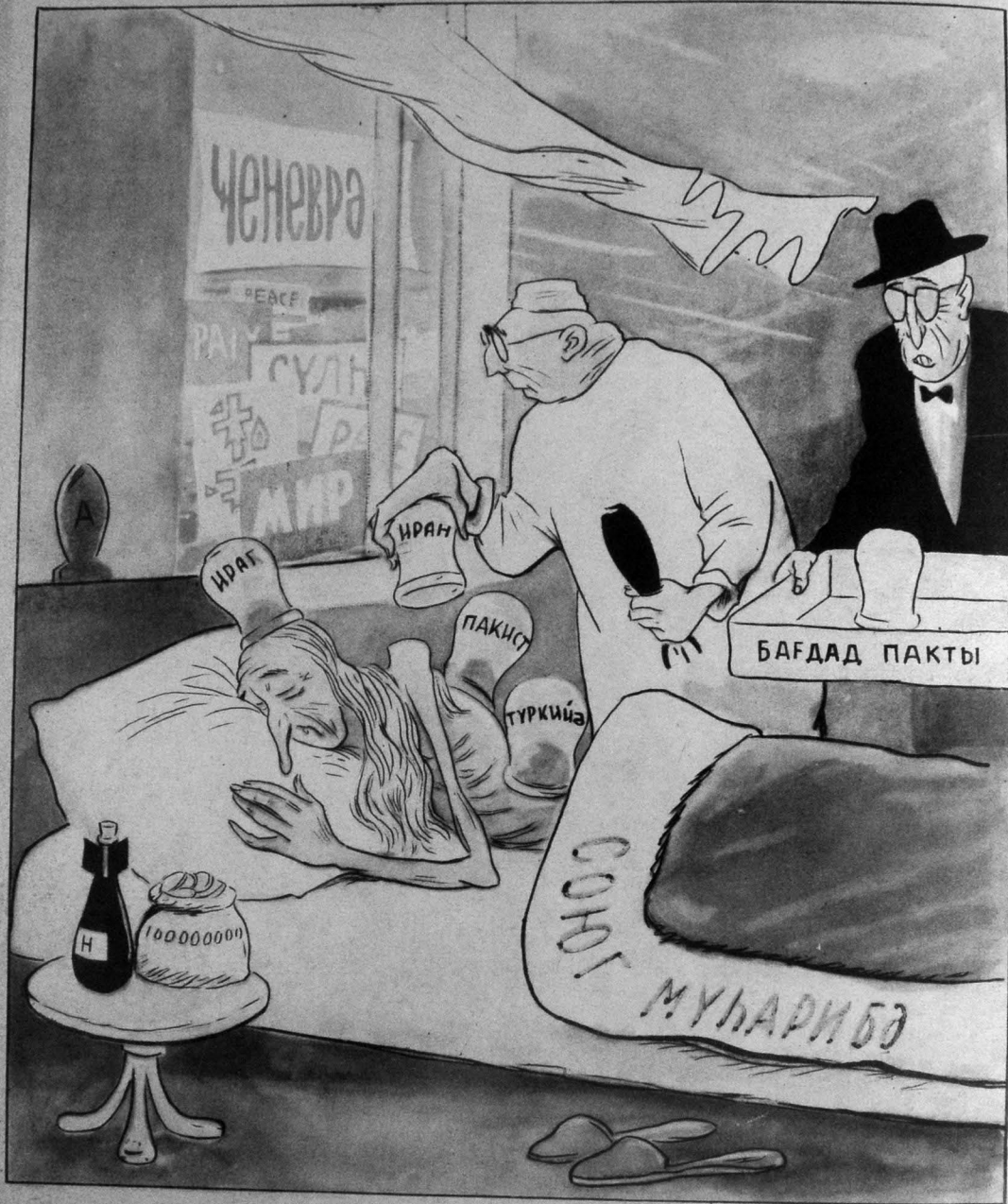
— Хастанин везийятини яхшылашдыра билмирик. — Онун ахырына чыхан о пәнчәрэдән көлән навадыр.