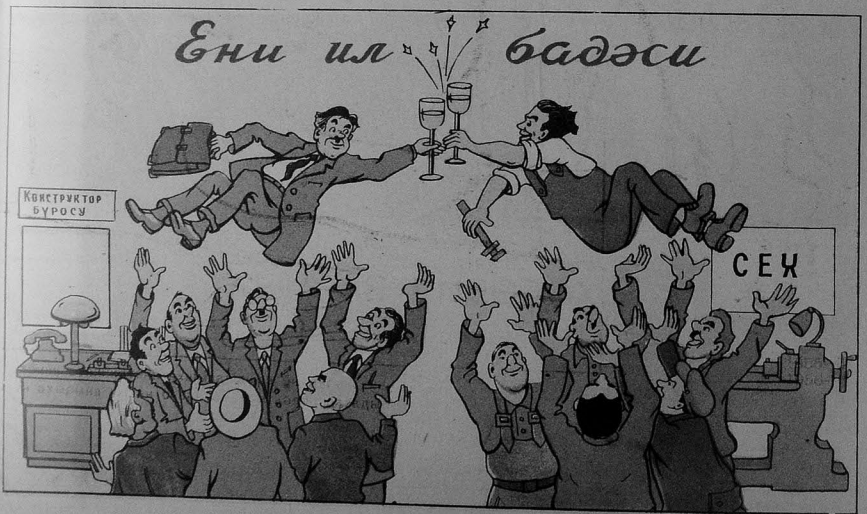
Ени муваффагийэтларин сағлығина!!