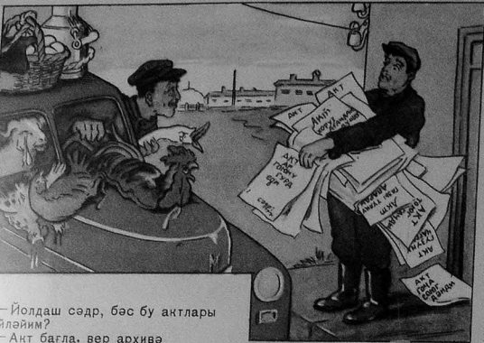
—Йолдаш сәдр, бәс бу актлары нәйләйм?