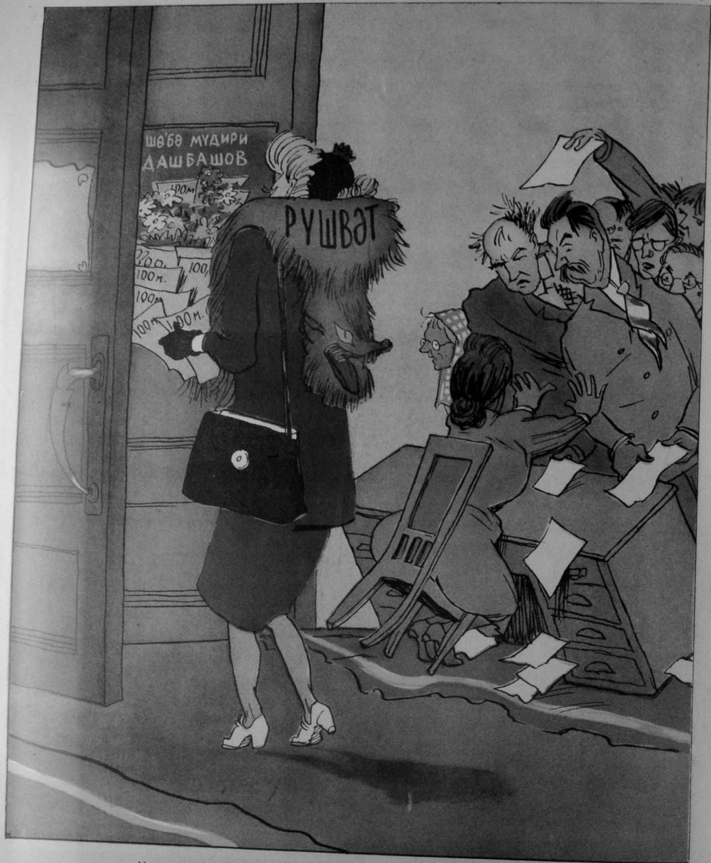
— Чох гарибедир, бу ишвәли ханумы һәмишә нөвбәсиз гәбүл эдирләр. („Крокодил“ дән)