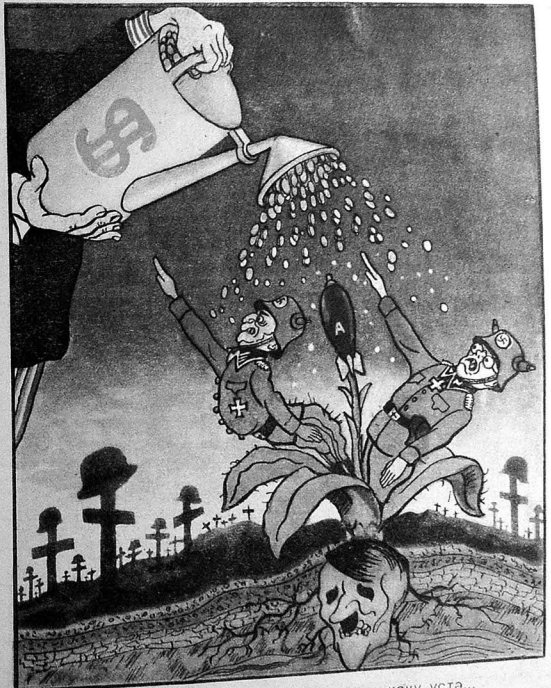
Мәшһүр мөсәлдир, битәр от өз көкү үстә...