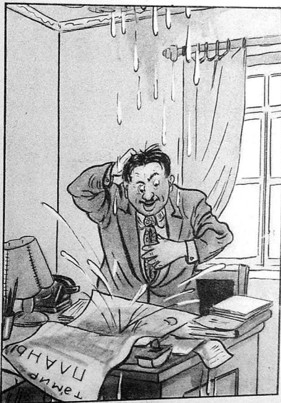
— Вай дәдә вай, планым позуду...