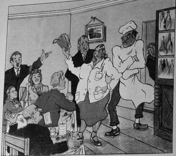
ЕМӨНХАНА МУДИРИ—Алын шикайет китабыны, нө истэйрсинни зяын, сизин кимилөрдөн чох көрүшөм.