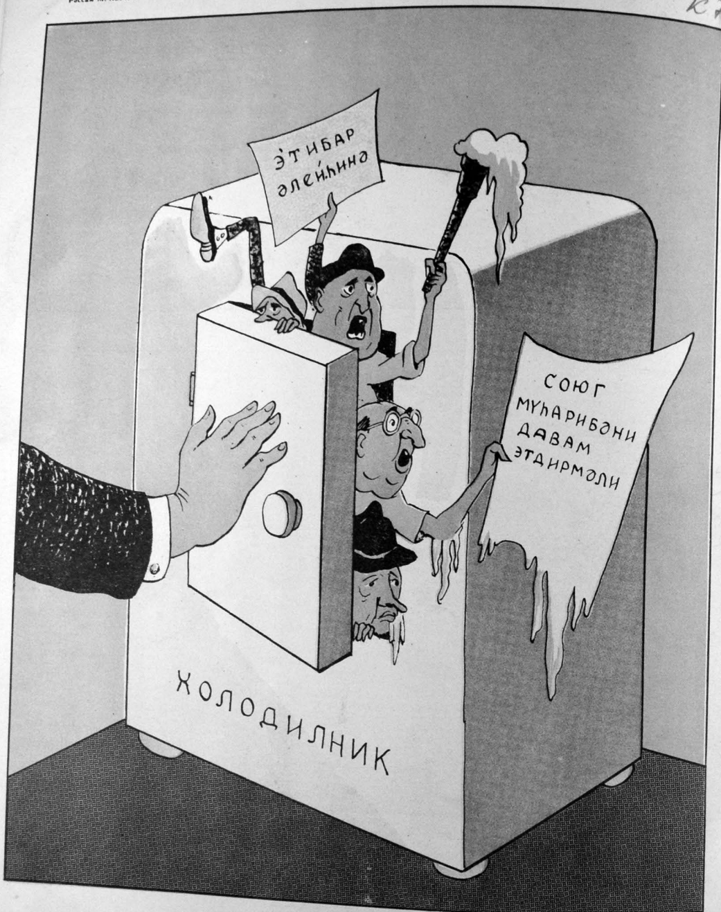
„Союг мунариба“ тэрэфдарларынын хэрэрэтини союмталы.