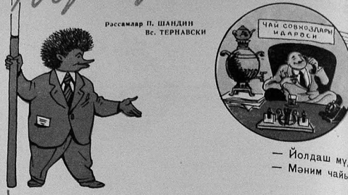
Рәсәмләв П. ШАНДИН Вс. ТЕРНАВСКИ