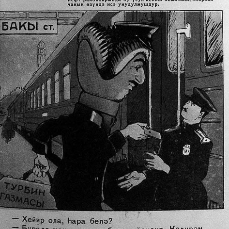
— Хейр ола, һара белә? — Бурада мәним үзүмә баһан йохдур. Мәдирәм Икинчи Бақыя.