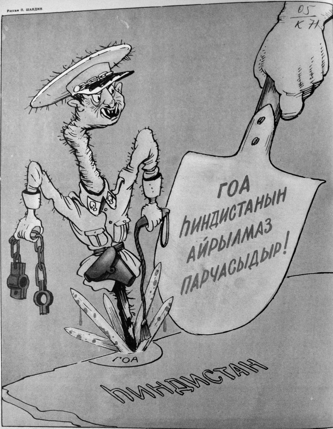
Гиндистан торпагында сон алаг оту.