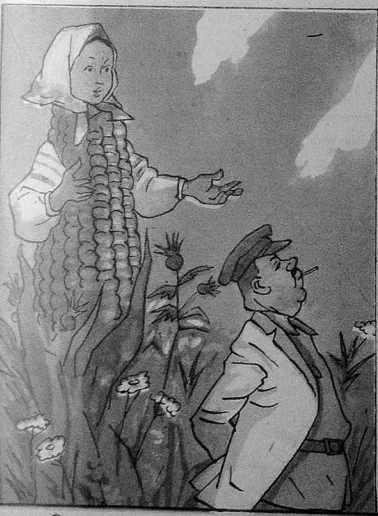
— Сөн анд ичирдин ки, мени севирсөн, бас не үчүн вөфасыз чыхдын?