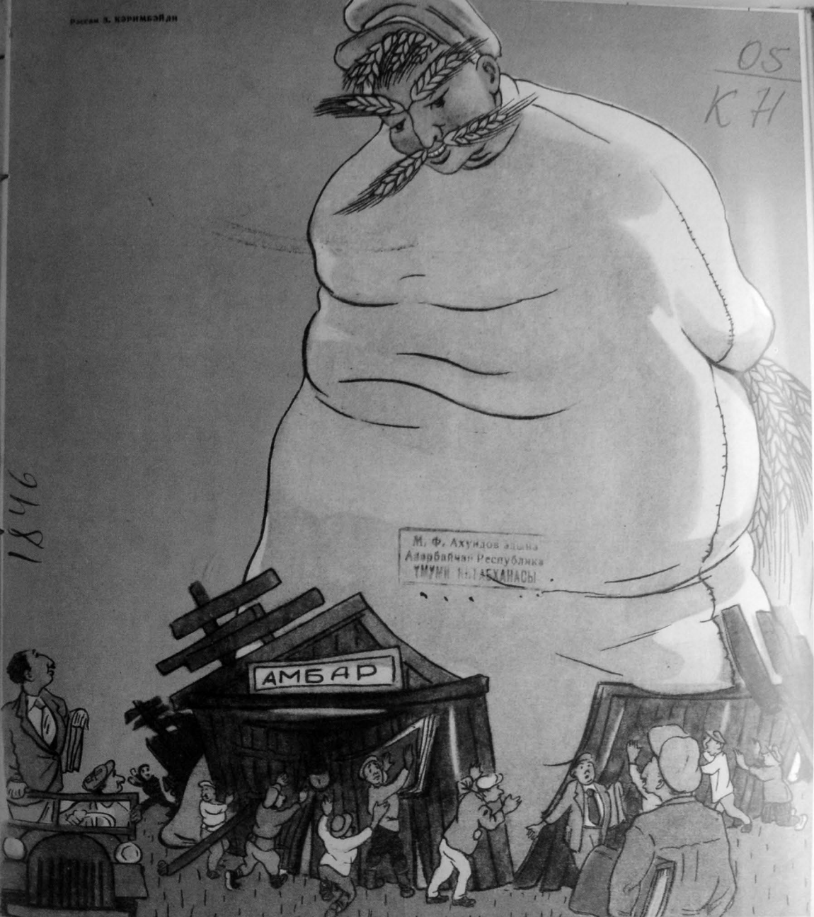
— Биз планда бунун бу гәдәр бейүк олачағыны нәзәрде тутмамышдыг.