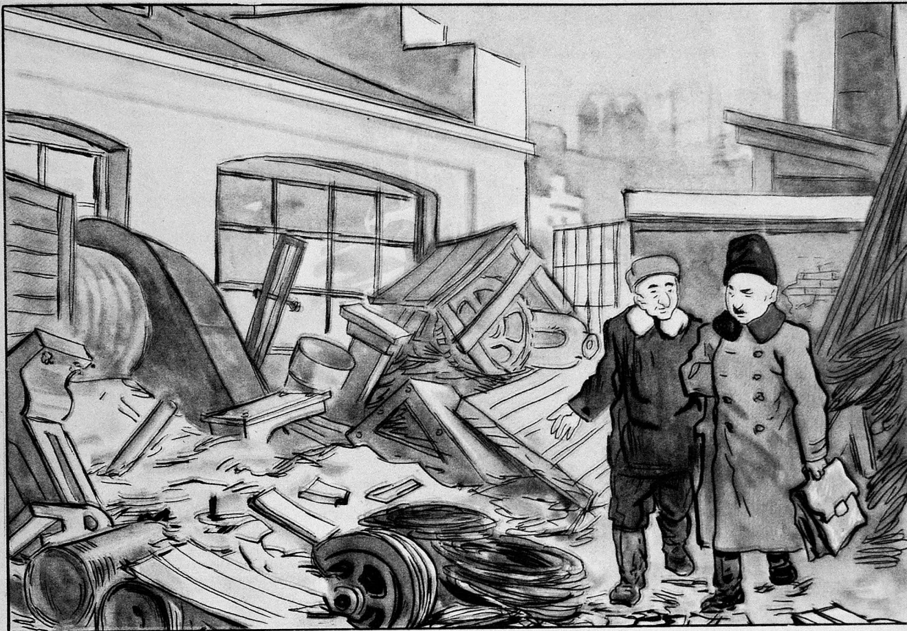
— Бу зир-зибили нә үчүн бурая төкүбләр? — Элә демә, инвентар дәфтәримиздә бунларын бир миллион гиймәти вар.