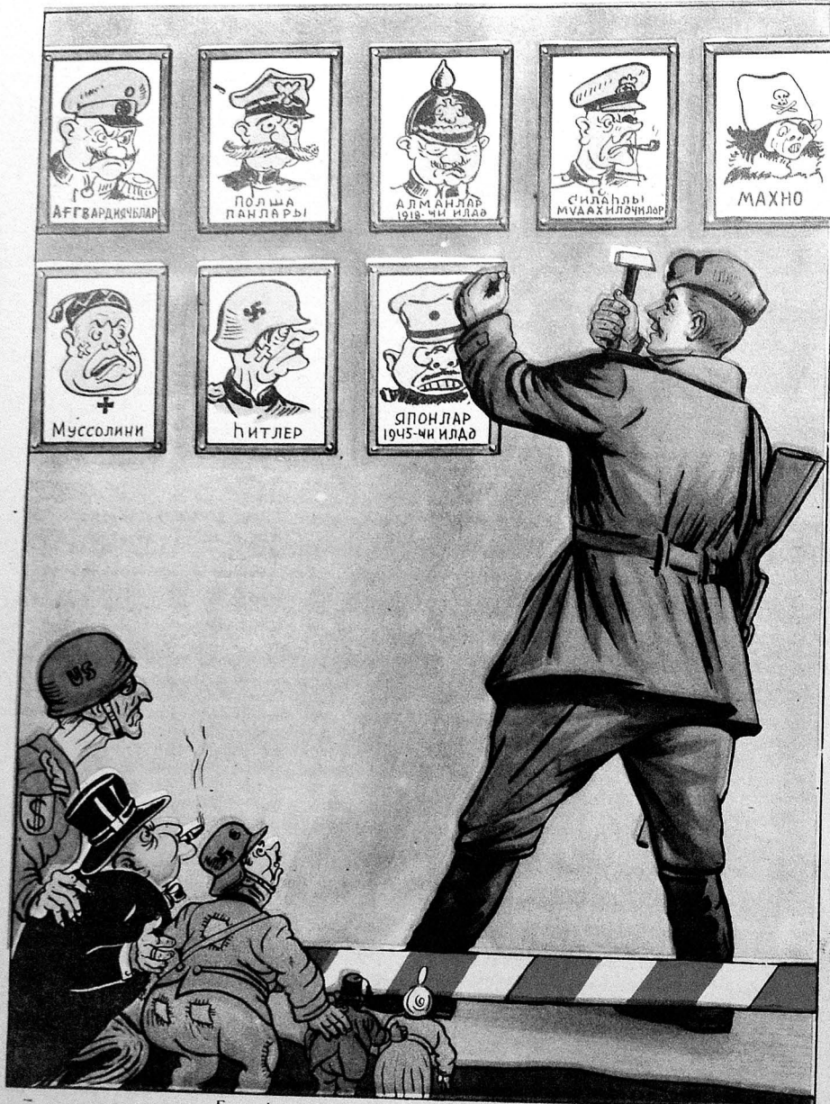
— Бу көһнә шәкилләр кимин үчүн дивара вурулду? — Тарихин дәрсини ядан чыхаранлар үчүн.

Рәдд олсун һәдә, горху сиясәти, Әв күнчүнә гысылыб галмаг олур горхагларын адәти. Фәһлә вә кәндлиләрин илк республикасында Кәнар эләйәк кәлин низә бармагларыны ганлы муһарибәнин. Биз сүлһ тәләб эдирик, анчаг ки, тохунсалар Диши мизи гычыйыб оларыг гатар-гатар. Гырғын башлаянлар көрәр чәбһәдә бир-бир Үсян әтмиш фәһләнин ваһид чәбһәси нәдир.