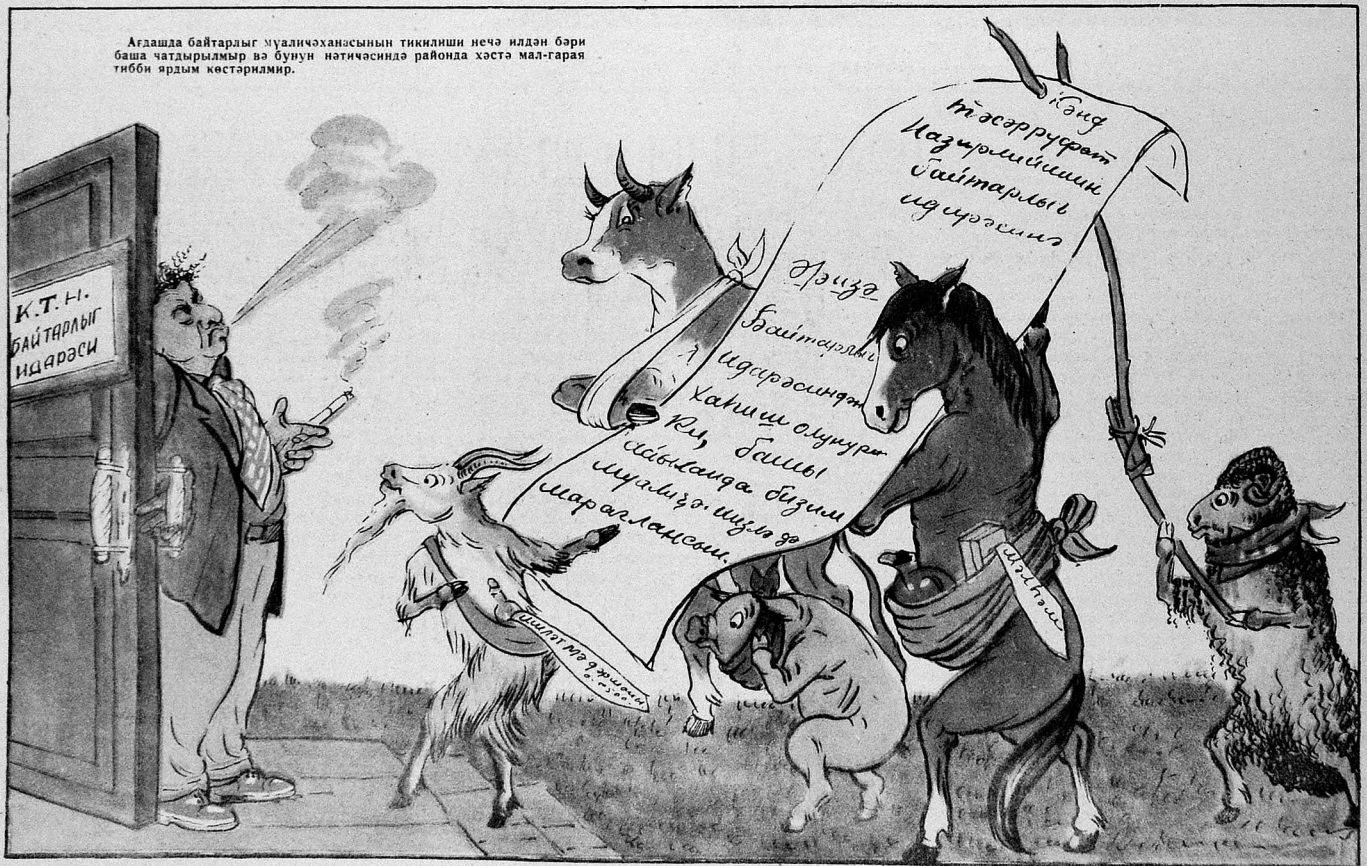
БАЙТАРЛЫГ ИДАРӘСИНИН РӘИСИ: — Бу әризәнин мәнә дәхли йохдур, әкәр өлмәйиб сағ галсаныз, тикинти-гурашдырма идарәсинә мұрачһәт эдин!