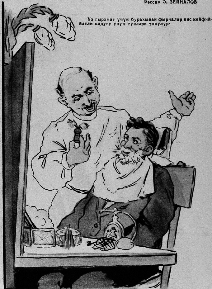
Үз гырхмаг үчүн бурахылан фырчалар лис кейфи- Мәтин олдуғу үчүн түкләри төкүләр.

ҮЗГЫРХДЫРАН — Уста, сән үзүмү сабунла- дыгча дейәсән сагалым узаныр... УСТА — Нараһат олмайын, фырчанын түкләри- дир, гырхыб темизләйчәйәм.