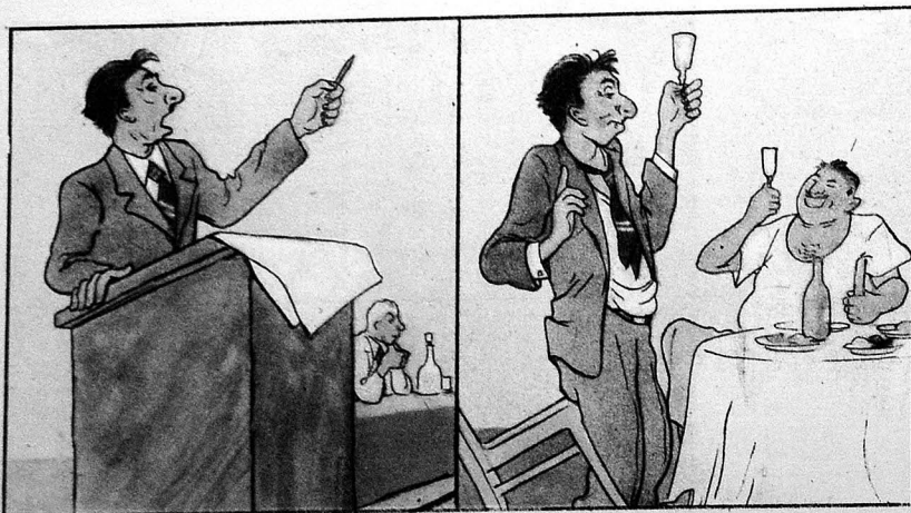
— Ички чан сағлығынын дүшмәнидир. — Ичәк чанымызын сағлығына.