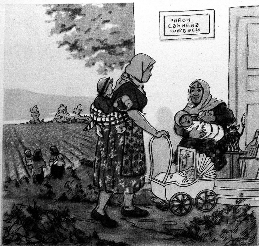
— Бу ушағы гәбул эдин, кедирәм памбыг йығмаға. — Өзүмүз ушаг гәбул этдирмәйә ер ахтарырыг.