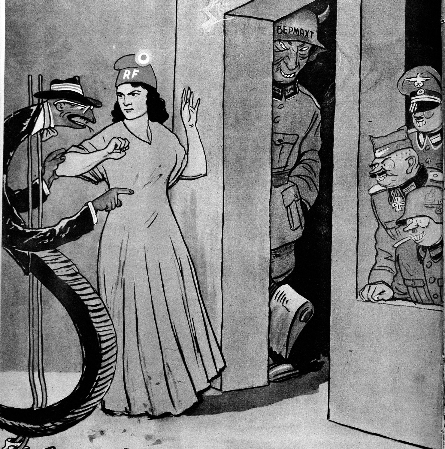
Франса — Белә достлуг баш тутмаячагдыр!