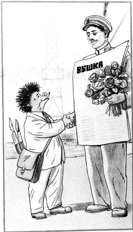
КИРПИ — Мәтбуәт күнүндә 25 иллик байрамынызы төб-рик әдирәм!