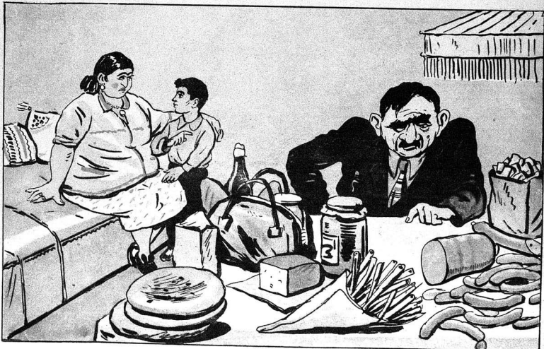
УШАГ—Атамын гаш-габагы нийә ашагыдыр? АНАСЫ—Бу күндәш-башы аз олуб, она көрә.