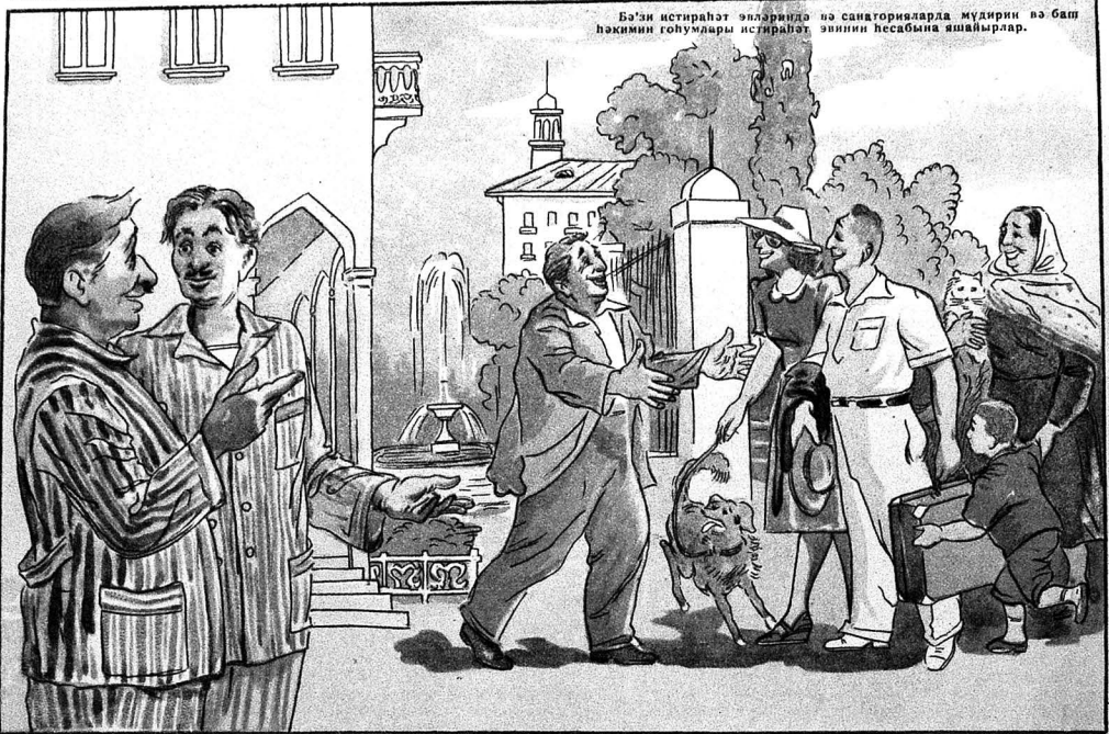
Бәзи истираҗәт эвләриндә нә санаторияларда мүдирин нә бәш һәкимин гоһүмләри истираҗәт эвлин һесәбна яшайырлар.

— Мүдир бу адамлары нә мөһрибан гарышлайыр? — Өз айле үзләридрир дә. Яй мөвсими бурада кечирөчөкләр