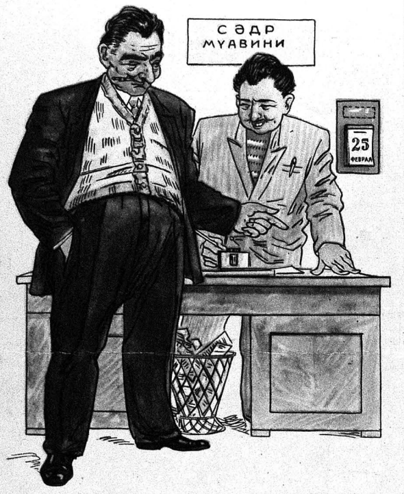
ИСПОЛКОМ СӘДРИ (муавини) — Арвадымы кооперативә мүдир, балдызымы да амбардым көндөр, кой демәсинләр ки, биз гадынлары ирәли чәкмирик.