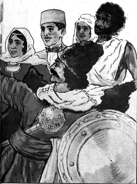
Роктор, сен биз яратдын. биз дә сени яшадачагы.