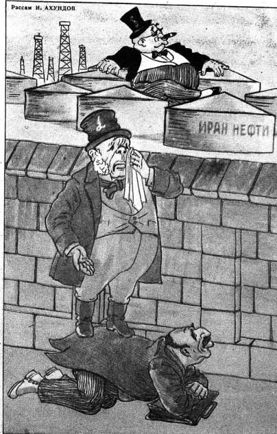
ИНКИЛИС (Мшэйи Ибад ролуды): —Инди мен бу тайда намбал иле, галмышам, Ярым о тайда ағыр иле сөһөт злэйир.