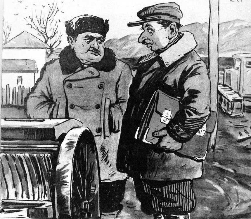
— Көрсән бу маһныи ушаглар һансы бахтавар ноһоһ сөдри үчүн охуорлар. Биздән һеч хәбәрләри йохдур ки, яза һазыр дейилин.