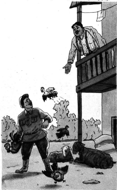
БАШ АГРОНОМ—Тоюг ч'үч'эни говубу най-куй салма, бу дилсиз, агысыз б'өйваны көс ки, с'эс-с'эмири ч'ыкмысын.