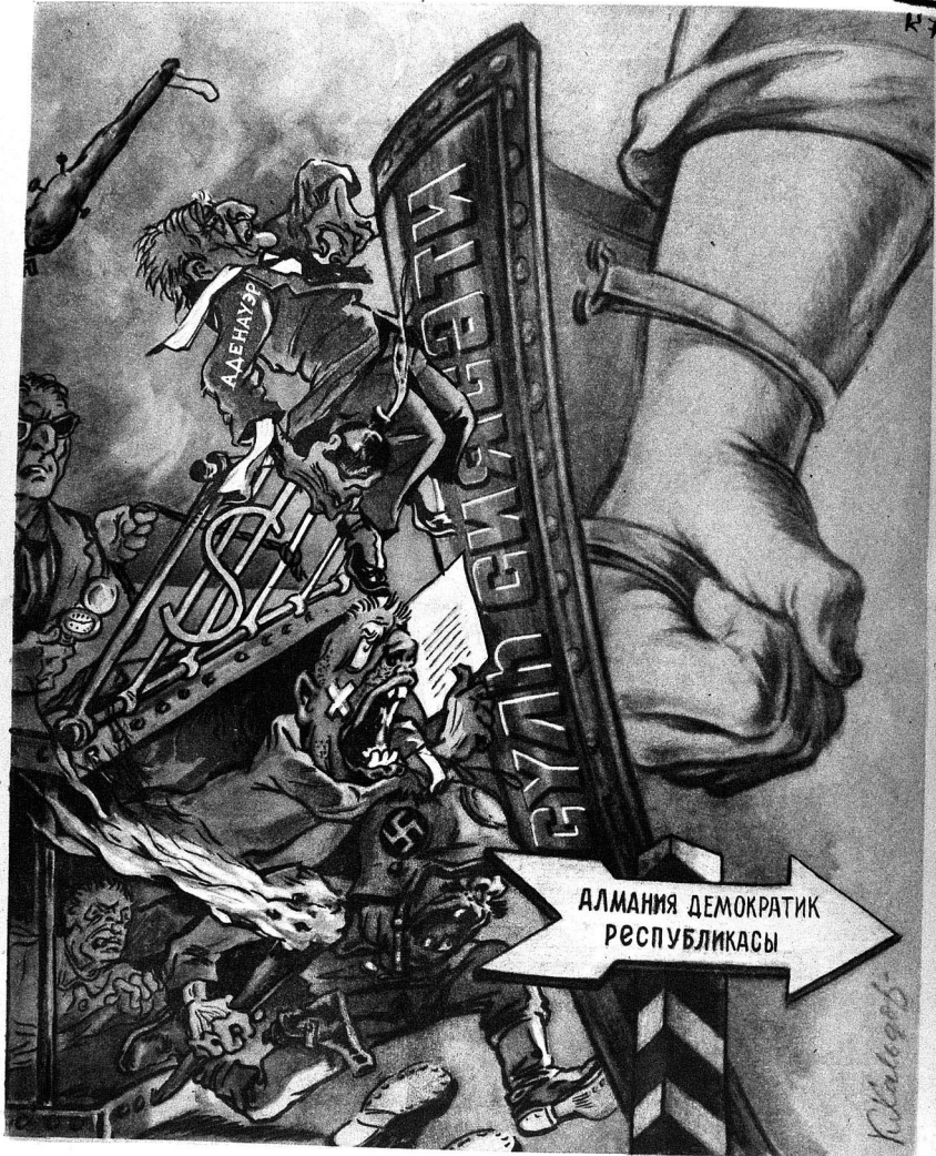
Баш тутмайн фитнескарлыг.