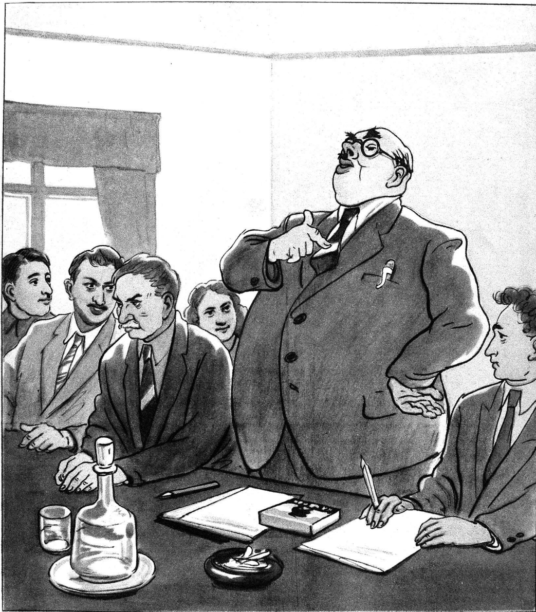
ИДАРАҒ МУДИРИ—Мен коллектив раҳбарлиин төрефарыям, бу шөртлө ки, мен өмр эдим, сиз өрине өтирин.