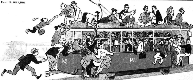
Бачаран минсин, бачармаян өзүндөн күссүн.