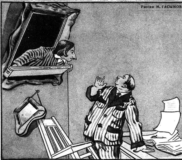
ГОГОЛ (Тәҗдидийә)—Йохса, ядыныздан чыкыб ки, сизә Гоголлар вэ Шедринләр лазымдыр. Бәс не үчүн юмор вә сатира һаггында бир көлмә язмырсыны!

Анчак һаһаг ерә. Мүтәхәссилерн дединә көрә ээли өвү үчүн яй фәсли эн элверини замандыр.