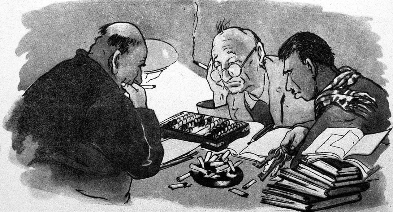
Гызылкул олмайды, Саралыб солмайды.