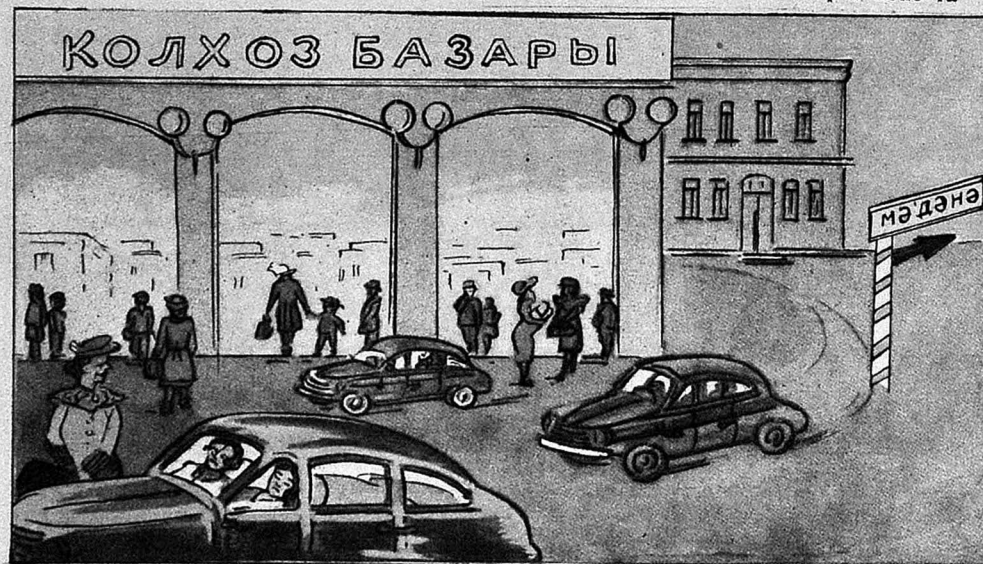
Азәрнефт машынларындан хусуси ишләр үчүн истифаде эдилер.

Әмр әмрлийиндә галыр, Сталиннефт, Молотовнефт трестләринин рәисләри өз катибләрийнә енә дә шәхси гуллуғчу кими баһырлар. Бу катибләр идарә иши көрмәк өзәзинә, бүтүн күнү чай кәтирәр, папирос алмаға кеدير вә шәхси тапшырығлары ери-нә етирирләр.