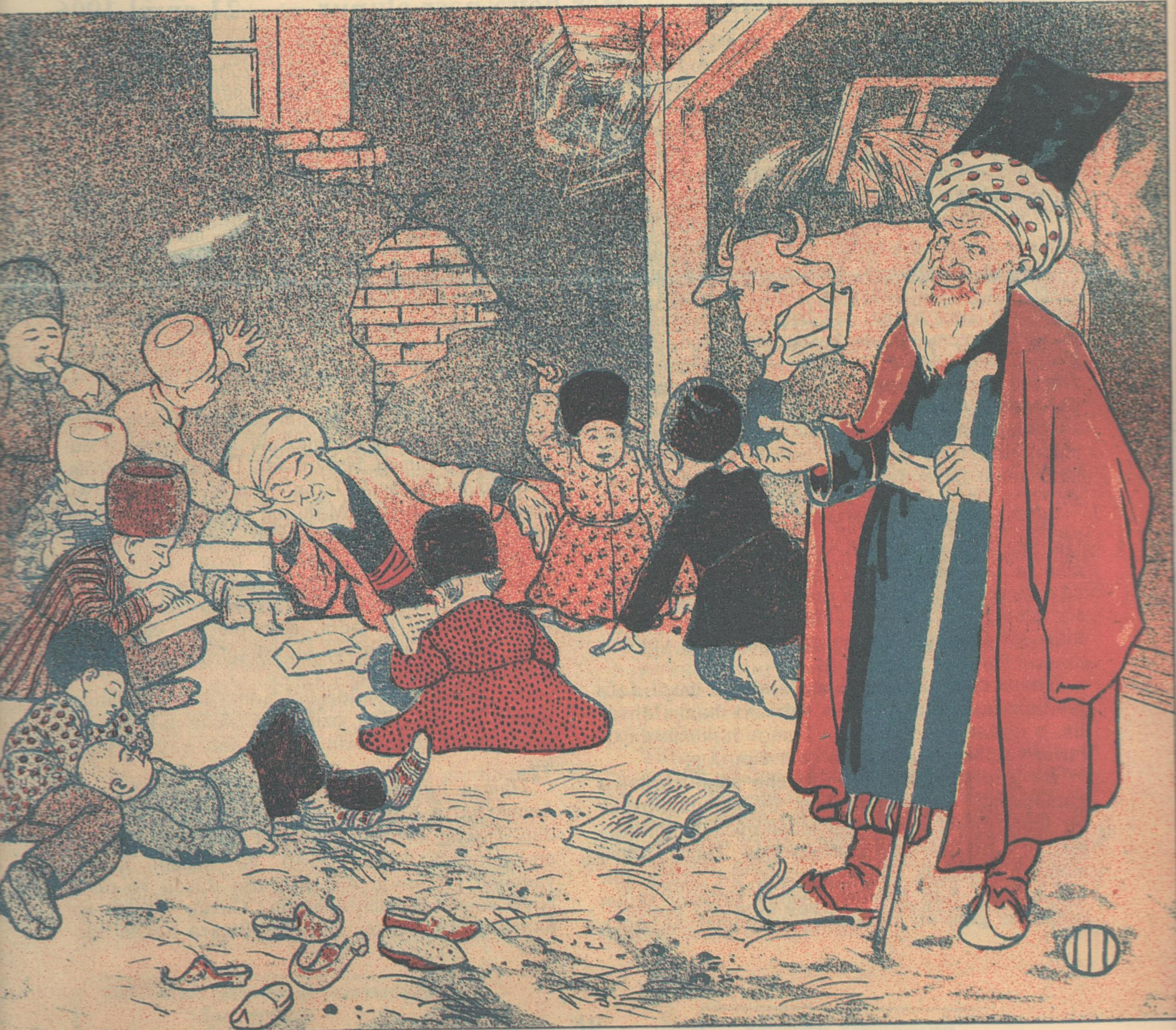
Qafqazda mədrəseyi-ruhaniyyə (Kavkaz, Musulmanskaya duxovn. Seminariya)