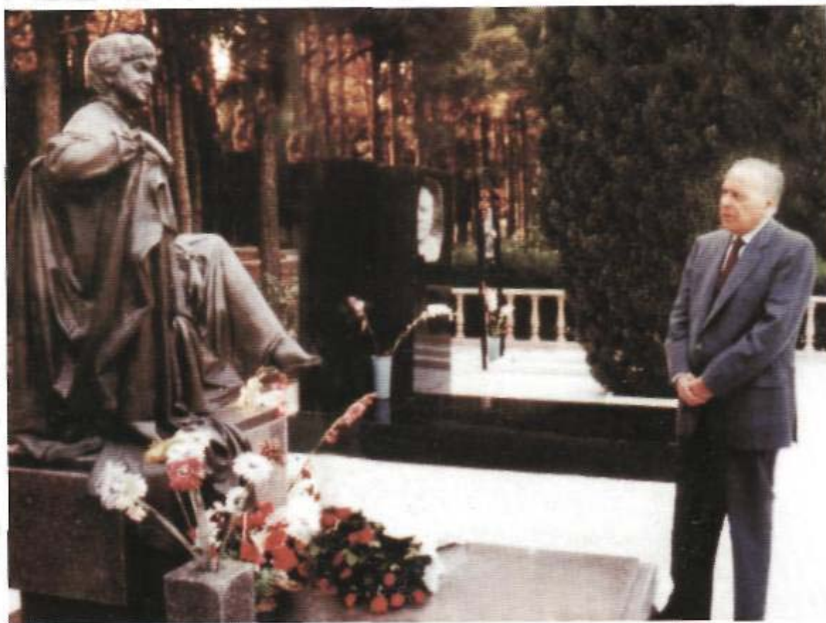
Ulu Öndər Heydər Əliyev Zərifə xanımın məzarını ziyarət edərkən.