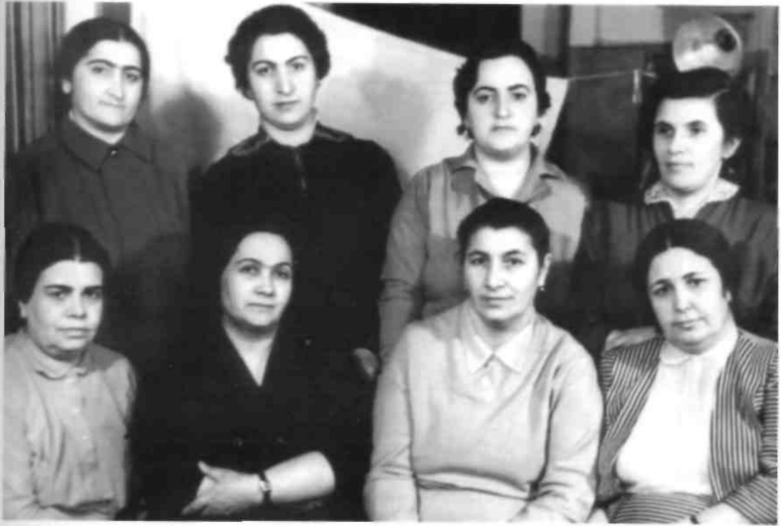
Bakı, 1977-ci il.