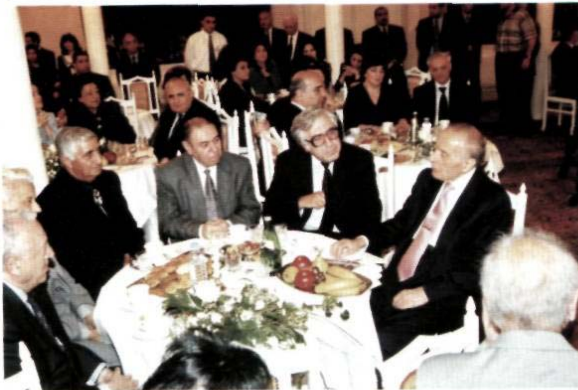
Akademik Zərifə xanım Əliyevanın xatirə günü. 2000-ci il.