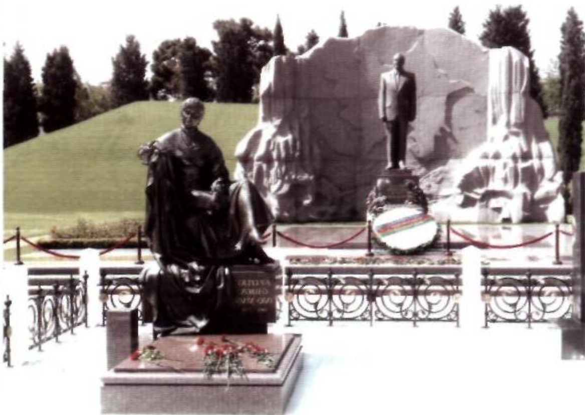
Fəxri Xiyaban. Ulu Öndər Heydər Əliyevin və akademik Zərifə xanım Əliyevanın məzarları.