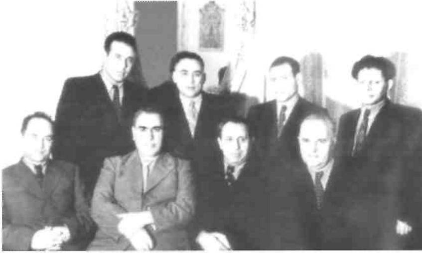
Əziz Əliyev qohumlar və dostlar arasında (ikinci sırada soldan birinci Heydər Əliyev). 1954-cü il.