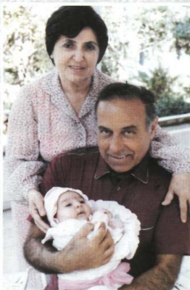
Zərifə xanım və Heydər Əliyev nəvələri Leyla ilə - 1984-cü il.