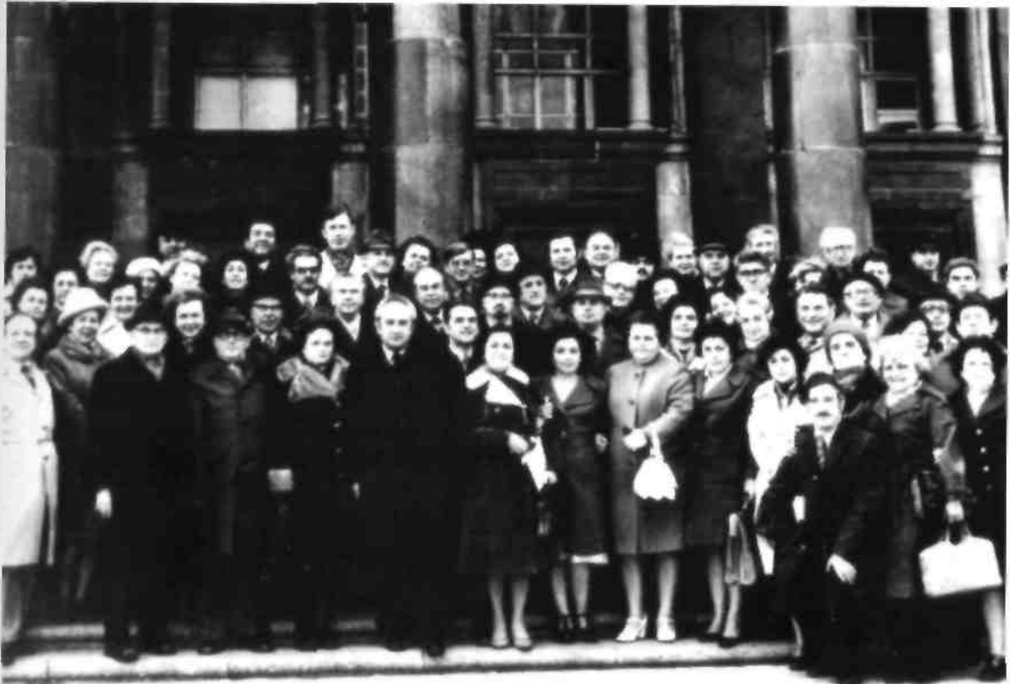
Bakıda keçirilən Oftalmoloqların Ümumittifaq Konfransı. 1977-ci il.