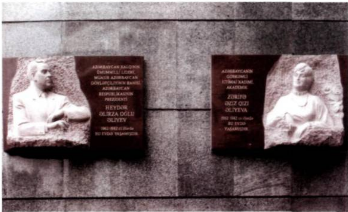
Ulu Öndər Heydər Əliyevin və akademik Zərifə xanım Əliyevanın yaşadıkları binadakı büstləri.