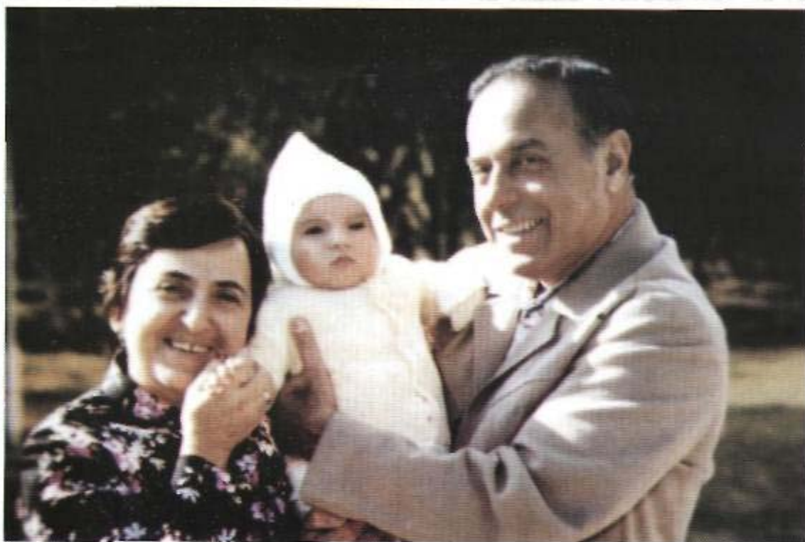
Zərifə xanım və Heydər Əliyev nəvələri Zərifə ilə - 1981-ci il.