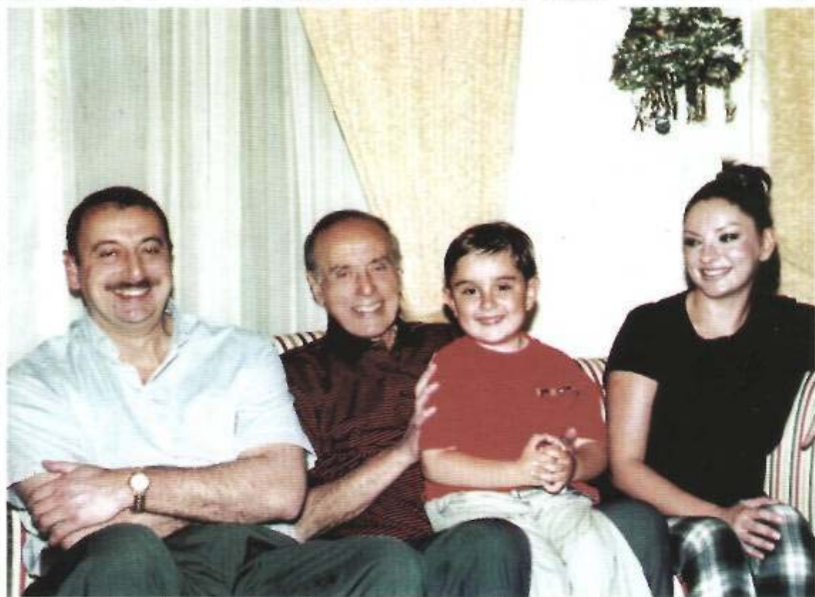
Ulu Öndər Heydər Əliyev ailəsi ilə.