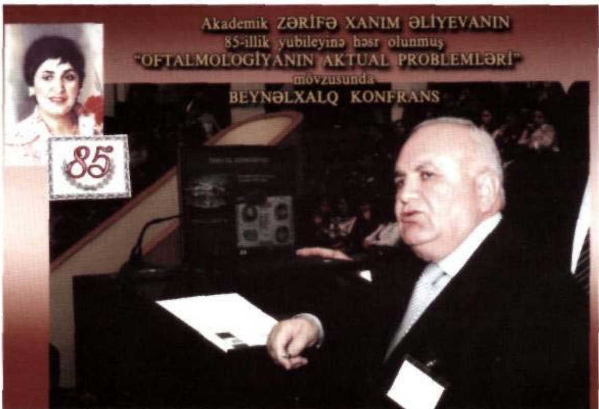
Bakı, 2008-ci il.