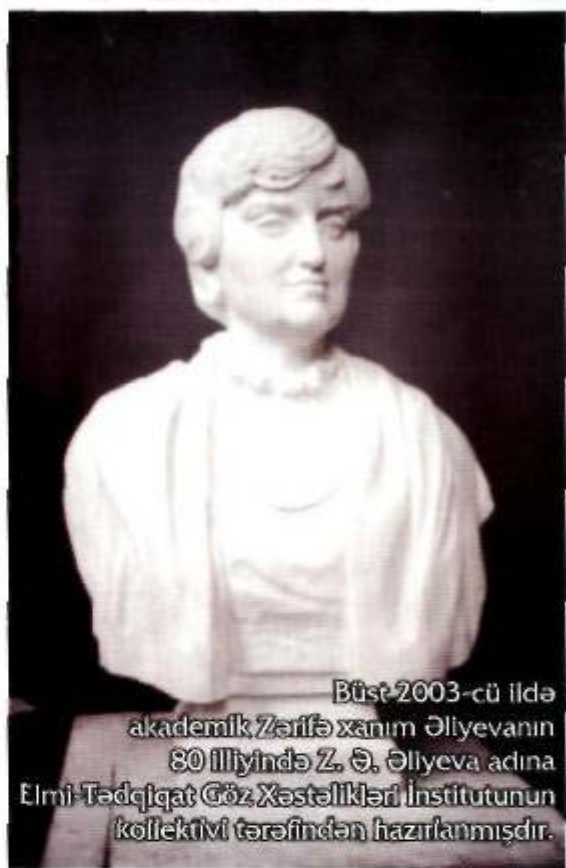
Büst 2003-cü ildə akademik Zərifə xanim Əliyevanın 80 illiyində Z. Ə. Əliyeva adına Elmi-Tədqiqat Göz Xəstəlikləri İnstitutunun kollektivi tərəfindən hazırlanmışdır.