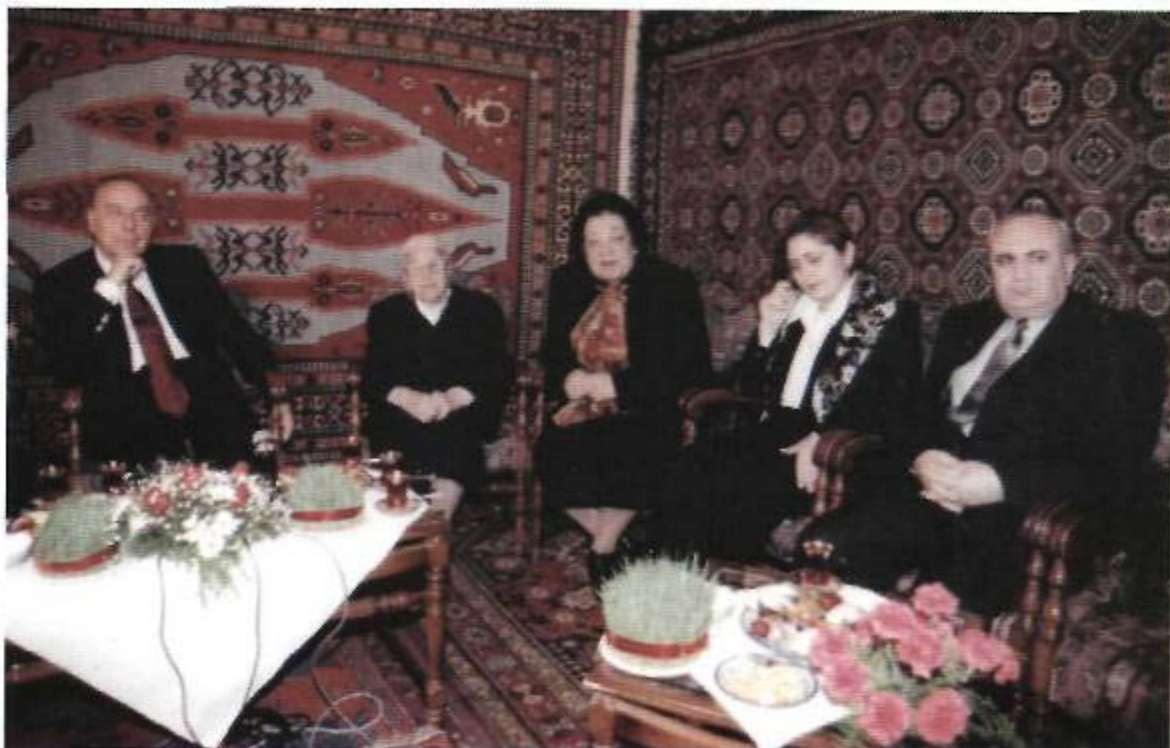
Bakı, 2001-ci il.