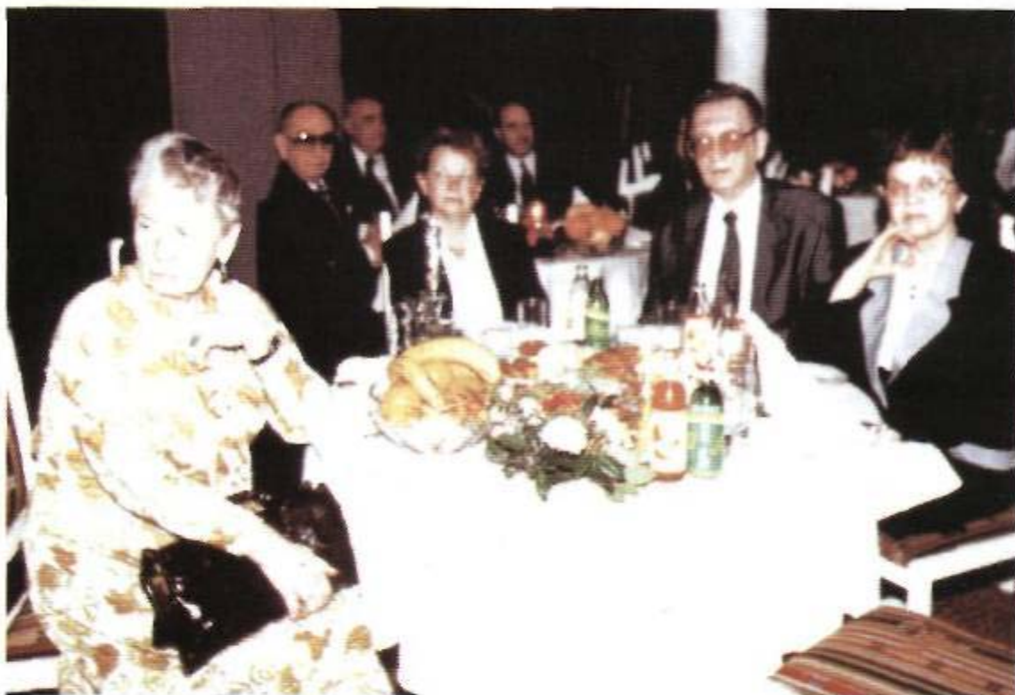
Xatirə gecəsi - 1995-ci il