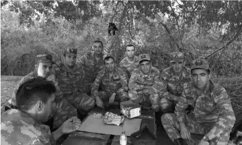
Nurlan döyüş yoldaşları ilə