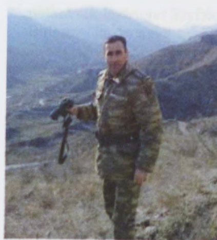
polkovnik Teymur Niftaliev