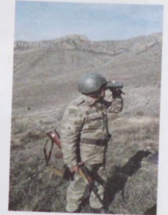
polkovnik Yaşar Kərimov və polkovnik-leytenant Vasif Xəlilov