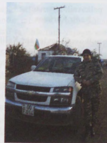
polkovnik-leytenant Anar Mikayılov