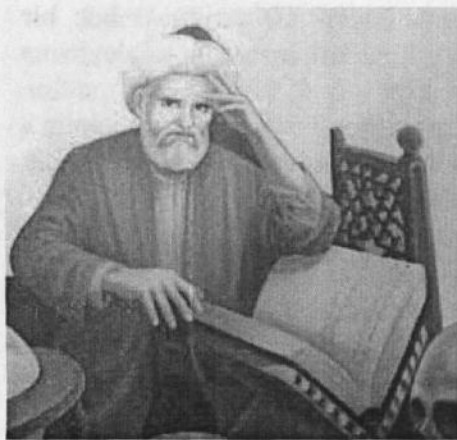
ƏRZURUMLU İBRAHİM HAQQI (1703-1780)

Ərzurumlu İbrahim Haqqı 1703-cü il may ayının 18-də Ərzurumun Həsənqala bölgəsində dünyaya gəlmişdir. Kiçik yaşlarda anasını və daha sonra atasını itirən İbrahim Haqqı, bir müddət əmisinin yanında qalmış, bu müddət içində təhsilinə davam etmişdir. 1747-ci ildə İstanbulla gələrək 24-cü Osmanlı padşahı və 103-cü İslam xəlifəsi Sultan I Mahmud (1696-1754) ilə görüşmüşdür.