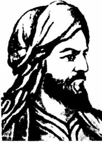
MAHMUD ŞƏBÜSTƏRİ (1287-1320)

S ufizmin ən görkəmli alimi Səəd əd-Din Mahmud ibn Əbdul Kərim ibn Yəhya Şəbüstəri Təbrizi Cənubi Azərbaycanda Təbriz yaxınlığındakı Şəbüstər adlanan yerdə 1287-ci ildə ilahiyyatçı ailəsində anadan olmuşdur.