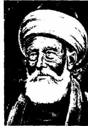
HACI BƏKTAŞI VƏLİ (1209 - 1271)

Kamaldan söz payı verirəm, sənin nə işin (var) ki mənə layiq deyil. Mənim vaxtım buna görə daim xoş keçər, çünki könülüm kasıblıq yolunda gedir. Önünə gələn hər şeyə razı oldu, nə qədər buyurar(sa) vaxtın (əmr) olar. Qənaət ilə iç xəzinə yüklənmiş, boş mövqe və maldan fariğ olmuş. Nə mədrəsə nə qazi nə natiq nə Xoca nə vaiz nə ədibdir. Mənim Zöhrəm (ulduzum) o mövqedən gedər ki könülüm şeyximin qoxusunu duyar. Bütün dostlarım böyük oldular, riyazətlə hamısı ulu (kəslər) oldular. Hər birinin (halının) şərhini verə bilməm. Xuda hər kəsə xeyr versin. İndi sözün düzümün çəkim, çünki sözün bəyanına sərhəd yoxdur. Hər kəsə yaxşı xasiyyət adət olsun, hər kəsin sonu səadət üzərə olsun.