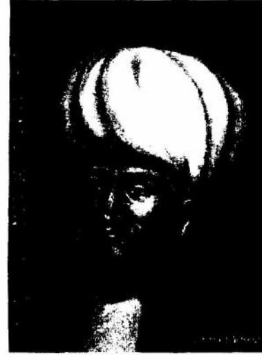
ƏHMƏD YƏSƏVİ (1093-1167)

Elm ilə, hikmət ilə kimsə girməz bu sirrə Bu bir əcayib sirdir, elmə, kitabə sığmaz. Biz də qoca sufi Yunusu elmə, kitabə sığışdırma bilmədik...