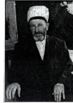
SÜLEYMAN HİLMİ TUNAHAN

10. Vəlilər kəşf və ilham deyilən bir göndər Allahdan bəzən xüsusi məlumatlar ala bilərlər. Etibarlı olub olmamaları, müxtəlif şərhlərə açıq olmaları baxımından bu cür məlumatların müxtəlif dərəcələri vardır. Kəşf və ilham yoluyla əldə edilən ən möhkəm məlumatlar belə ancaq ilhama məzhər olan adamın özü üçün dəlil ola bilər. Başqaları üçün bağlayıcı dəlil deyil. Bu cür məlumatlardan faydalanmaq üçün bunların Quran və hədislərin açıq və qəti hökmlərinə zidd olmaması şərtidir. Əbu Səid el-Harrazın dediyi kimi: «Zahiri hökmlərə zidd olan hər batin batildir.»