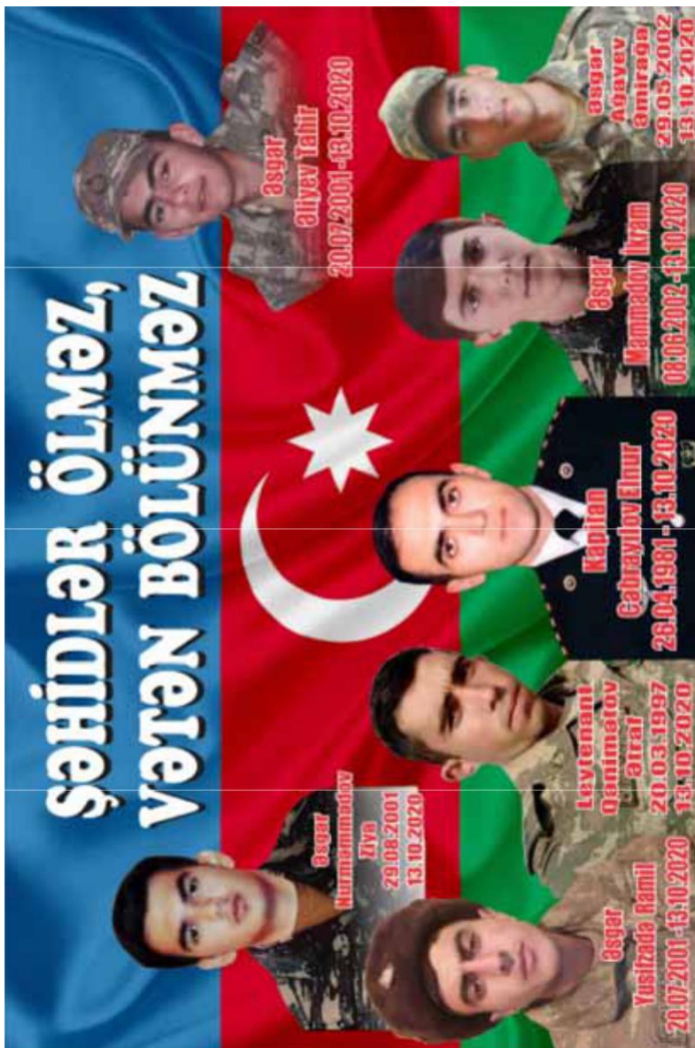
Şəhidin evində olan xatirə lövhəsi