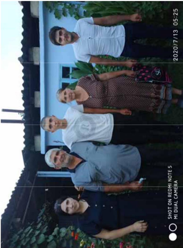
Ailəsilə sonuncu şəkili, hərbi xidmətə gedən gün (13.07.2020)