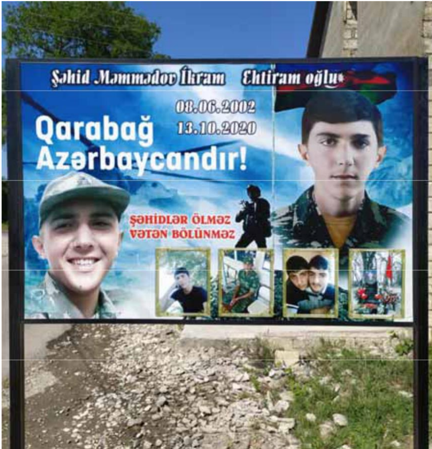
Çiləgir kəndinin girişi