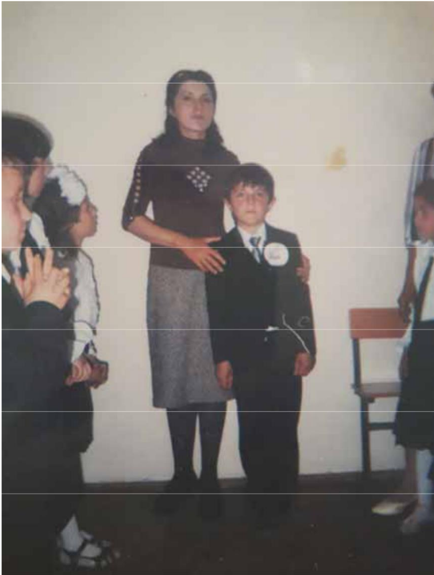
İbdirai sinif müəlliməsi və sinif yoldaşları