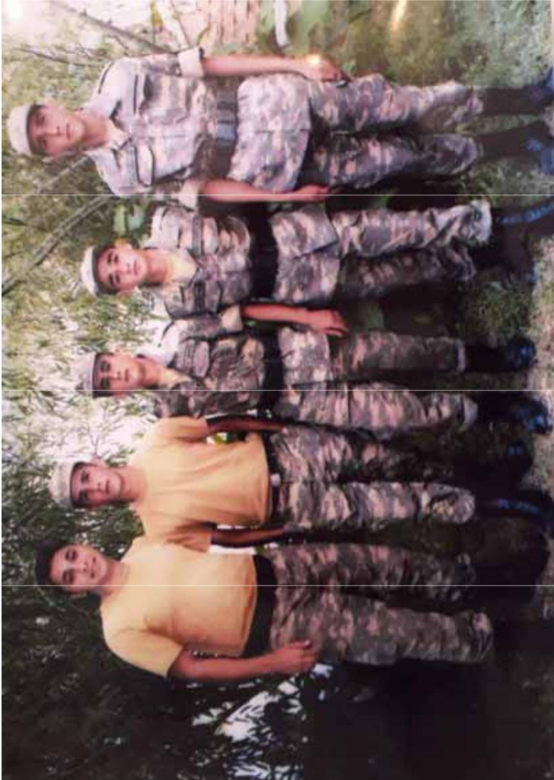
Füzulidə eyni anda şəhid olan hərbi qulluqçular. (Sağdan ikinci)