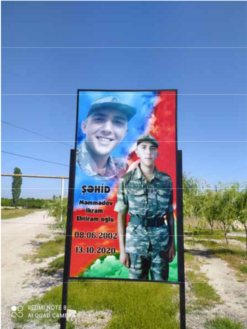
Çiləgir kəndinin mərkəzi