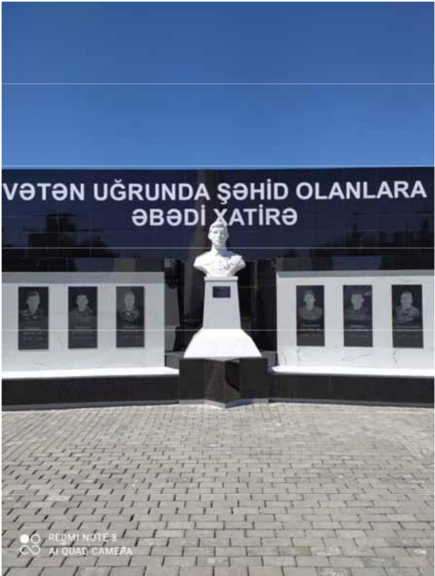
Xaçmaz Şəhidlər Xiyabanı