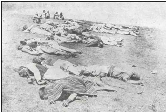
23 İyul 1915-ci ildə Diyarbəkriñ Licə qəzasına baęlı Qum və Çom kəndlərində erməni komitaçıləri tərəfindən şəhid edilən türk əsgərləri