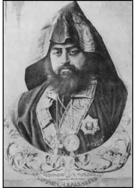
Erməni keşişi -Xirimyan