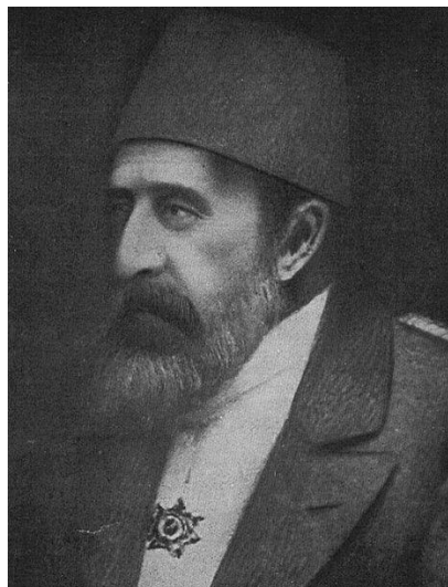
Ermənilərin "Qızıl Sultan" adlandırdıqları II Əbdülhəmid