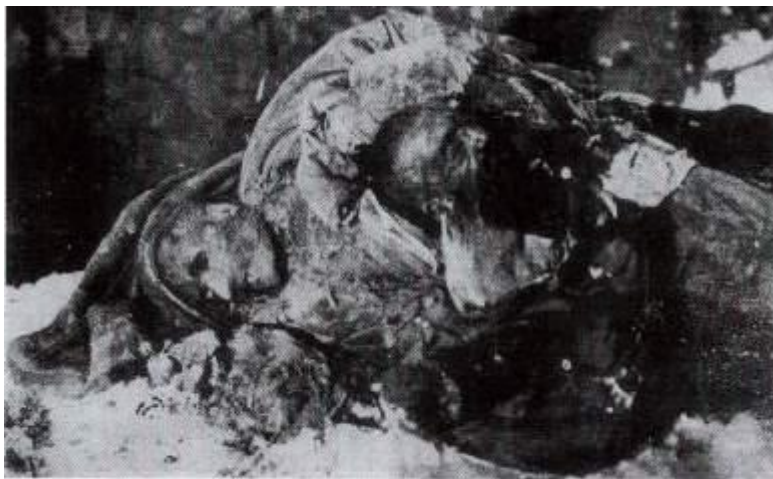
Ərzincanın Odabaş məhəlləsində gözləri ovularaq şəhid edilmiş türklərdən bir neçəsi