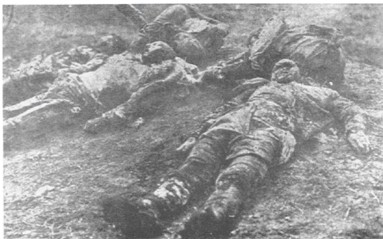
Ermənilərin Qarsda qətlə yetiridkləri türk əsgərləri