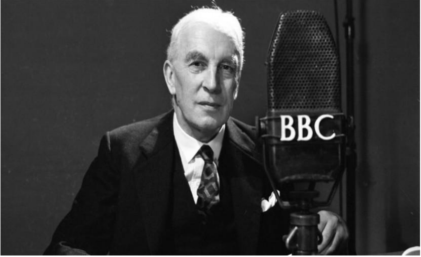
Arnold Toynbi – “Mavi kitab”ın müəllifi