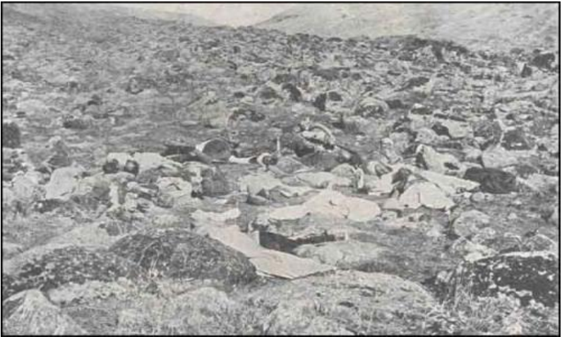
Ermənilərin Van şəhərində qətlə yetiridkləri türk əsgərləri