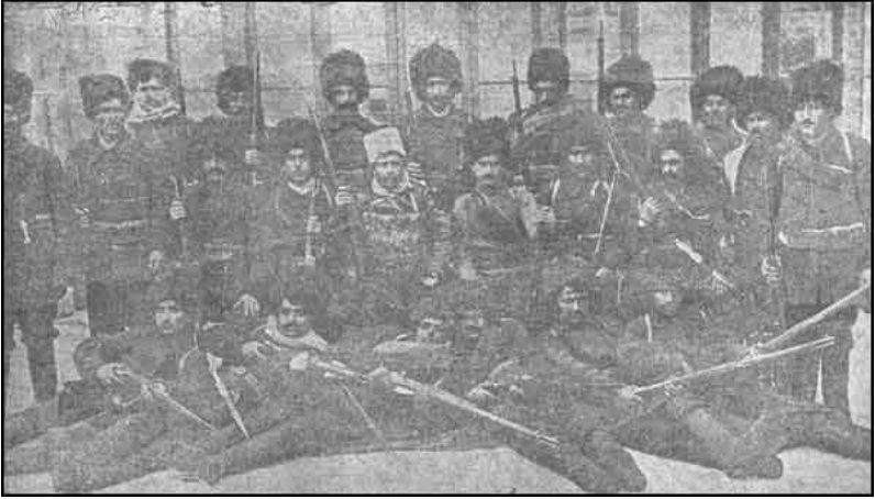
Qnçaq silahlı dəstələrindən bir qrupu