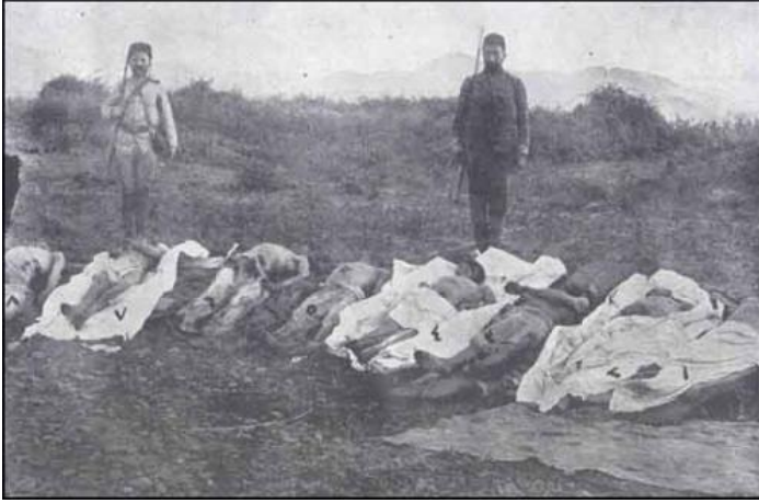
İzmitin Kollar kəndində balta ilə qətlə yetirilmiş türklər