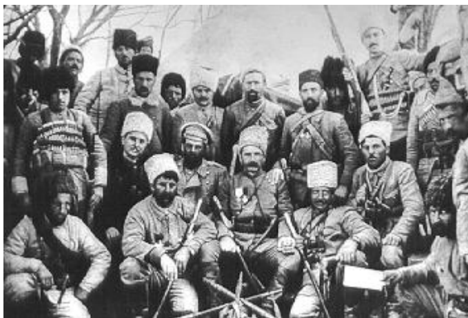
Erməni silahlı millətçi dəstələri 1915