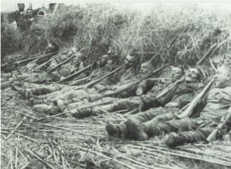
Ermənilərin Sarıqamışda amansızlıqla qətlə yetirdikləri türk əsgərləri