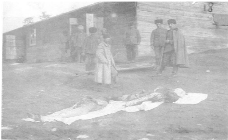
Ermənilər tərəfindən Sarıqamışda süngüyə keçirilərək şəhid edilmiş türk əsgəri