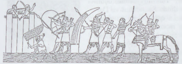
Manna qalasına hücum

məhkəməyə rəhbərliyi həyata keçirirdi. İranzu paytaxt İzirtu şəhərində və digər iri yaşayış məskənlərində abadlıq işləri görür, qala divarlarını möhkəmləndirirdi. Assuriya relyeflərindəki şəkillərdən məlumdur ki, İzirtu şəhəri bürclərlə əhatə olunmuşdu. Şəhərin mərkəzində