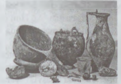
Hunlara aid qablar

boyları, cözəl sifətləri, dərilərinin ağ və tüksüz olması ilə seçilir. Toraman Təkinin ölümündən sonra paytaxt Sakala şəhərində onun oğlu Mihiraqula hökmdar elan olunur. Hind mənbələrində o "Filləri məhv edən", "Dünyanı dağdan" ləqəbi ilə tanınır. Atasının bütün yürüşlərində erkən yaşlarında iştirak edən Mihiraqula cəsurluğu ilə döyüşçülər arasında şöhrət qazanmışdı. O taxta çıxan kimi ilk növbədə Teleutlarla müharibəyə başlayıb 516-cı ildə parlaq qələbə qazanır. Mihiraqula 518-ci ildə Jujan hökmdarı ilə müqavilə bağlayır və onun üç qızı ilə evlənir. Yeni yürüşlərə hazırlaşan hunlar ordunun sayını artırır.