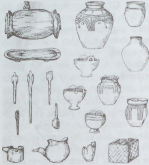
19c Hun kurqanlarından tapılanlar

belə vəzifəyə təyin olunması çinli əyanların narazılıqlarına səbəb olur. Əvvəlcə onlar sarayda sui-qəsd təşkil edirlər. Lakin Çzyan sui-qəsdlərin üstünü açaraq iştirakçılarında