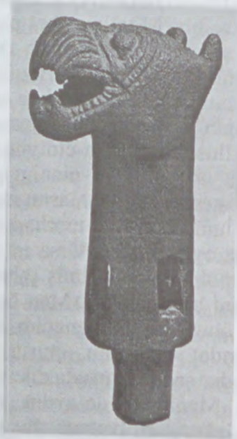
Həsənliyə tapılan tunc asa başı

şərəfinə ziyafət verildi. II Sarqon Urartunu darmadağın etdi. Rusa ağır məğlubiyyətə dözə bilməyib özünü öldürdü. Ullusununun xahişi ilə Sarqon atçılığın inkişaf etdiyi Subi vilayətini Urartudan alıb Mannaya qaytardı. Yürüşdən sonra Mannada sabitlik yarandı. Darmadağın edildikdən sonra zəifləyən Urartu dövləti görünür bir müddət elə bir təhlükə təşkil etmirdi. Bundan istifadə edən Manna tədricən sərhədlərini genişləndirir. Mannanın vəziyyəti elə möhkəmləndi ki, artıq II Sarqonun varisləri dövründə Ullusunu Assuriyanın üstünlüyünü tanımaqdan imtina etdi və bəzi Assuriya yaşayış məskənlərini ələ keçirə bildi. Assuriya hökmdarı Sinaxxerib və Urartu hökmdarı II Arğişti Mannaya hücum etsələr də məğlub oldular. Ullusunun dövründə Manna da kənd təsərrüfatı, sənətkarlıq xeyli inkişaf etmişdi. Yeni suvarma kanalları çəkilmişdi. Ullusunun vəfatından sonra hakimiyyətə Ahşeri gəlmişdi.