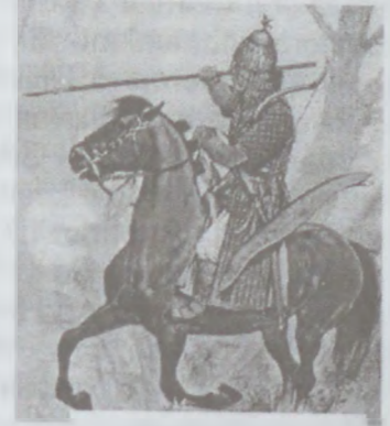
Ağ Hun süvarisi

Böyük Hun imperiyasının süqutundan sonra türk tayfalarının qərb torpaqlarına köçü başlandı. Bu köç prosesində hun tayfalarının bir hissəsi cənub torpaqlarına çəkilərək Qərbi Türküstanda möhkəmlənmiş və Ağ Hun imperiyasını (420-567-ci illər) yaratmışdılar. İlk vaxtlar pərakəndə halda yaşayıb köçəri maldarlıq və ovçuluqla dolanan hunlar tədricən güclənir, şəhər həyatı, sənətkarlıq, ticarət, əkinçiliklə məşğul olmağa başlayır. Digər qəbilələr daha güclü Uar və Hun qəbilələrinin ətrafında birləşirdilər. Yavaş-yavaş Ağ Hunlar müasir İranın şərqini, Əfqanıstanı, Hindistanın şərqini, Tacikistanı, Özbəkistanı, Qazaxıstanın çox hissəsini ələ keçirirlər. Yerləşdikləri bölgəyə görə onları "Orta Şərq hunları" da adlandırırlar. Ağ Hunlar özlərini Xionit adlandırırdılar. Məşhur hökmdarlarından birinin adı ilə onları həmçinin Eftalitlər dövləti kimi tanıyırlar. Tədqiqatçılar bir müddət onları fars dilli xalq kimi qələmə verməyə cəhd etsələr də keçən əsrin ortalarından aparılan araşdırmalar onların türk olduğunu qəti sübut etdi. IV əsrin ortalarından Ağ hunların bir hissəsi Zərdüşt dinini, bir hissəsi xristianlıq və buddizmi qəbul etdi. Sasani şahı I Şapur (309-379-cu illər) şərqdən gələn təhlükəni hiss edib onlarla mübarizəyə başladı. Bir neçə illik səmərəsiz, ağır maddi və insan itkilərindən sonra şah hunlarla bacara bilməyəcəyini görüb mübarizəni dayandırdı. 356-cı ildə