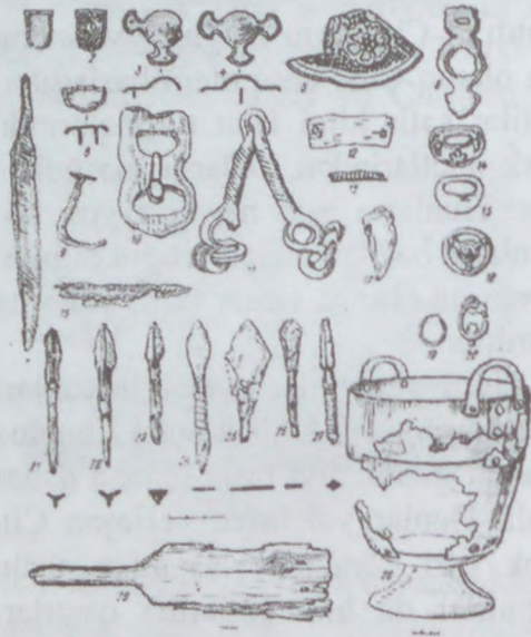
Kurqandan tapılan əşyalar

bəyi Çinə sığınmaq üçün ətrafındakılarla birlikdə gəldilər. Daha sonra hun böyüklərindən Su Lu və onun beş adamı da gəlib Çinə təslim oldular. İmperator daha sonra Çinə sığına biləcək digər hun bəylərini təşfiq etmək üçün onlara böyük rütbələr verdi.” E.ə. əvvəl 141-ci ildə Çində müharibə tərəfdarı olan Bu imperator taxtına çıxdı. O hunlara nifrət etsə də ilk vaxtlar bunu biruzə vermirdi və dostluq müqaviləsini təzələyib tanhuya çoxlu hədiyyə göndərirdi. O bir neçə il ərzində 300