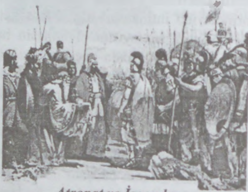
Atropat və İsgəndər

Azərbaycanın qədim dövlətlərindən biri olan Atropatenanın banisi, antik dövrün görkəmli dövlət xadimi, şöhrətli sərkərdə. Azərbaycanın cənubunda 450 ilə qədər hakimiyyət sürmüş türk mənşəli Atropatilər sülaləsinin banisi olan Atropat uzun illər İran Əhəməni dövlətinin vilayət hakimlərindən biri-Satrap olmuşdur. Atropat sözünün mənası "odu qoruyan" deməkdir. Mənbələrdən məlumdur ki, o hələ Əhəməni şahı Artakserks tərəfindən Kiçik Midi-