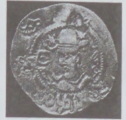
Ağ Hun sikkəsi