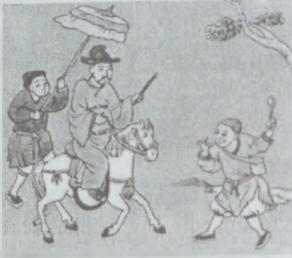
Çin səfiri hunlar arasında

Şimali Çində hun tayfalarının yaratdığı kiçik dövlətlərdən birinin-Şimali Lyan dövlətinin (397-439-cu illər) banisi. Quldarlıq quruluşunun süqutundan, Xan imperiyasının dağılmasından sonra Çində hərə-mərclik dövrü