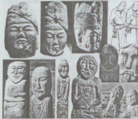
Hunlara məxsus abidələr

157-ci ildə çinli sərkərdə tanqut tayfalarının köməyi