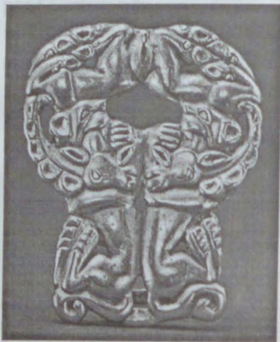
Hun dövrünə aid toqqa

bildirmişdir ki, tezliklə peyda olan hunlar Çin imperiyasına son qoyacaq. Mənbədə qeyd olunub: "İmperator Tsinq Şi Xuandi hunlardan böyük bir təhlükə gələ biləcəyini fal kitabından öyrənən kimi sərkərdəsinə 300 minlik bir ordunu hökmü altına alıb hunlara hücum etməsini əmr elədi. Sərkərdə irəliləyərək Sarı çayın cənubunda olan bütün zonaların hamısını tutdu. Çayın sahilləri boyunca sədlər çəkdirildi. Həndəvəri divarla əhatəli 44 qəza mərkəzi quruldu. Bu zonaları