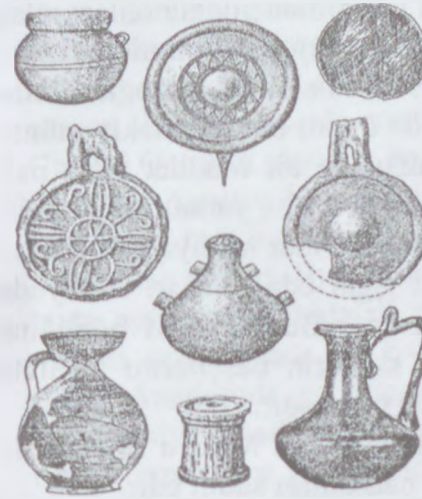
Kurqanlarda tapılan gil qablar

hazırlayırdılar. Arxeoloji qazıntılar zamanı Şimali Qafqazda, Krımda, Azərbaycan Respublikasında skiflərə məxsus kurqan qəbirlər tədqiq olunmuşdur. Belə qəbirlərə misal olaraq Cənubi Osetiyadakı Tliy kurqanını göstərmək olar. Bu qəbirlərdən tapılan yüksək keyfiyyətli maddi-mədəniyyət nümunələri-gil qablar, baltalar, tunz qazanlar, xəncərlər, nizə ucluqları, vazalar, boyunbağılar, bilərziklər, sırğalar hazırlanma texnikası ilə hamını heyrətə