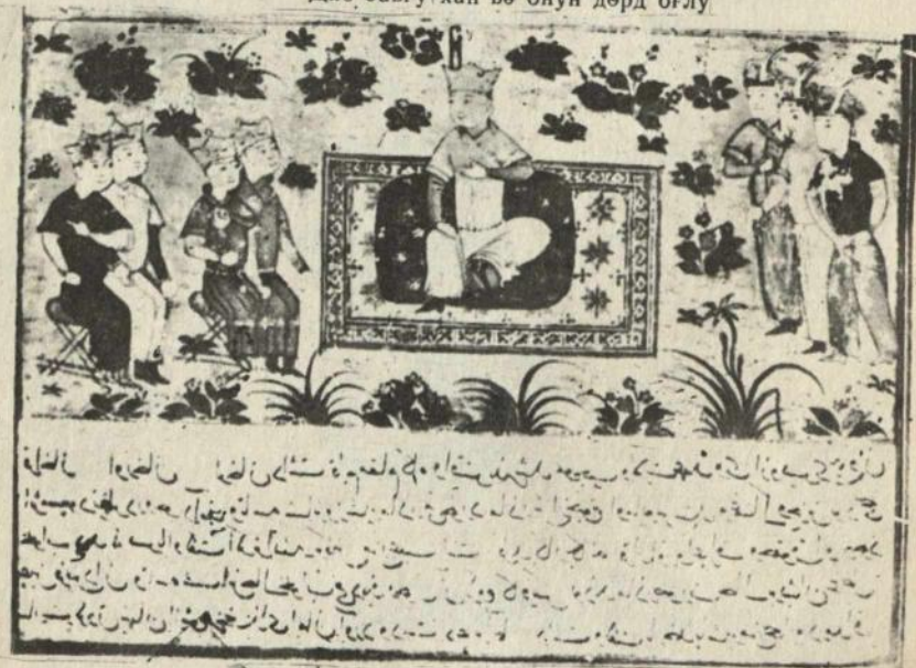
Диб. Јавгу хан, онун дөрд оғлу вә ә'жанлары

лјо 7 вә В. Бангдан 8 башлајараг, абидәнин филологи хусусијјәтләри, поетик форма вә ритмикасы Ғ. Н. Оркун 9 , А. М. Шербак 10 , К. Ераслан 11 вә А. Н. Кононов 12 тәрәфиндән әтрафлы шәкилдә арашдырылмышдыр.