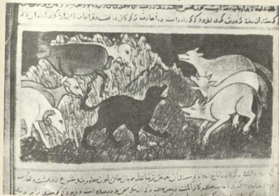
Қара Барақын ити чанаварларла вурушур