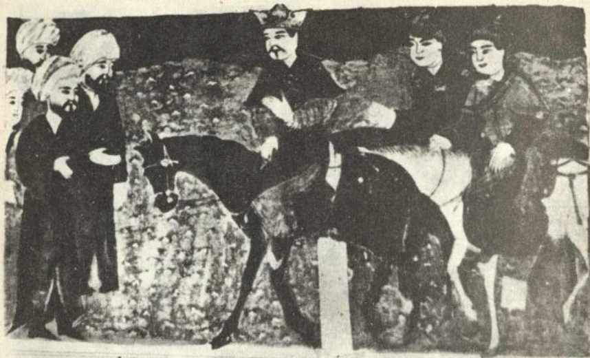
Оғуз ва Дәмәшг елчиләри