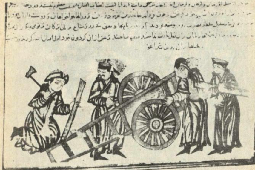
Ики тәкэрли араба рәсми