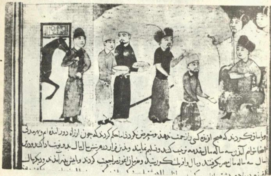
Оғуз ва Дәмәшг елчиләри

гајтарылмајынча сизин һеч биринизи бурадан сағ-саламат бурахан дејиләм».