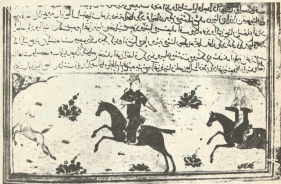
Оғуз овда, гуллушчунун хәбәрдарлығы