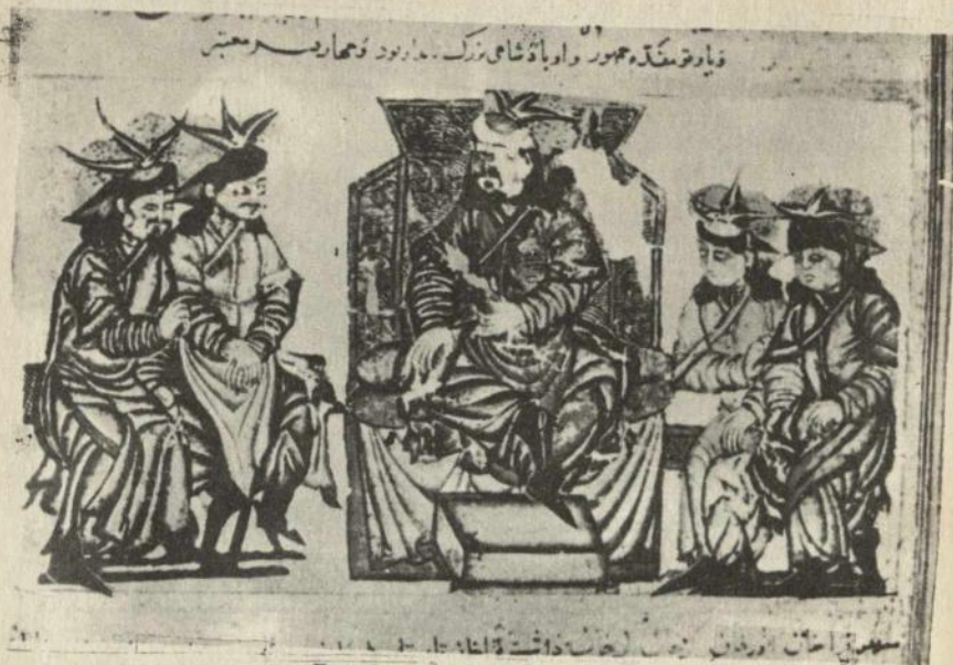
Диб. Јавгу хан вә онун дөрд оғлу