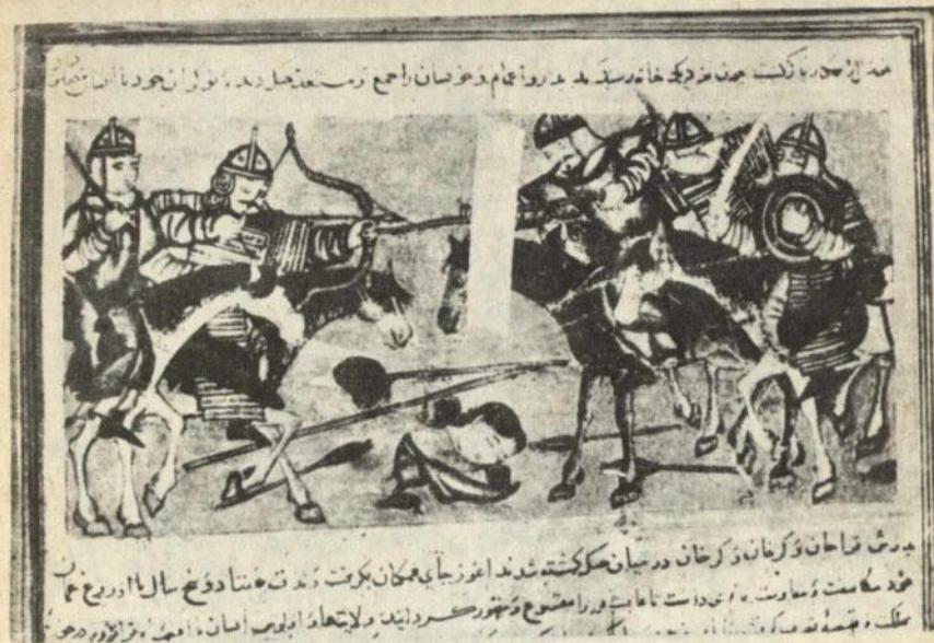
Огузун атасы вэ әмилэри илэ вуршмасы

Огуз деди: «Бир һалда ки, сиз өз күнаһынызы киши кими бојунуза алырсыныз, бу һэрәкэтинизи сизэ бағышлајырам. Ан-чаг (сизин адамлар) мәним ики ајғырымы апарыблар. Онлардан биринин ады Ирак-Кулдур. О, Арыклы Ирак кулун атларына бәнзэјир. О биринин ады Сүт ағдыр. О рәнкинин ағлыгына көрө Сүт кулун атларына бәнзэјир. Бу ат чох гачаған, һәм дэ көзэл иди. Мән сизин күнаһларынызы бағышласам да, бу дедијим атлар