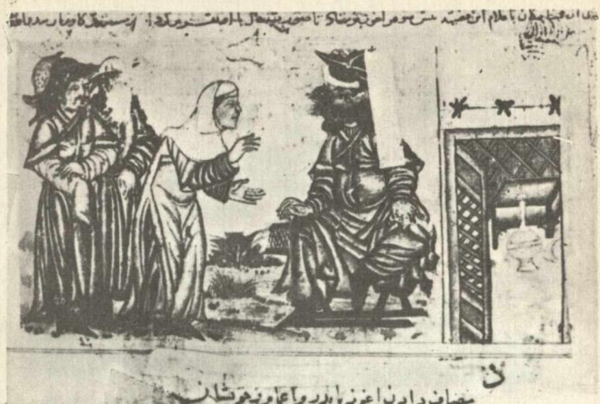
Гара хан вэ Оғузун кәнч арвады

«Оғузнамә» илк дәфә абидәнин бир бојуну алман дилинә чевирмиш алман алими Ф. Дитсин диггәтини чәлб етмишдир 3 . «Оғузнамә»нин мәнзум мәтни үзәриндә узун илләр иш апарылмыш, мүхтәлиф өлкәләрин бир чох тәдгигатчылары она мүрачиәт етмишләр. «Оғузнамә»нин епик дастан кими өјрәнилмәсинин тәмәлини гојмуш В. В. Радлов 4 , В. В. Бартолд 5 , Риза Нур 6 , П. Пел-