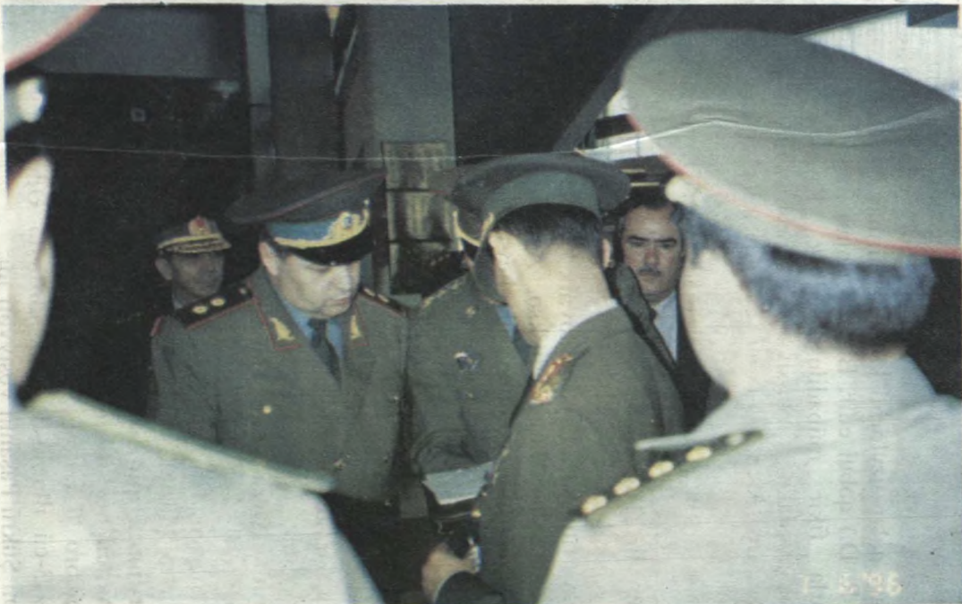
Hərb Akademiyalarında görüş.

1990-cı ildə 20 illik Qafqazın ən yaxşı təlim-tərbiyə mərkəzi olan Hərb Akademiyalarında görüş.