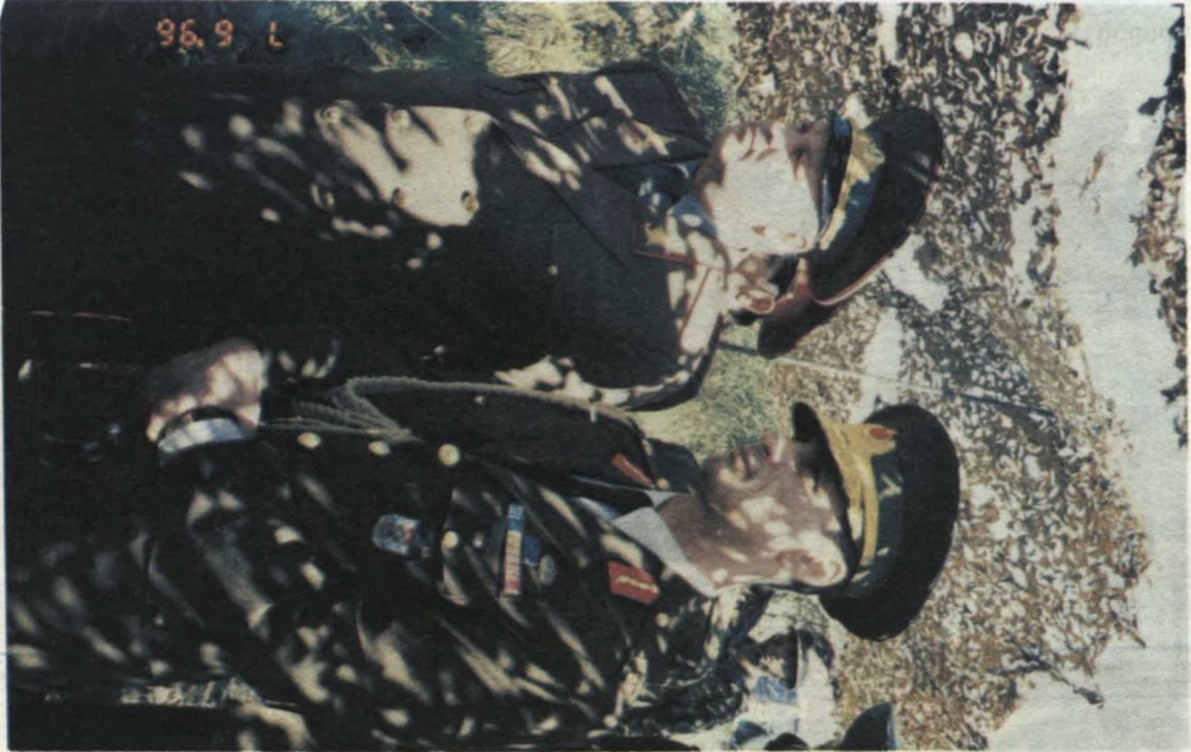
Briqadada görüş .