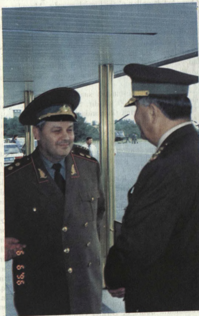
General-leytenant Səfər Əbiyev və korgeneral Edip Başor

Bir azdan sonra Türkiyə Respublikasının Azərbaycan Respublikasındakı hərbi attaşesi Əngin Paşa və xanımı adından nümayəndə hey'ətinə nahar yeməyi verildi.