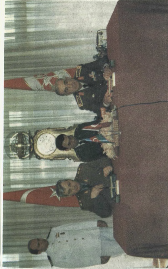
Sazişin imzalanma mərasimi. Soldan birinci: Azərbaycan Respublikasının Müdafiə naziri general-leytenant Səfər Əbiyev; üçüncü: Türkiyə Respublikası Silahlı Qüvvələrinin Baş Qərargah rəisi orgeneral İsmayıl Haqqı Qarayayı

Siz Azərbaycan xalqının və Azərbaycan Silahlı Qüvvələrinin Türkiyədəki nümayəndələrisiniz. Siz xalqımızın tarixi keçmişini, mədəniyyətini və adət-ən'ənələrini burada təmsil edirsiniz. Möhtərəm Prezidentimiz Heydər Əliyev çox gözəl deyir ki, biz bir xalq, iki dövlətlik. Bu, böyük həqiqətdir. Siz Türkiyə dövlətində təhsil alırsınız.