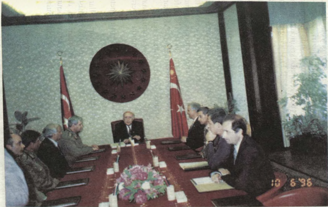
7 Türkiyə Respublikasının prezidenti Süleyman Dəmirəl Azərbaycan Respublikasının Müdafiə naziri general-leytenant Səfər Əbiyevi və nümayəndə hey'ətini qəbul edir.