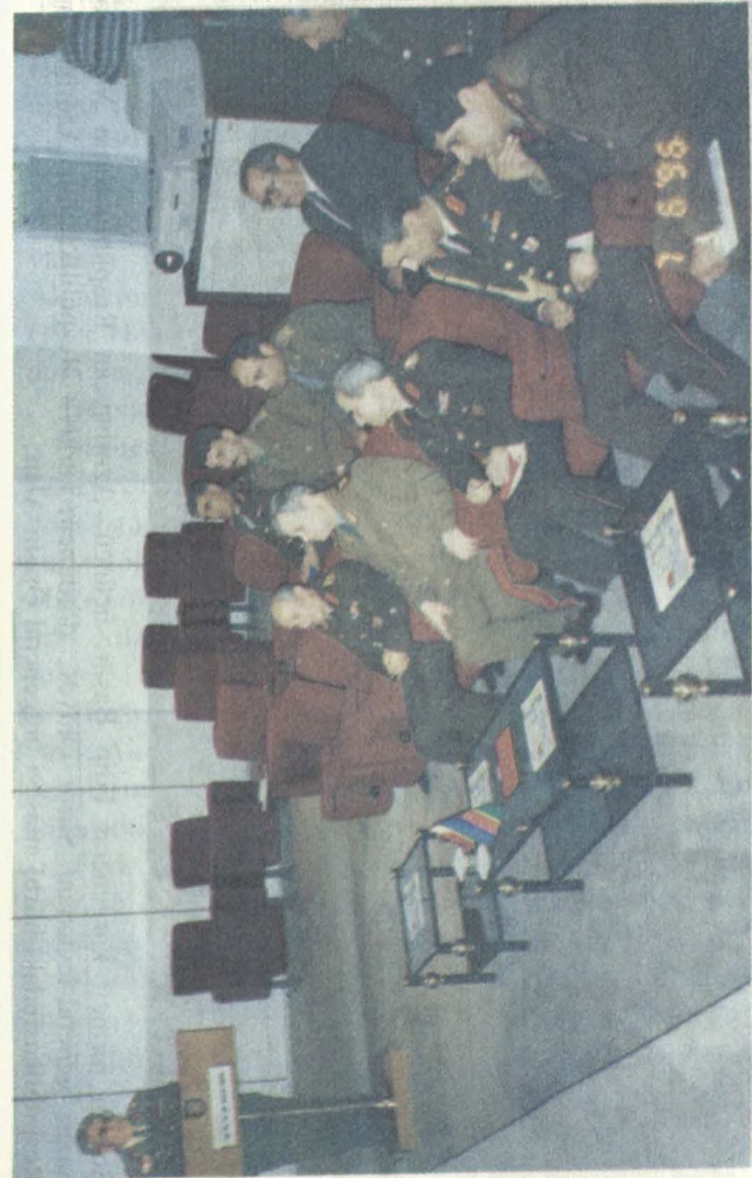
Hərb Akademiyalarında brifinq.

Tarixi arayış: Türkiyə Respublikası Silahlı Qüvvələri zabit kadrlarının təməl qaynağı hərbi məktəblərdir. Hər bir qoşun növü üçün bir hərbi məktəb mövcuddur.