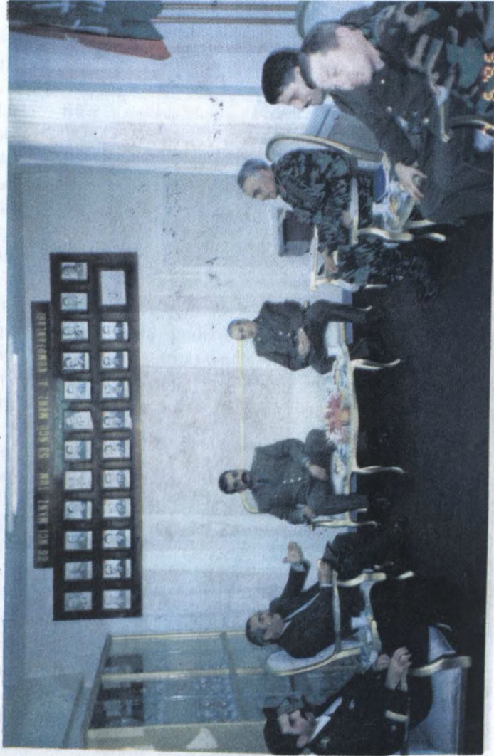
Nümayəndə hey'ətinin üzvləri görüş zamanı .