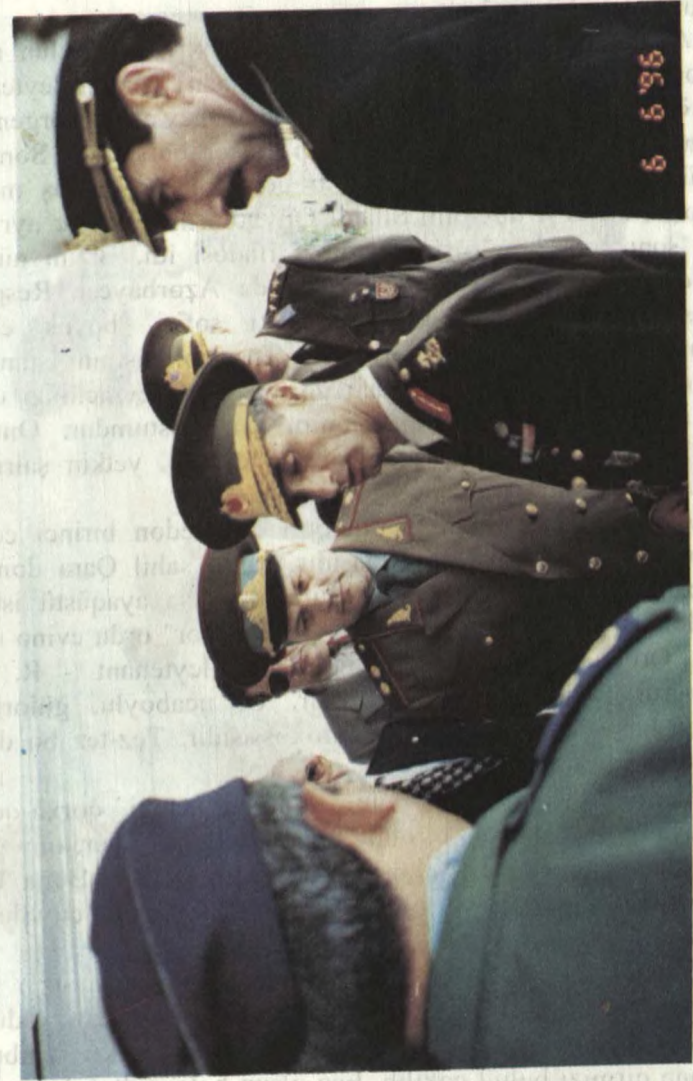
İstanbul. Atatürk hava limanında qarşılama mərasimi