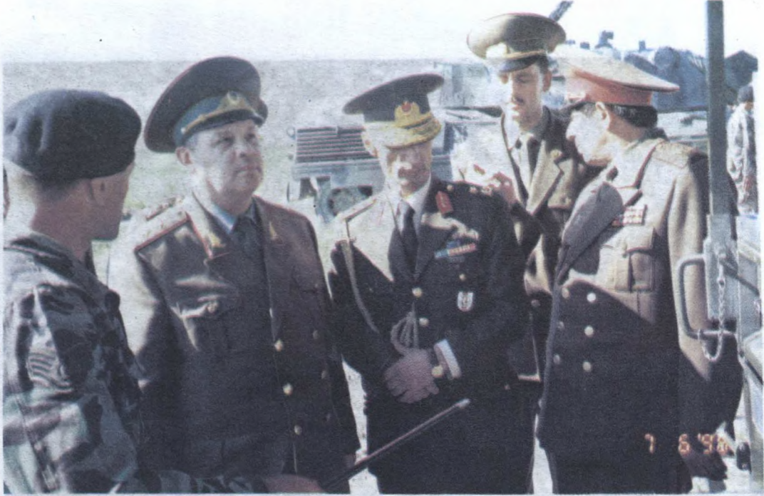
Briqada komandanlığı ilə görüş. Soldan ikinci: general-leytenant Səfər Əbiyev, üçüncü: tuğgeneral Əngin Alan, beşinci: general-mayor Məmməd Səriyev.