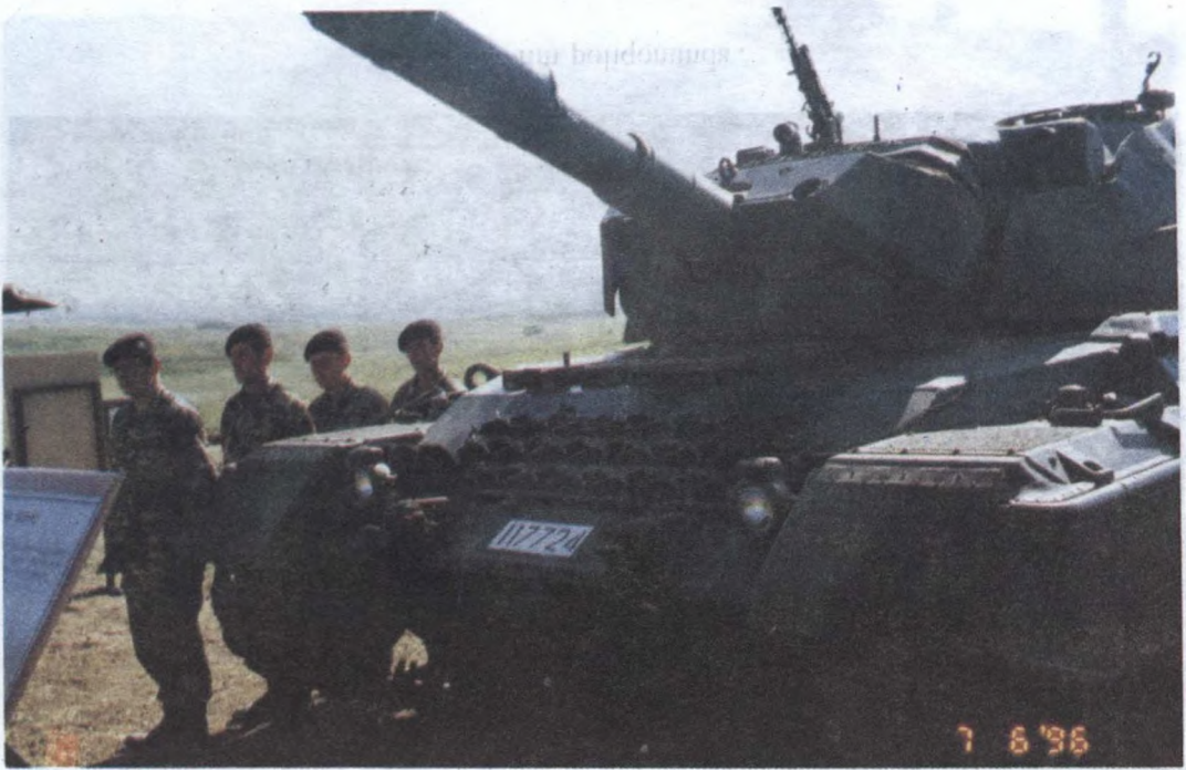
Ҳарби техника сарғиси.