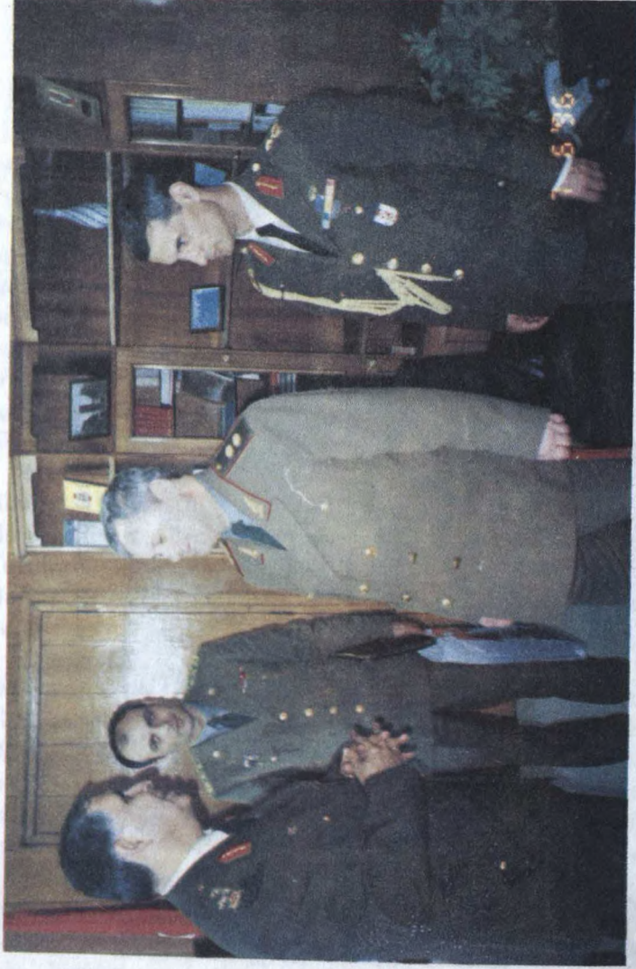
Soldan birinci: korgeneral Edip Başar, üçüncü: Azərbaycan Respublikasının Müdafiə naziri general-leytenant Səfər Əbiyev, dördüncü: Türkiyə Respublikasının Azərbaycan Respublikasındakı hərbi attaşesi tuğgeneral Əngin Alan.

Türkiyə Silahlı Qüvvələrinin ən yüksək təlim-tərbiyə qaynağı isə Hərb Akademiyalarıdır.