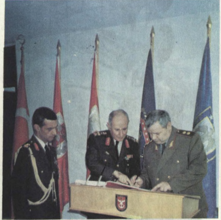
Əsgərlik Komandanlığı ilə görüş.