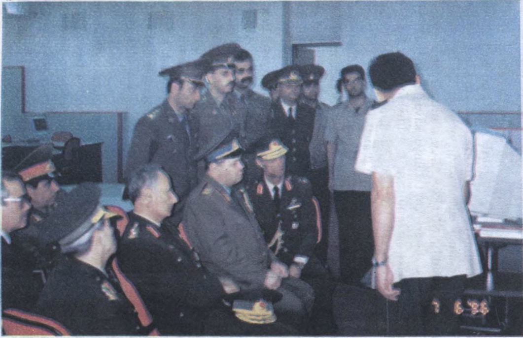
Hərb Akademiyalarında görüş.

1990-cı ildə 20 illik Qafqazın ən yaxşı təlim-tərbiyə mərkəzi olan Hərb Akademiyalarında görüş.