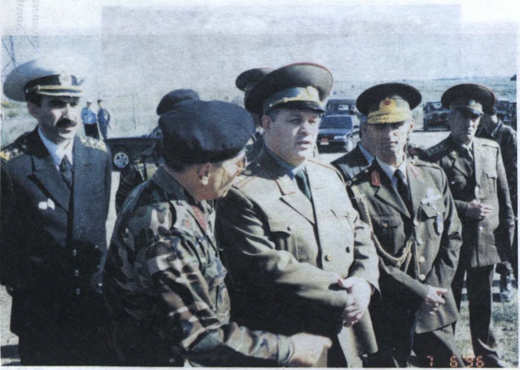
Briqada komandanlığı ilə görüş .