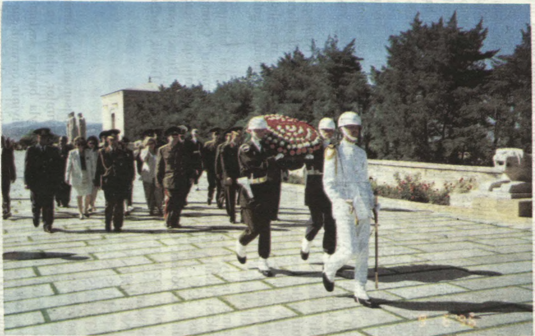
Mustafə Kamal Atatürkün ziyarətgahı. Anıt qəbrinə gedən yol.