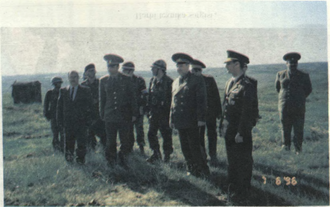
Tə'lim poliqonunda .