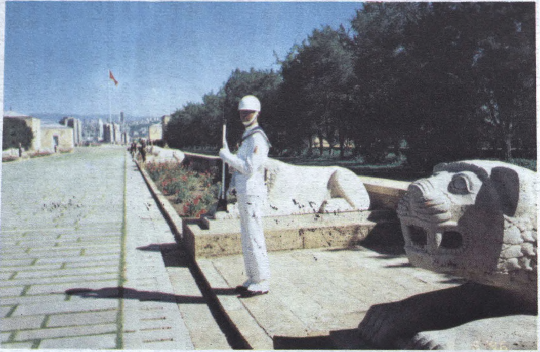
Anıt qəbri. Əli avtomatlı türk əsgəri sanki daşlaşıb...