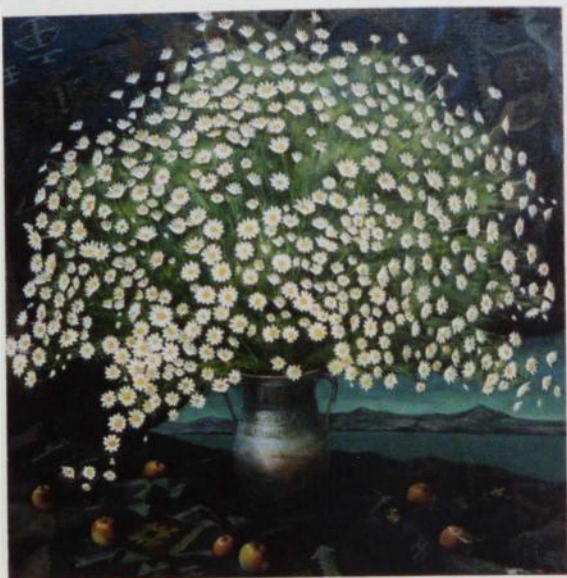
Çöl çiçəkləri - Göyçə gölü. Kətan y.boya, 93x85, 2003