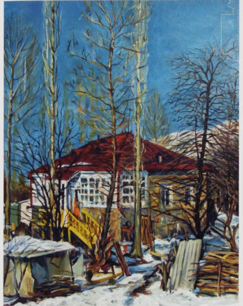
Evimiz. Kətan boya, 120x90, 1984