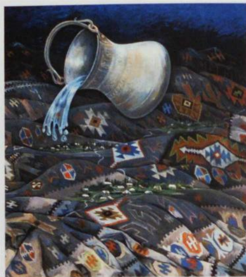
Zülmətdən doğan işıq. Kətan y.boyu, 120x120, 2018