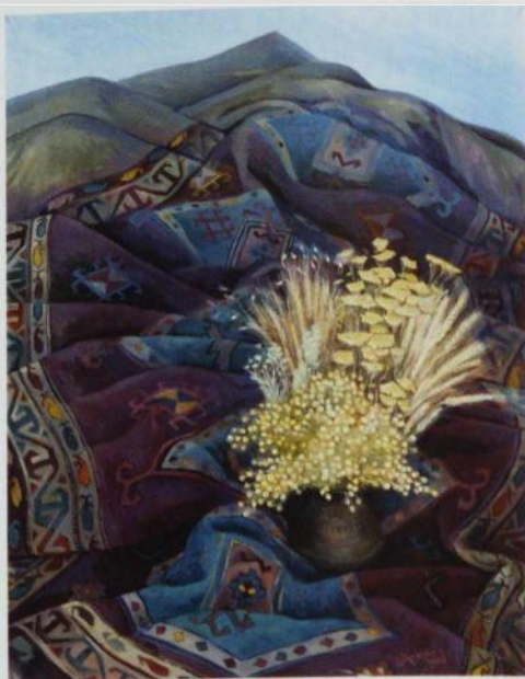
Göyçə. Kətan boyu, 112x86, 2017