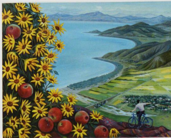
Qərbi Azərbaycan. Vətən nəğməsi, kətan y.boyu, 150x120, 2018