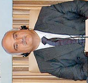
Əli Həsən Bin Talat