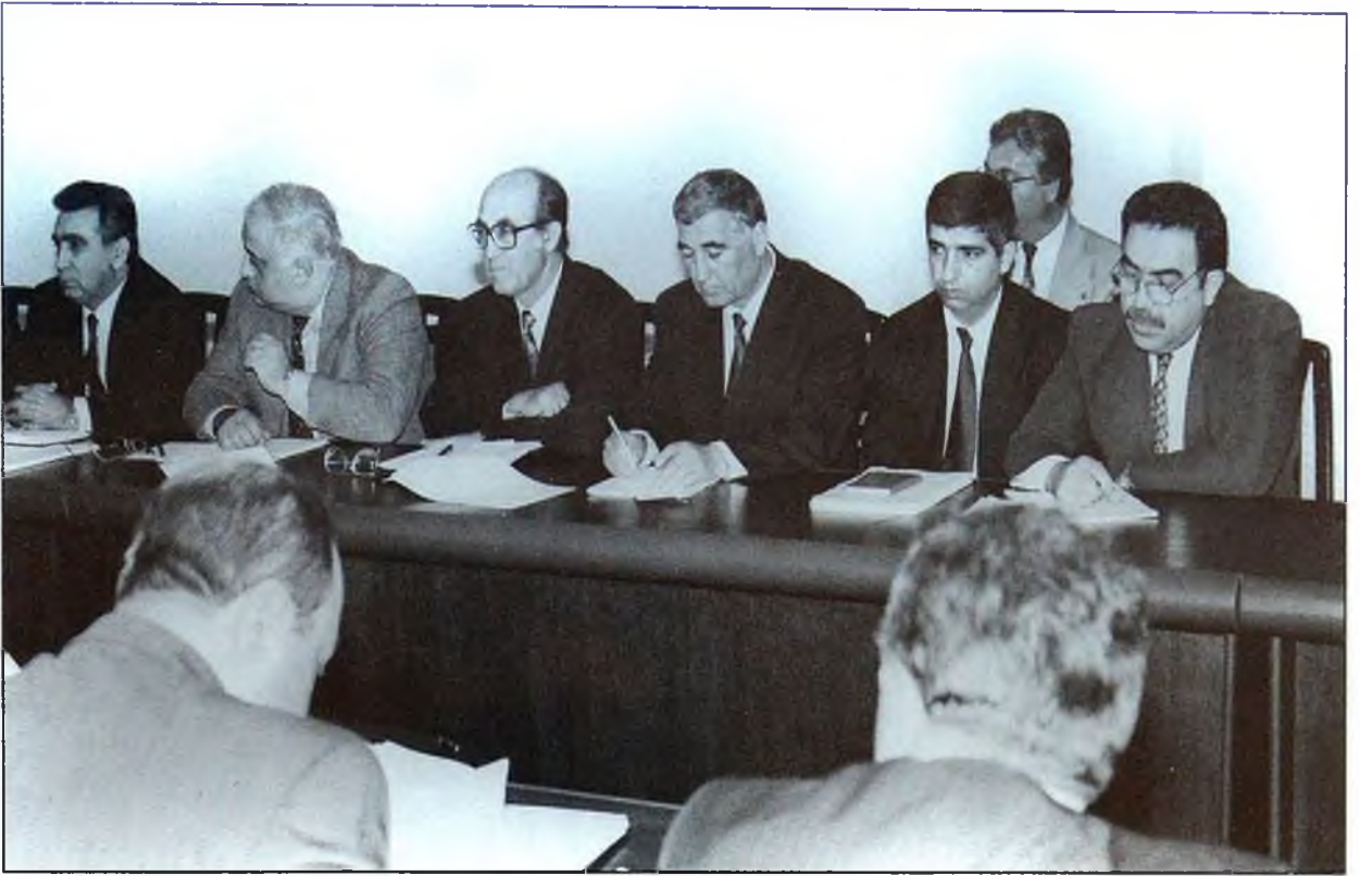
Komissiyanın iclası. 2 noyabr 1995-ci il