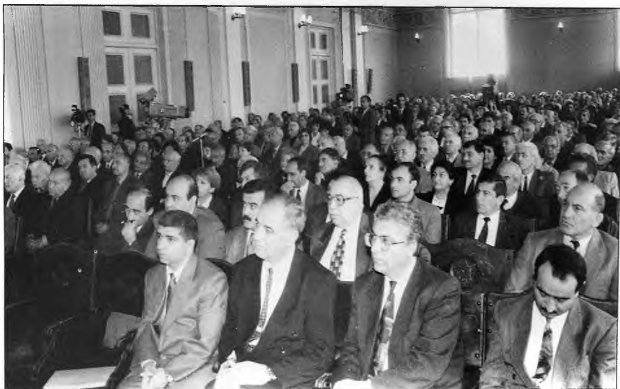
31 oktyabr 1995-ci il. AMEA-da keçirilən iclasda