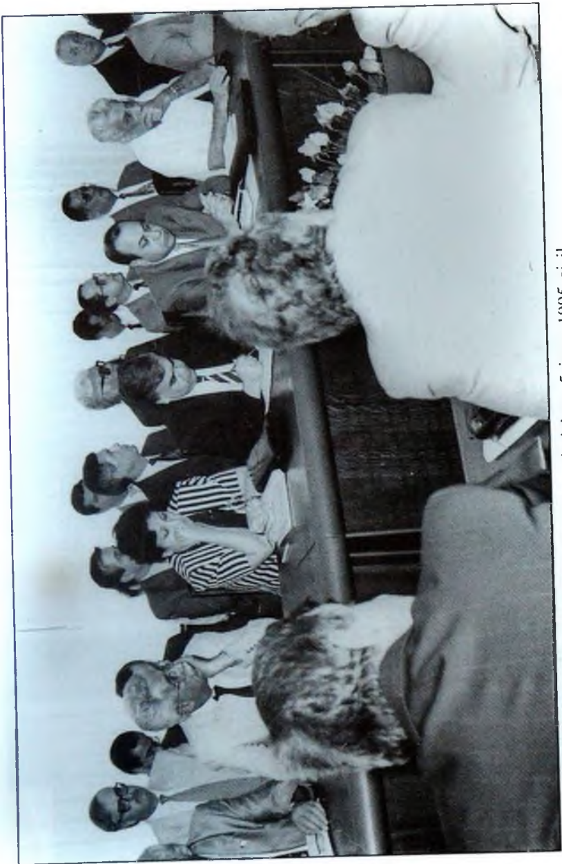
Komissiyanın geniş iclası. 5 iyun 1995-ci il

gördüm, Milli Məclisə müraciət etdim və həmin müddəalar oradan çıxarıldı.