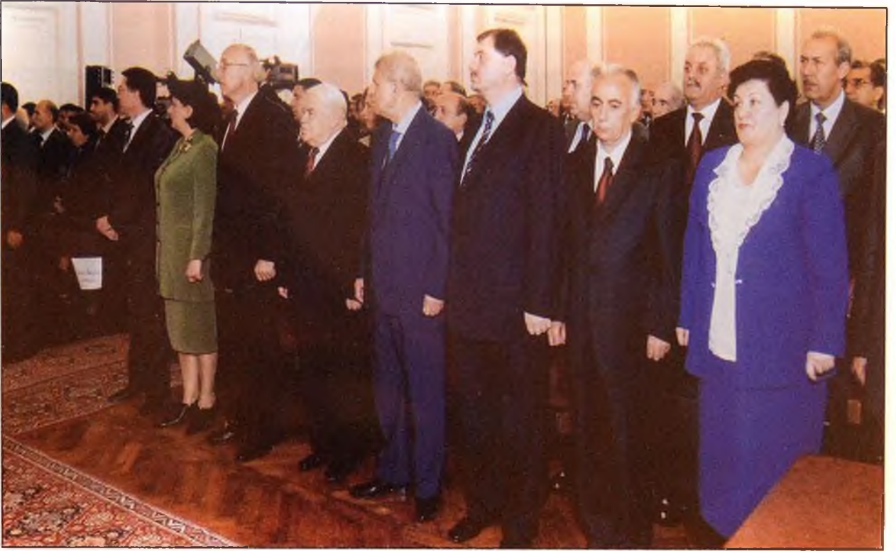
Azərbaycan Respublikası Prezidenti seçkilərinin yekunları haqqında məlumat Azərbaycan Respublikasının Konstitusiya Məhkəməsində rəsmən elan edilərkən. 28 oktyabr 2003-cü il