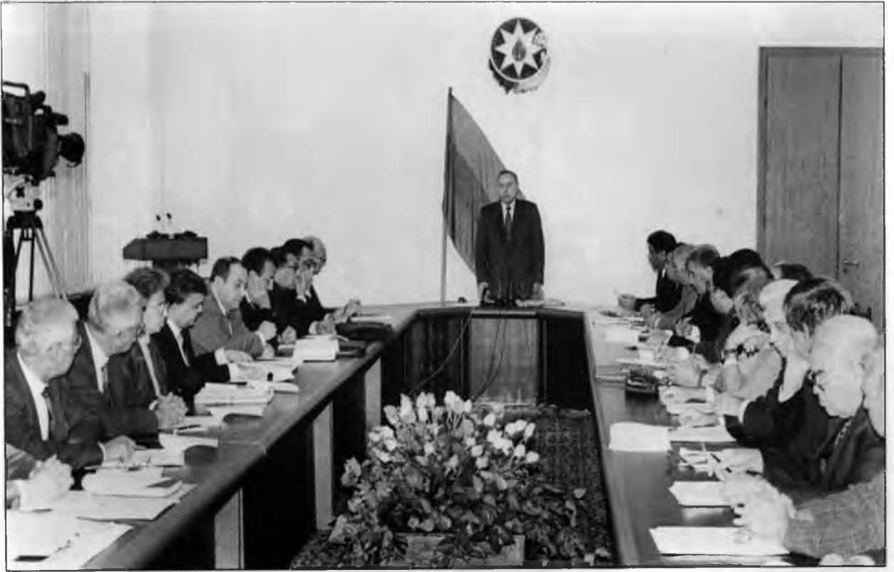
Komissiyannın iclası. 12 oktyabr 1995-ci il