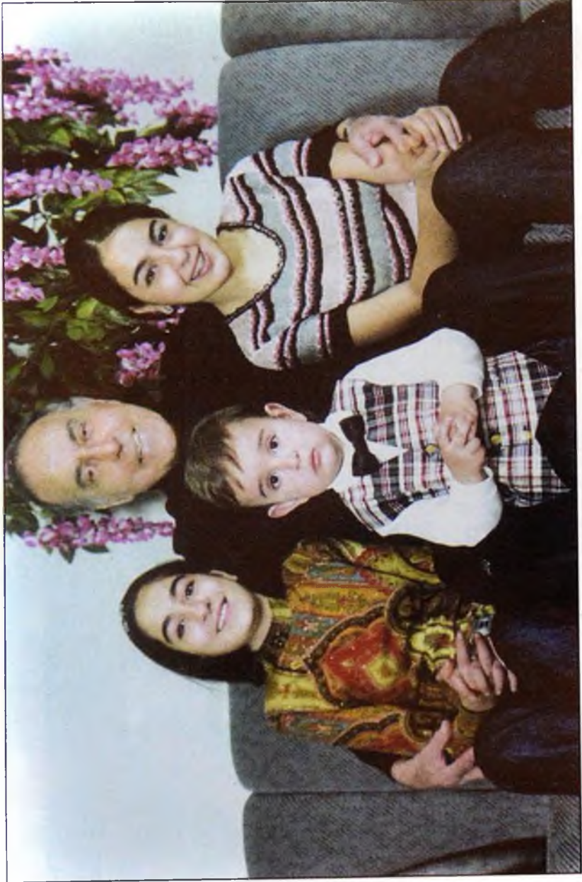
Azərbaycan Respublikasının Prezidenti Heydər Əliyev nəvələri ilə