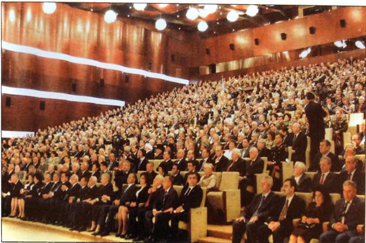
Andiçmə mərasimində. 24 oktyabr 2008-ci il