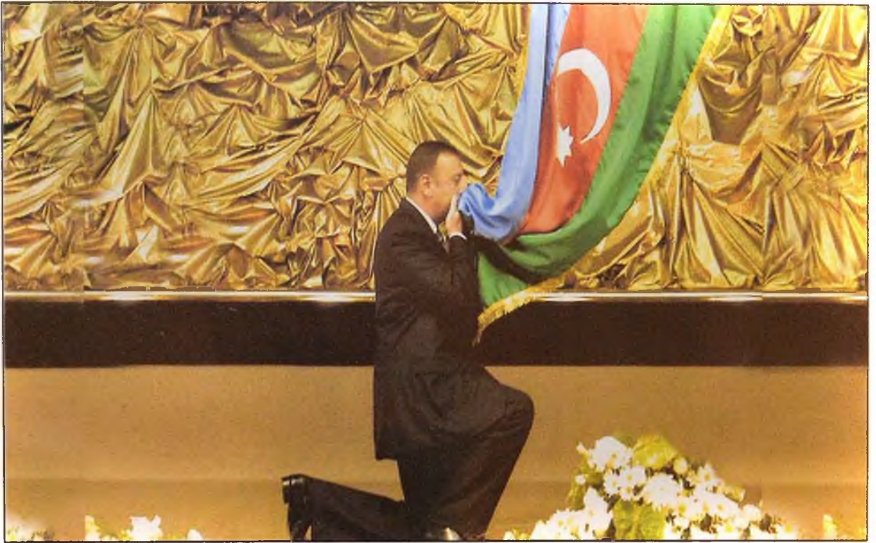
Azərbaycan Respublikasının Prezidenti İlham Əliyev təntənəli andiçmə mərasimində. 31 oktyabr 2003-cü il