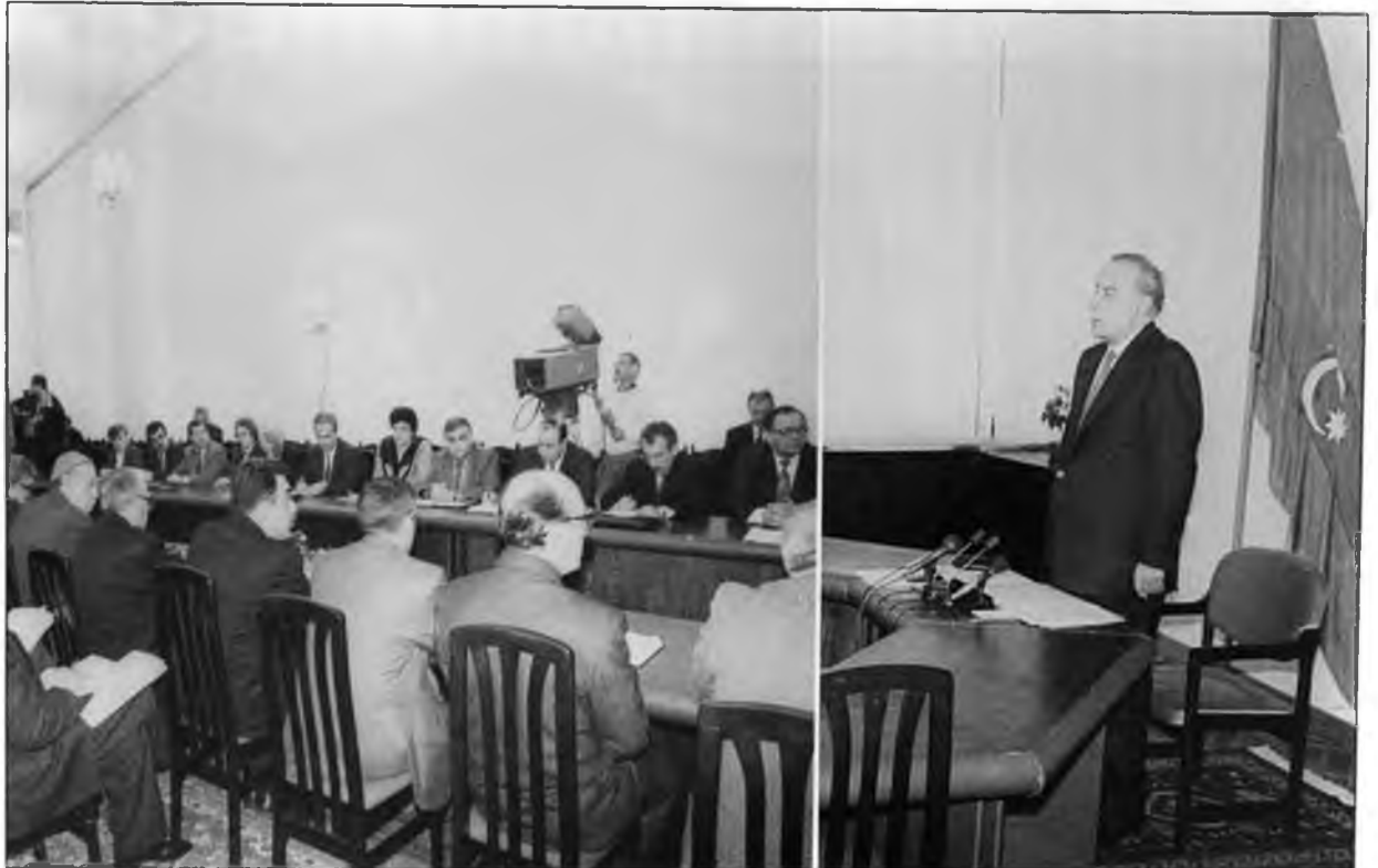
Komissiyannın iclası. 14 oktyabr 1995-ci il