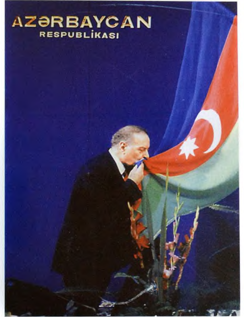
1993-cü ilin oktyabr ayı. Azərbaycan Prezidenti seçilən Heydər Əliyev müqəddəs bayrağımızı öpərək and içir.

1993-cü il oktyabrın 3-də mən prezident seçiləndən sonra, prezident kimi Konstitusiyaya əsaslanaraq and içməli idim. O vaxt məlum oldu ki, bizim Konstitusiyada müəyyən dəyişikliklər edilib, amma Konstitusiyanın bir çox müddəaları Azərbaycanın keçmiş Sovetlər İttifaqı tərkibində olduğunu göstərən müddəalardır. Çox təəccüblüdür ki, həmin müddəalar çıxarılmamışdı. Şübhəsiz ki, mən bunu bilən kimi lazımi tədbir