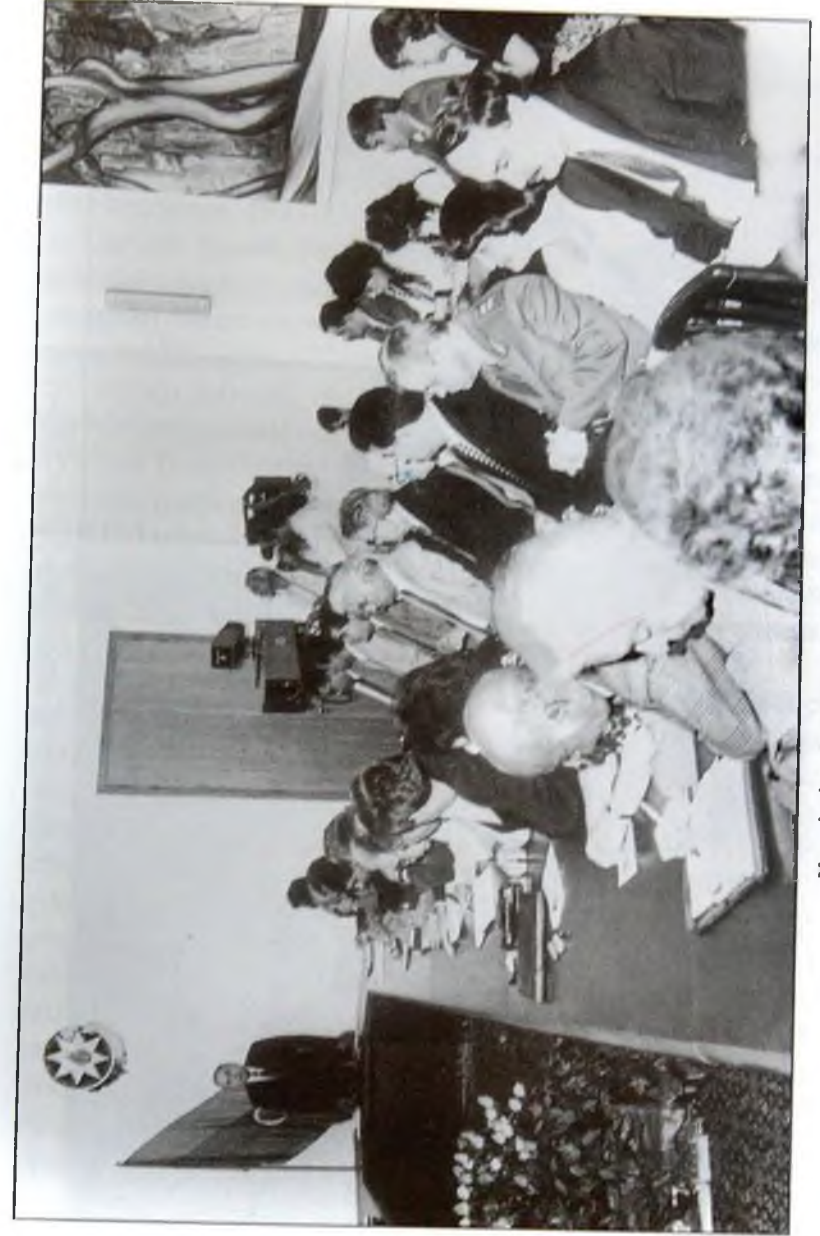
Komissiyanın geniş iclası, 5 iyun 1995-ci il