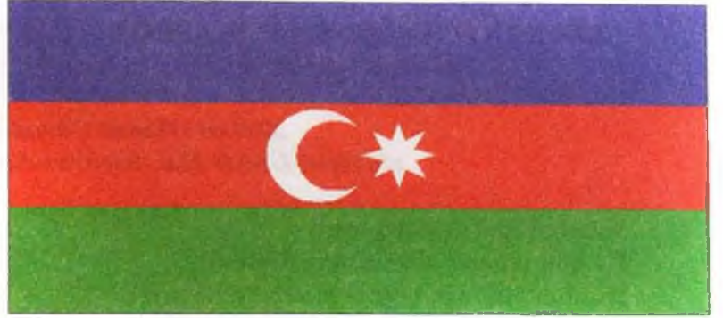
Azərbaycan Respublikasının Dövlət bayrağı