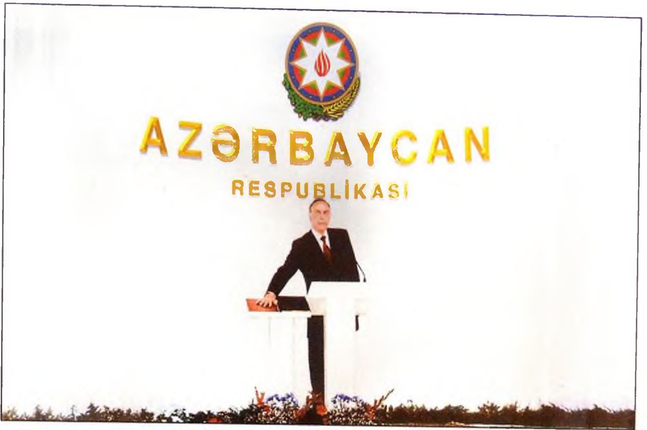
Azərbaycan prezidenti Heydər Əliyevin andiçmə mərasimi. 1998-ci il