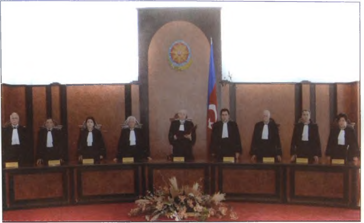
Azərbaycan Respublikasının Konstitusiya Məhkəməsi Prezident seçkilərinin yekunları haqqında məlumatı rəsmən elan edərkən. 22 oktyabr 2008-ci il