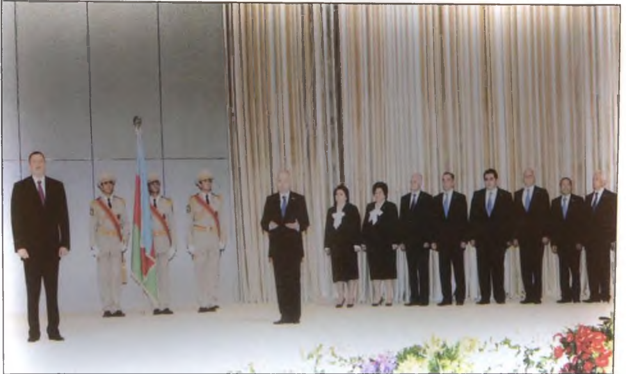
Azərbaycan Respublikasının Prezidenti İlham Əliyev təntənəli andiçmə mərasimində.