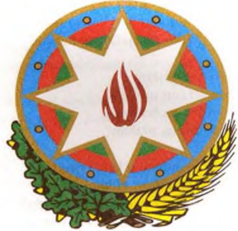
Azərbaycan Respublikasının Dövlət gerbi