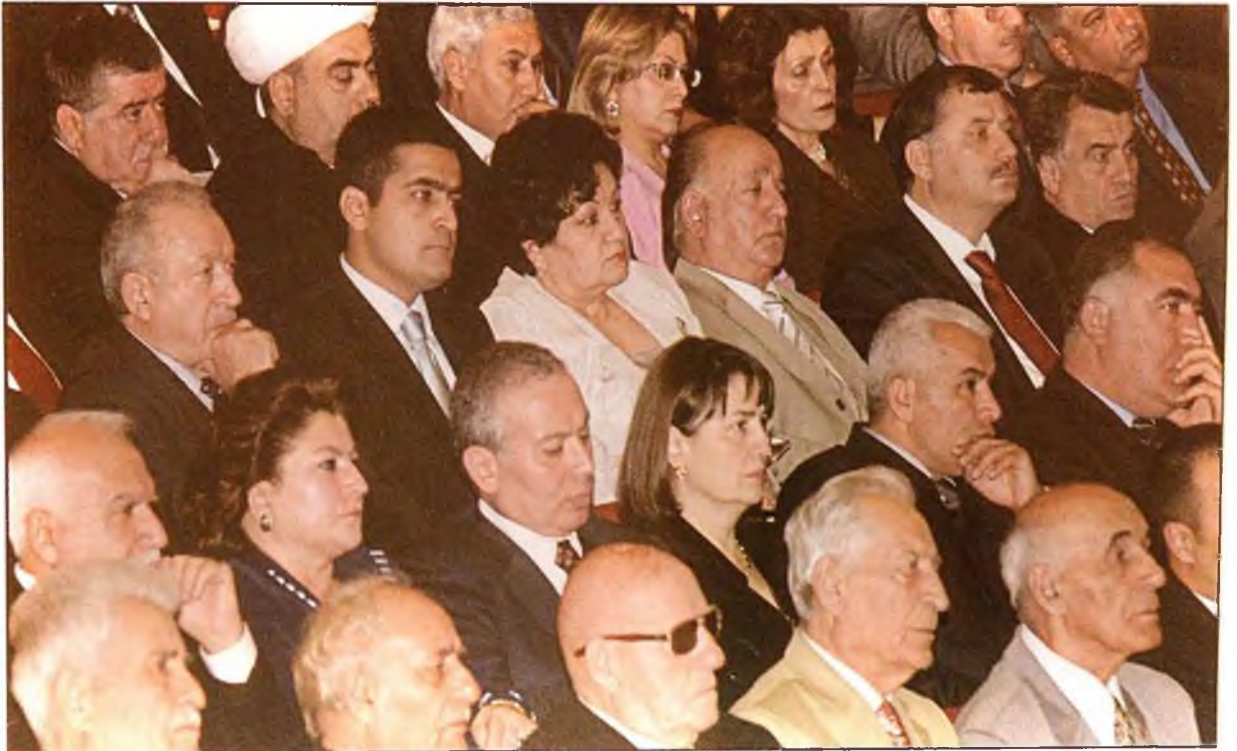
Azərbaycan Respublikasının Prezidenti İlham Əliyev təntənəli andiçmə mərasimində. 31 oktyabr 2003-cü il