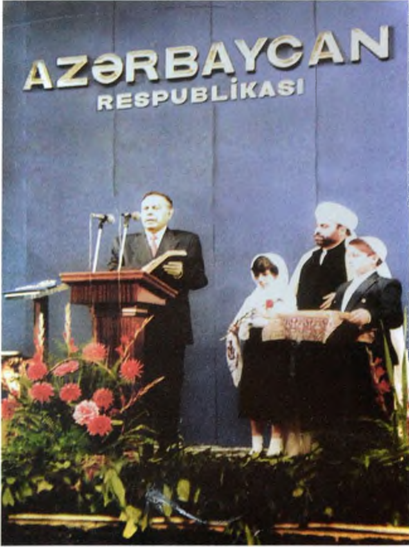
Azərbaycan Respublikasının Prezidenti Heydər Əliyev andiçmə mərasimində, 10 oktyabr 1993-cü il