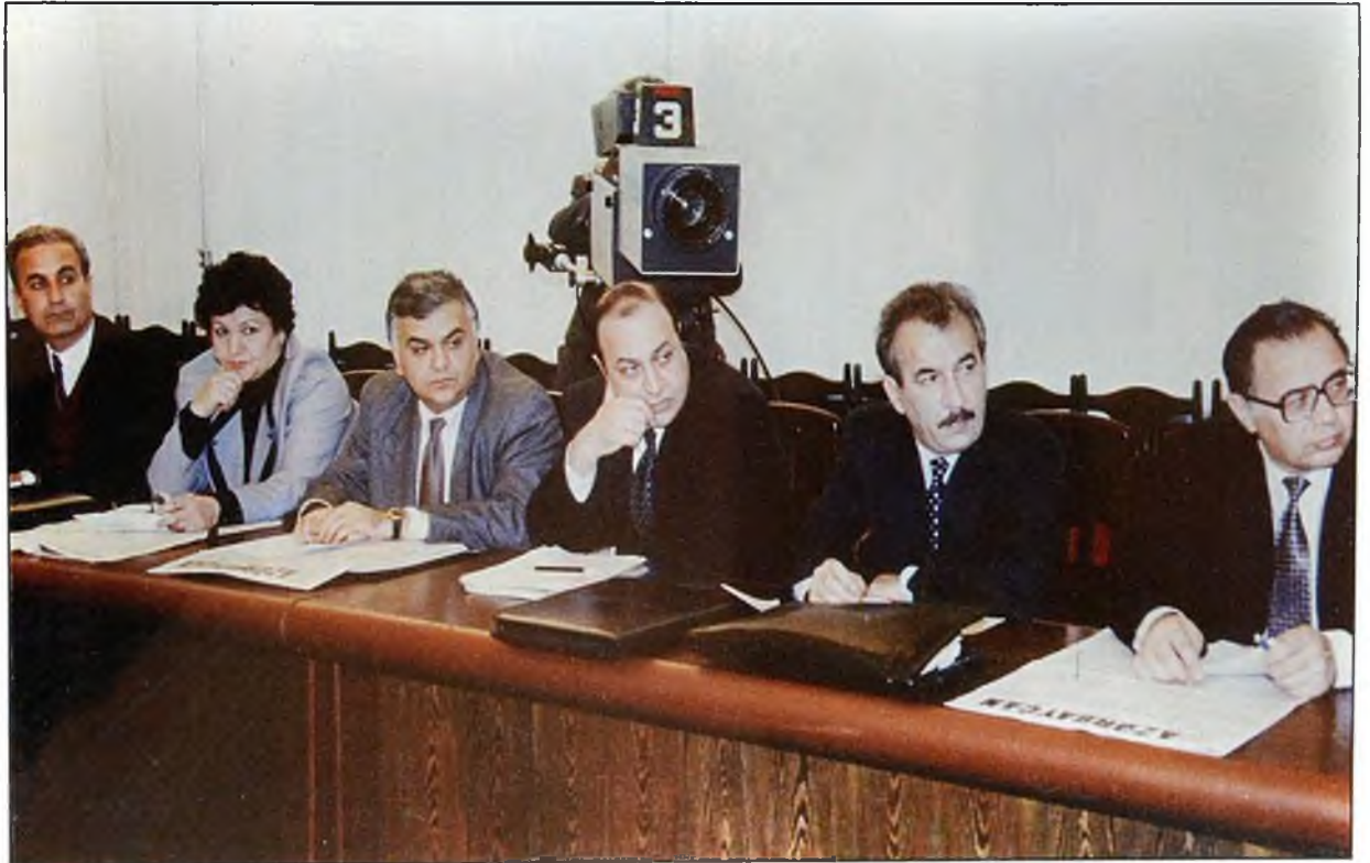
Komissiyanın iclası. 2 noyabr 1995-ci il