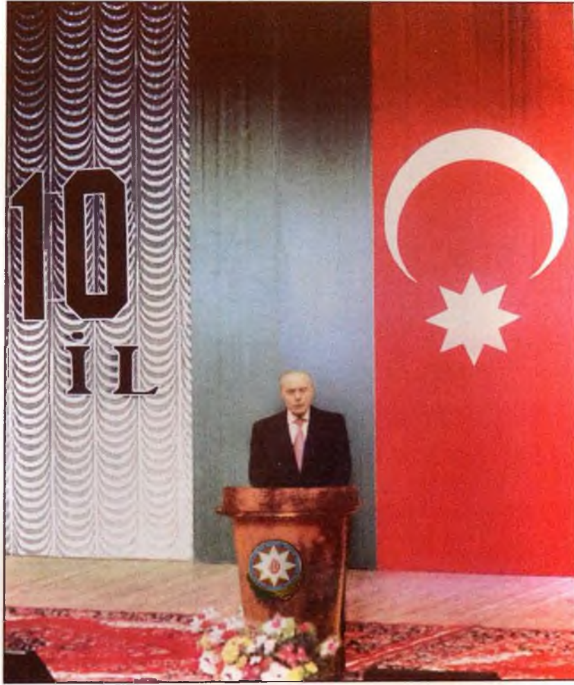
Azərbaycanın dövlət müstəqilliyinin 10 illik yubileyinə həsr olunmuş təntənəli iclasda. 12 oktyabr 2001-ci il.

mək üçün bir çox materiallar da hazırlanıb və bir çox fikirlər formalaşıbdırsa hesab edirəm ki, konstitusiyamızda bəzi müddəaları mütləq əks etdirməliyik. Mən sizdə olan layihə əsasında danışiram. Məsələn, bu layihənin giriş hissəsini bir az da genişləndirmək lazımdır. Giriş hissəsində milli dövlətçilik ənənələrimiz, Azərbaycanın dövlət müstəqilliyi ilə əlaqədar fikirlər əks olunmalıdır. Giriş hissəsi Azərbaycan Dövlət Müstəqilliyi haqqında Konstitusiya Aktı ilə əlaqələndirilməlidir.