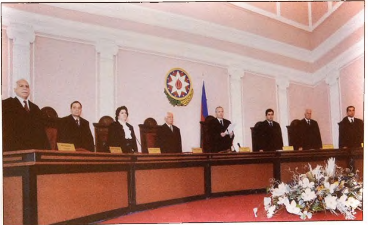
Azərbaycan Respublikası Prezidenti seçkilərinin yekunları haqqında məlumatın Konstitusiya Məhkəməsində rəsmən elan olunması . 28 oktyabr 2003-cü il