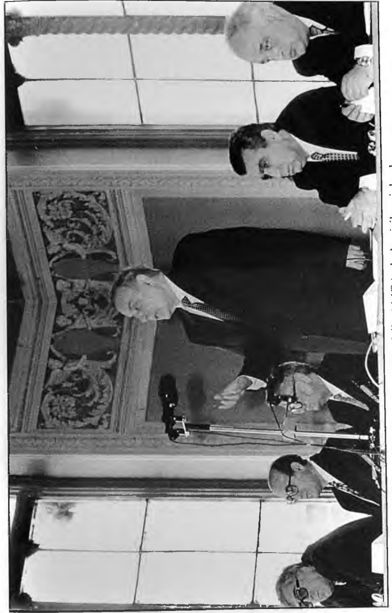
31 oktyabr 1995-ci il. AMEA-da keçirilən iclasda

Sizə paylanan bu layihəni əsas götürmək olar. Ancaq onun üzərində işləmək lazımdır. Layihənin üzərində işlə-