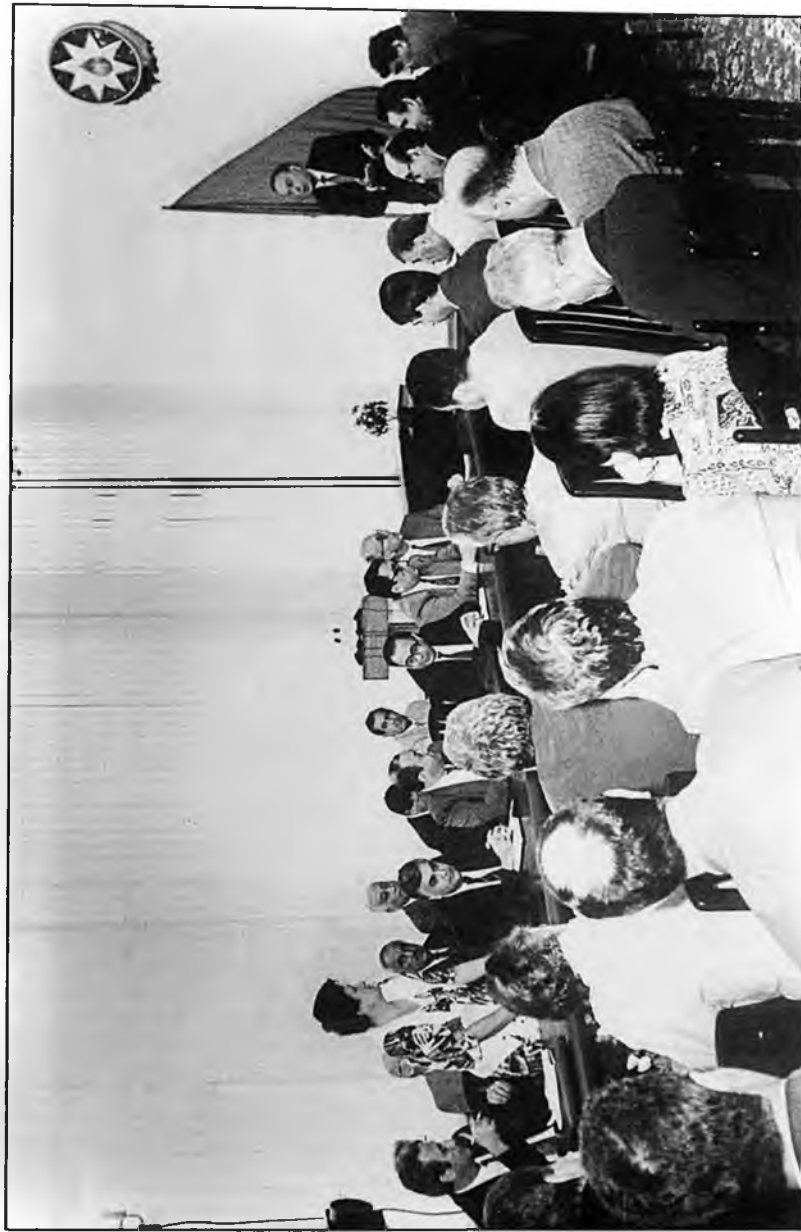
Komissiyanın iclası. 26 avqust 1995-ci il

1992-ci ildə hakimiyyət bir dəfə dəyişilib. Ondan üç ay sonra yenidən hakimiyyətin dəyişilməsinə cəhd olubdur, hakimiyyət dəyişibdir, yeni qüvvələr, Xalq Cəbhəsi hakimiyyətə gəlibdir. Bir il hakimiyyəti saxlaya biliblər. 1993-cü ilin iyun ayında hakimiyyəti devirmək istəyən qüvvələr onu deviriblər. Bunu açıq demək lazımdır. Amma iş bu hakimiyyətin devrilməsində deyildi. Azərbaycan artıq o vaxt parçalanmışdı, dağılmışdı və vətəndaş müharibəsi başlamışdı. Onda həmin qüvvələr məhv oldular, çəkildilər, qaçdılar. Biri istefa verib qaçdı, indiyə qədər heç bilmirik haradadır. Biri qaçdı, kənddə yaşayır. O biriləri istefa verib çıxıb getdilər, indi dönüb təzədən, müxalifət olublar, yenidən hakimiyyətə gəlmək istəyirlər. Yaxşı hakimiyyətə gəlmişdiniz, əgər bacarırdınızsa əlinizdə saxlayardınız, Kim sizə mane olurdu? Əgər bacarmadınsa, onda çəkilin, durun kənardadır, bir il, iki il, üç il təcrübə toplayın. Ondan sonra bəl-