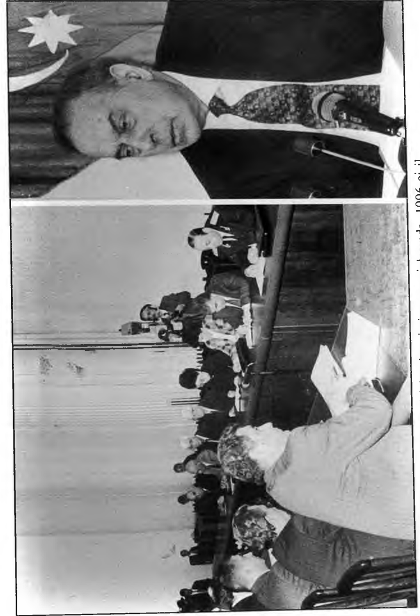
Hüquq islahat komissiyasının iclasında. 1996-cı il