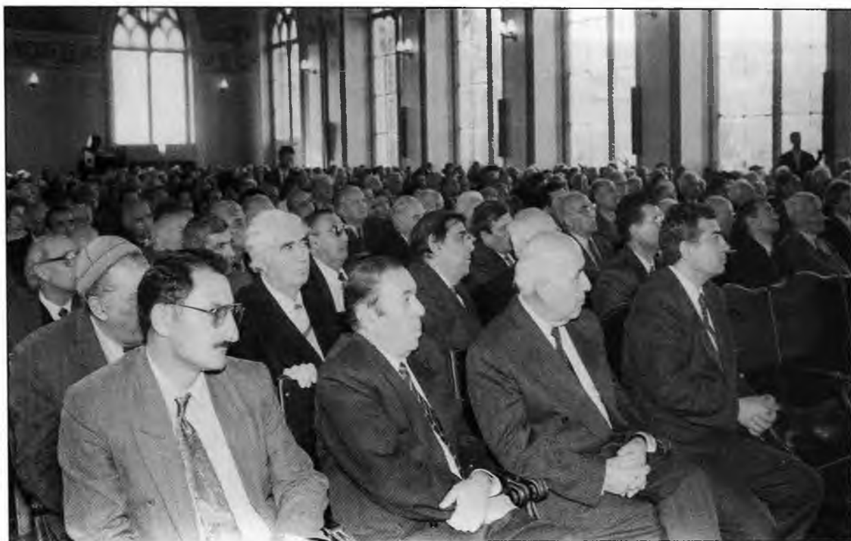
31 oktyabr 1995-ci il. AMEA-da keçirilən iclasda