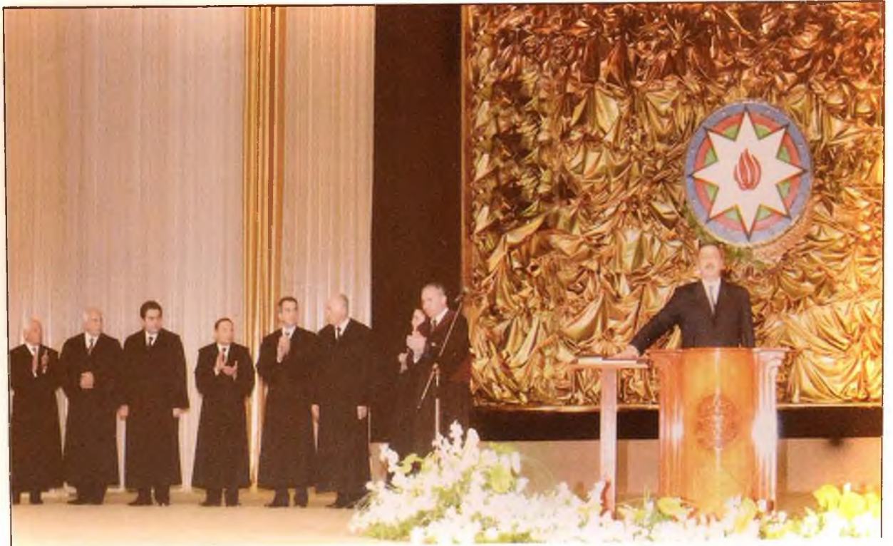
Azərbaycan Respublikasının Prezidenti İlham Əliyev təntənəli andiçmə mərasimində. 31 oktyabr 2003-cü il