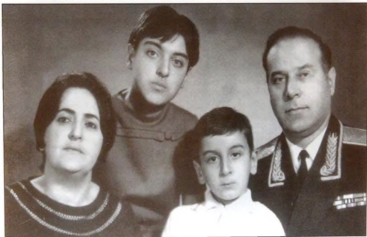
Heydər Əliyev ailə üzvləri ilə