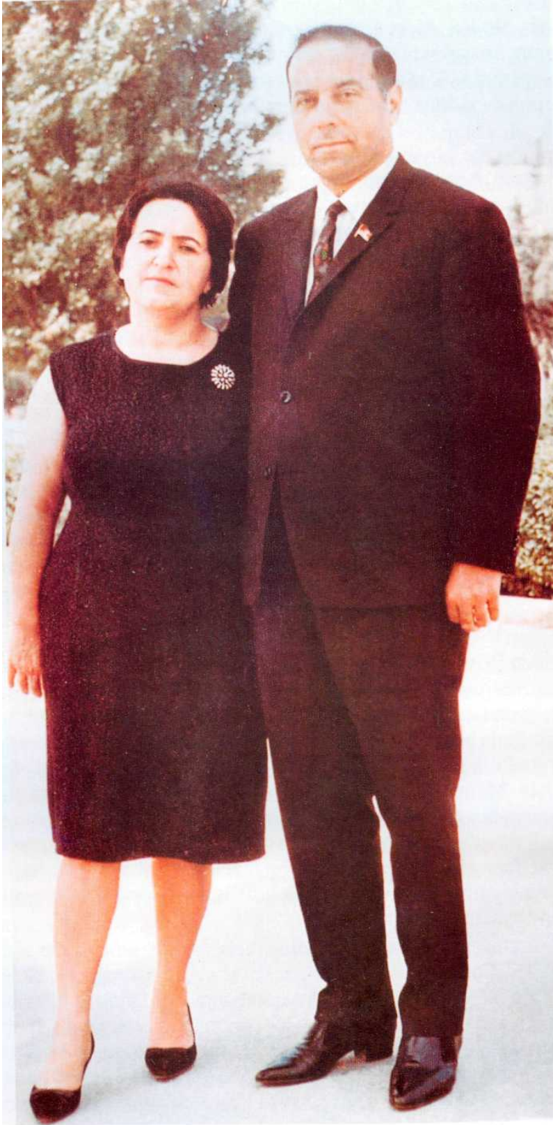
Qoşa gedirdilər şərəfli yolu Böyük ürəkləri sevgiyə dolu