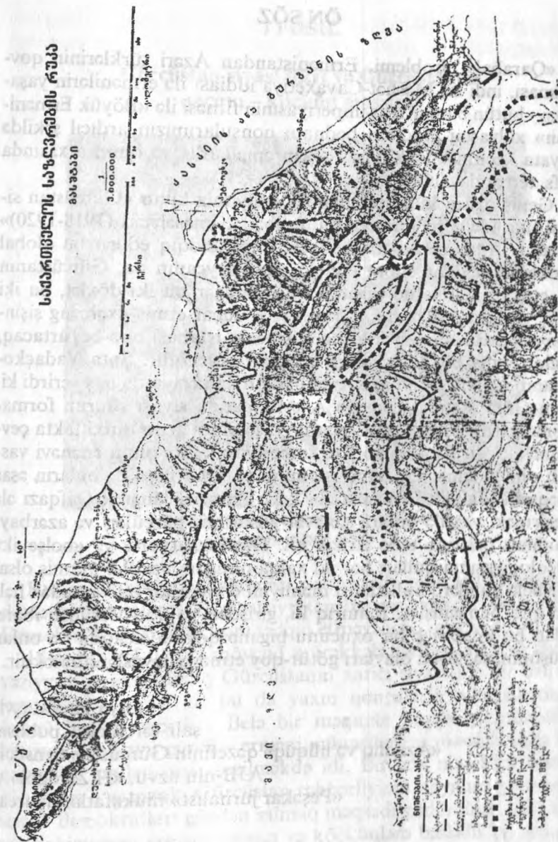
Gürcüstan sərhədlərinin xəritəsi 1918-ci il