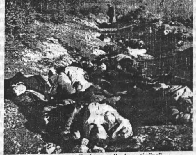
«Arxiv sənədləri ermənilərin antigürcü ovqatını sübut edir»

Rus imperiyasının dağılması nəticəsində müstəqil Gürcüstan dövlətini formalaşdıran xüsusiyyətlər bir çox tarixini Gürcüstan Demokratik Respublikasını tədqiq etməyə istiqamətləndirirdi.