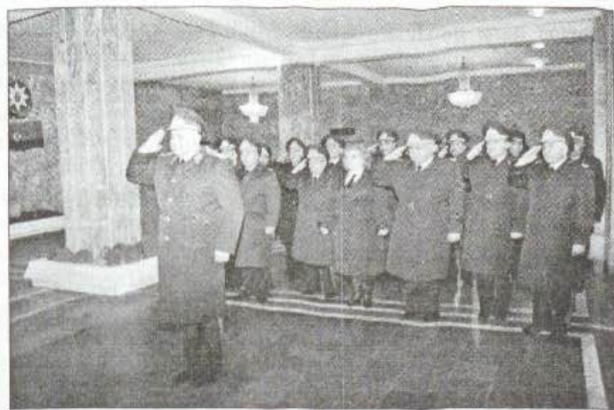
Milli Təhlükəsizlik naziri, general leytenant Eldar Mahmudov başda olmaqla şəxsi heyət peşə bayramı günü anım mərasimində 28.03.2007-ci il