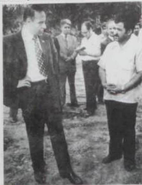
Heydər Əliyev Yevlax rayonu Qarxun kəndinin pambıq tarlasında, may 1972-ci il