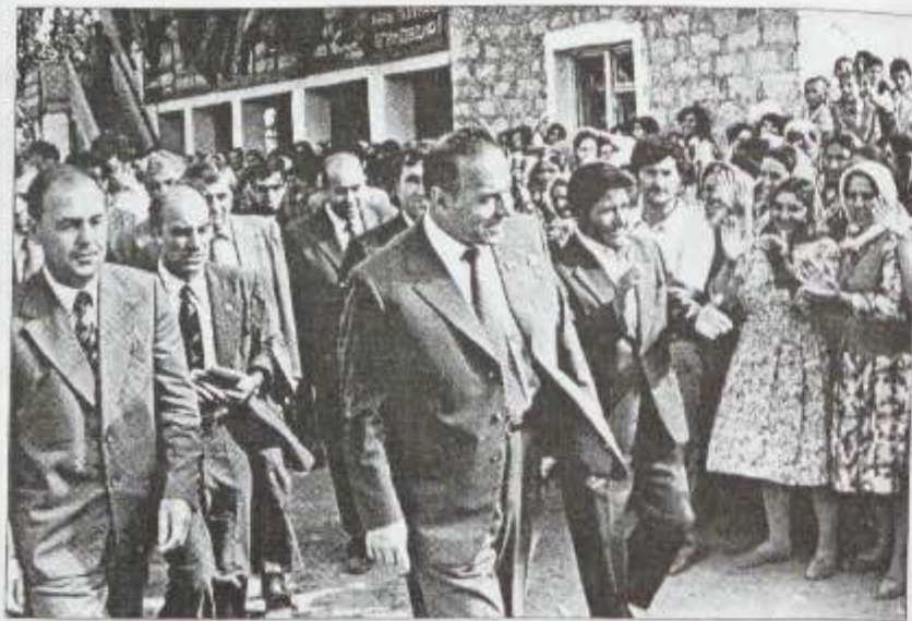
Respublika rəhbəri Heydər Əliyev və Beyləqan RPK-nin 1-ci katibi rayonun pambıqçılıq təsərrüfatlarında. 1979-1982-ci illər.