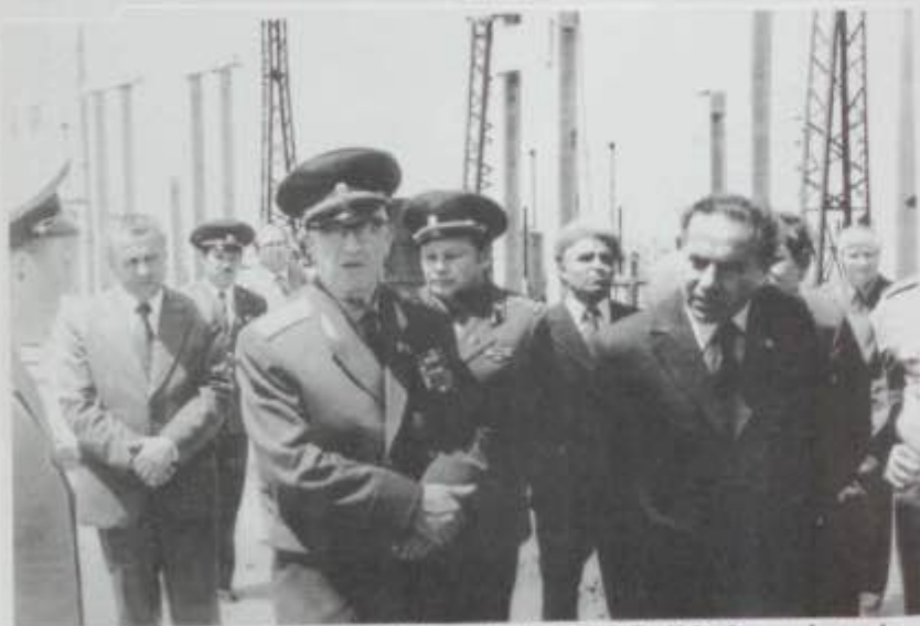
13 may 1978-ci il, Heydər Əliyev Qəbələ RLS tikinti meydanında marşallar Koldunov, Gelevani, RPK-nın 1-ci katibi Bullayev və başqa hərbiçilərlə söhbət edir