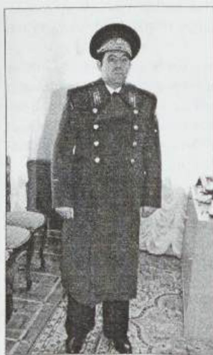
Yeniçə Daxili İşlər naziri təyin olunmuş general-mayor M.Əsədov