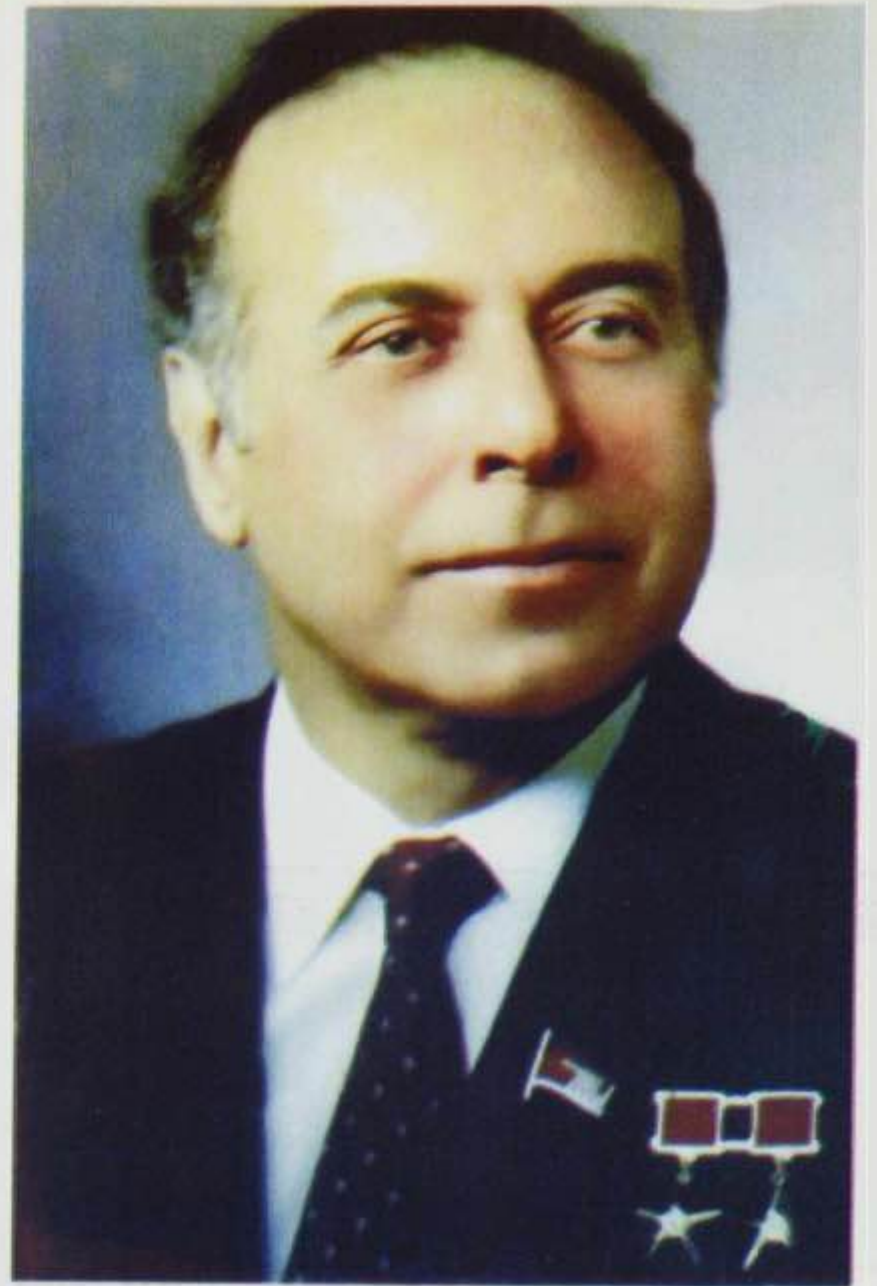
Ulu Öndər Heydər Əliyev

1993-cü ildə 2-ci dəfə Azərbaycan Respublikası rəhbərliyinə gələn Heydər Əliyev cənabları 1918-20-ci illərdə AXC-ni hakimiyyətdə olduğu illərdə Hökumət tərkibinə daxil olan bütün hüquq-mühafizə və başqa nazirliklərinin həmin dövrlərdə yarandığı günləri müvafiq sərəncamları ilə yeni yaradılmış eyniadlı nazirlik işçilərinin peşə bayramı kimi elan etdi. Respublika MTO əməkdaşlarının peşə bayramı isə 1918-19-cu illərdə AXC-nin müdafiə naziri işləmiş artilleriya general-leytenantı Səməd bəy Mehmandarovun 28 mart 1919-cu il tarixli, 157 sayılı əmri ilə Baş qərargah nəzdində kəşfiyyat və əkskəşfiyyat bölməsinin yaradılmasından qaynaqlandı. Beləliklə həmin əmrə əsaslanan dövlət başçısı bu tarixi sənədə istinadən, 20 mart 1997-ci il tarixli sərəncamı ilə, həmin günü MTN işçilərinin peşə bayramı günü kimi təsis etdi. Bu sərəncam mətbuatda dərc olunandan bir neçə gün sonra hamımıza 28 martda yeni təsis olunmuş peşə bayramının 78-ci ildönümünə həsr olunmuş təntənəli iclasa gəlməyimiz barədə xəbərdarlıq edilmişdi. Bu mərasimdə prezident Heydər Əliyevin iştirakı barə-