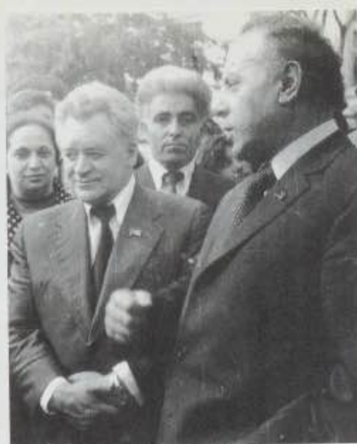
Heydər Əliyevin Qəbələ şəhər əhalisi ilə görüşü