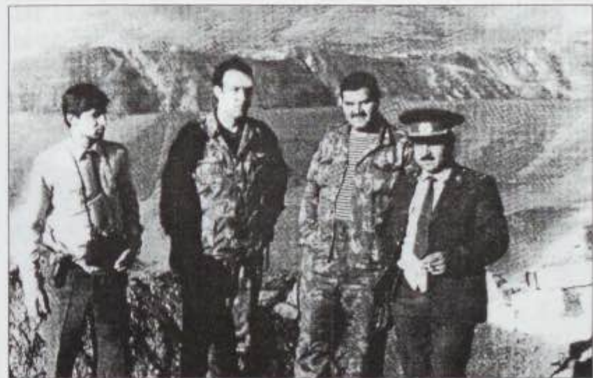
Riad (sağdan 2-ci) döyüş bölgəsi "N" sayılı hərbi hissədə

Mən istefaya çıxandan təxminən 4 il sonra, yəni 1992-ci