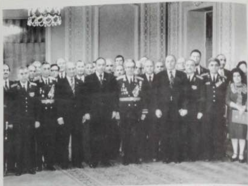
Bakı, 20.12.1977-ci il. ÜFK-DTK (BÇK-KQB) - 60, AKP MK 1-ci katibi H. Əliyev təltif olunan əməkdaşlar arasında