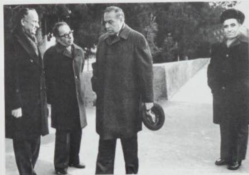
Yevlax şəhəri, 12 yanvar 1979-cu il. Xüsusi qatarla gələn Xankəndi və Şuşaya gedən Heydər Əliyevin qarşılınması