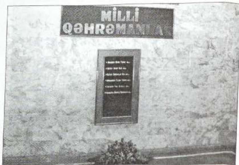
MTN-də "Milli Qəhrəmanlar" guşəsi