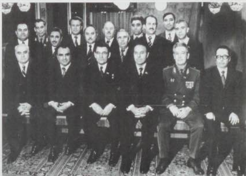
Azərbay. KP 29-cu qurultayında Heydər Əliyev DTK-dan olan nümayəndələr arasında. 30.01.1976-cı il, Bakı