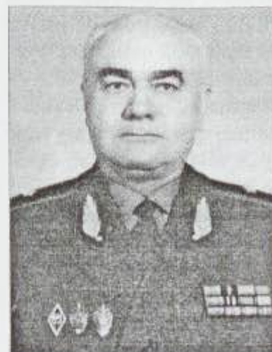
General-mayor Ə.S. Xəlqov

Azərbaycan Respublikasının Sovetlər birliyi dövründə Dövlət Təhlükəsizliyi orqanlarında uzun illər qüsursuz xidmət edənləri xatırlayarkən general-mayor Əbdül Süleyman oğlu Xəlqovun adını birincilər sırasında çəkmək ədalətli olardı. Bu qeyri-adi xarakter sahibi ilə mənim ilk tanışlığım 1959-cu ilin ortalarından başladı. Bu illərdə mayor Ə.Xəlqov Respublika Dövlət Təhlükəsizliyi Komitəsinin Mərkəzi Aparatında, Ulu Öndərimiz Heydər Əliyevin başçılıq etdiyi əkskəşfiyyat şöbəsində bölmə rəisi, mən isə DTK-nın Zəngilan rayonu şöbəsində xidmətdə idim. Əməliyyat işinə 1952-ci ildən SSRİ DTK-nın Azərbaycan Dəmiryolu üzrə İdarəsində başlasam da, 1959-cu ilə kimi bu idarənin Respublika DTK-sı strukturuna daxil olmaması, yəni birbaşa Moskvanın təbəçiliyində olması səbəbindən, bizim xidməti əlaqəmiz bu orqanların birləşdiyi həmin 1959-cu ildən başladı.