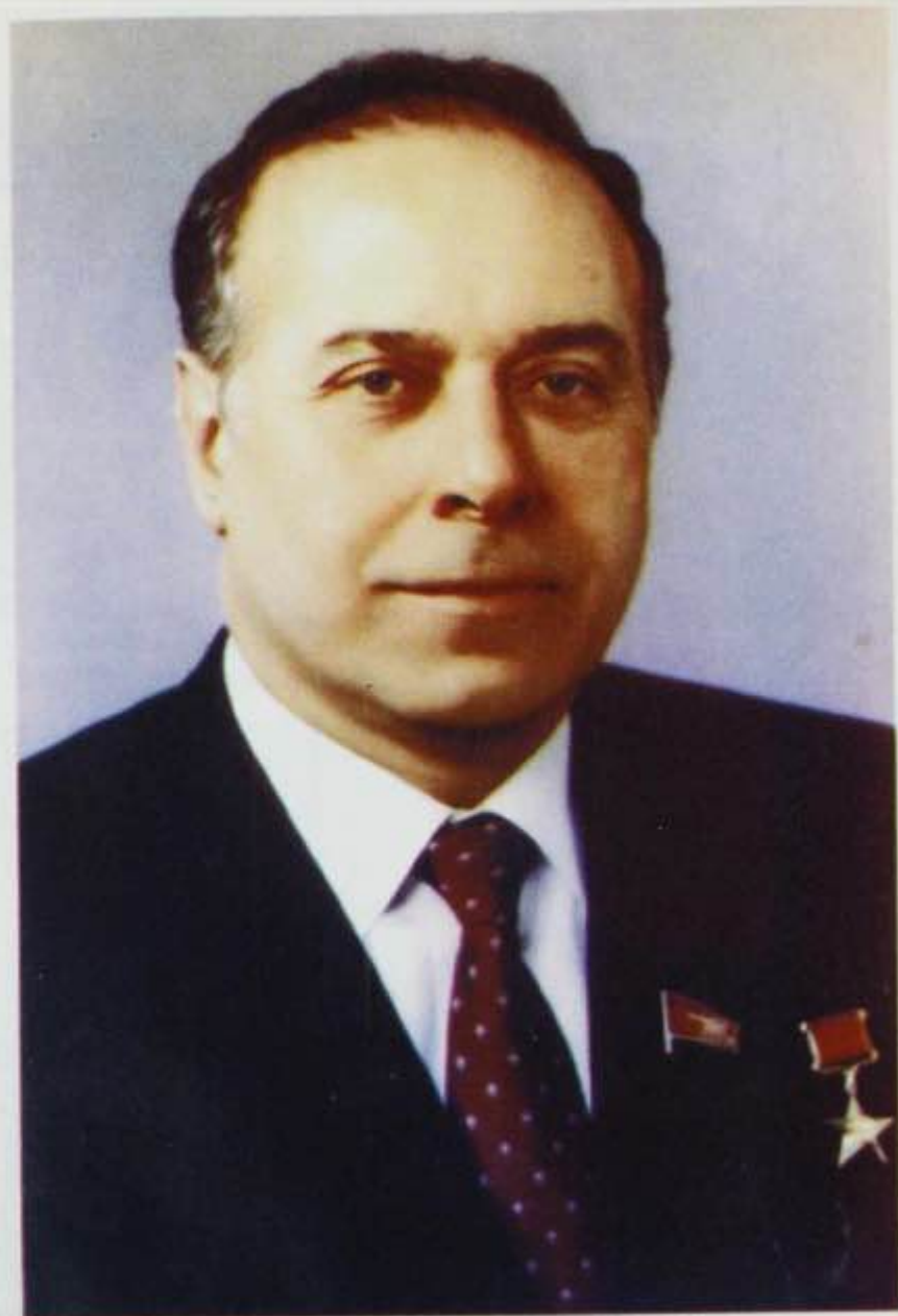
Heydər Əliyev, sentyabr 1979-cu il