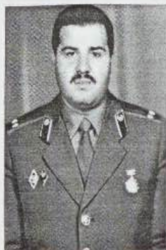
Milli qəhrəman Riad Əhmədov

R espublika Milli Təhlükəsizlik Nazirliyinin əsas inzibati binasının girişindəki böyük dəhlizdə şəxsi heyətin ziyarətgahına çevrilmiş bir müqəddəs guşə var: Bu guşənin divarında «Milli Qəhrəmanlar» başlığı altında bir xatirə lövhəsi yerləşir. Lövhədə Ermənistan-Azərbaycan Dağlıq Qarabağ münaqişəsinin başladığı 1988-ci ildən başlayan, ərazi bütövlüyümüz uğrunda gedən qanlı döyüşlərdə və müstəqil Azərbaycanın dövlətçiliyinə qarşı yönəlmiş silahlı qarşıdurmada canlarını qurban vermiş, dövlətin ən yüksək mükafatı — «Azərbaycan Respubli-