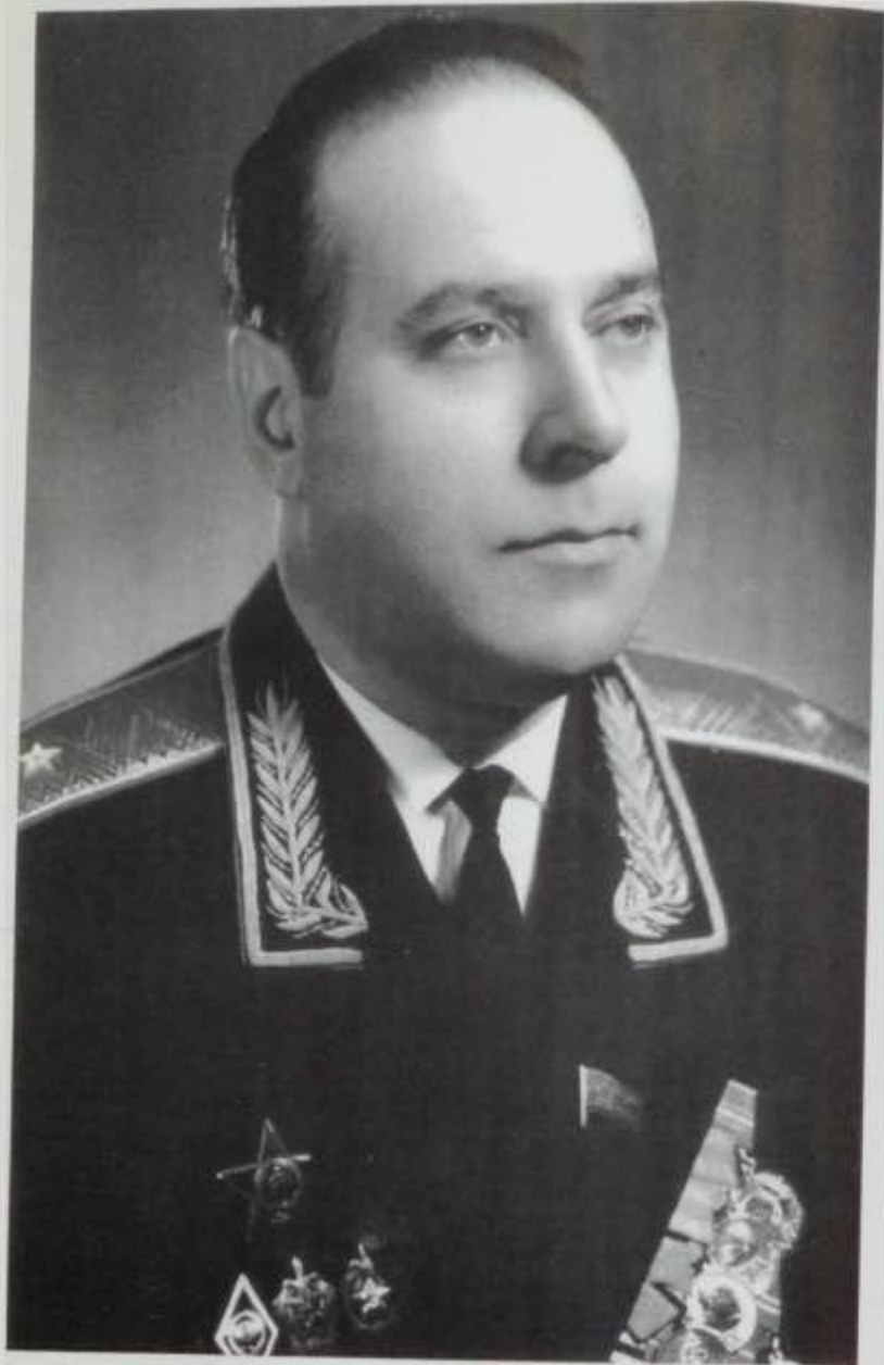
Azərbay. SSR DTK-nın sədri, general-mayor Heydər Əliyev. Bakı 1967-ci il, oktyabr