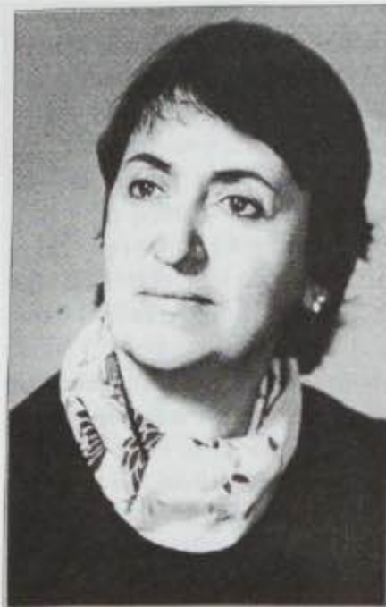
Görkəmli oftalmoloq alim, akademik Zərifə xanım Əliyeva

nan xoş məramlı müasir bət nəticəsində, tək-tək hallarda Bakıda olmağından, tanıdığı adamlardan, əsasən də göz həkimlərindən, başqa görkəmli adamlardan, akademik Zərifə xanım Əziz qızı ilə elmi əməkdaşlıqlarından söz salardı. Onun yüksək elmi potensialından, qeyri-adi insani dəyərlərindən çox razılıqla danışardı.