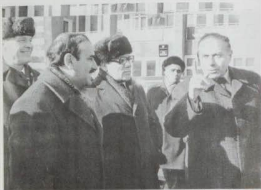
Şuşa, 12.01.1979-cu il. Heydər Əliyev rayon və Muxtar Vilayət rəhbərlərinə şəhərin abadlaşdırılması barədə göstərişlər verir