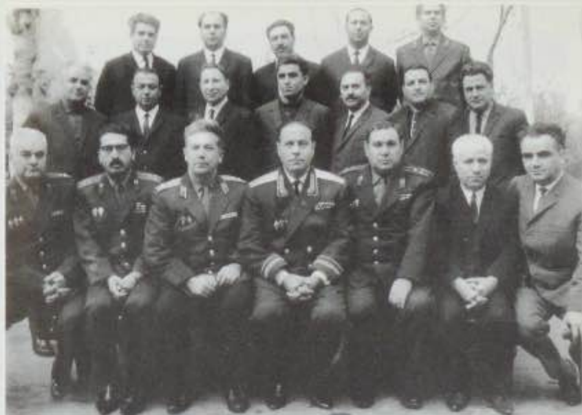
Bakı, 20 dekabr 1967-ci il. DTK (UFK - DTK)-50. DTK-nın sədri Heydər Əliyev Kollegiya üzvləri və şəhər, rayon şöbə rəisləri ilə