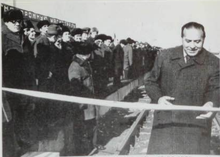
Ağdam-Xankəndi dəmiryolu xəttinin açılışı 12.01.1979-cu il