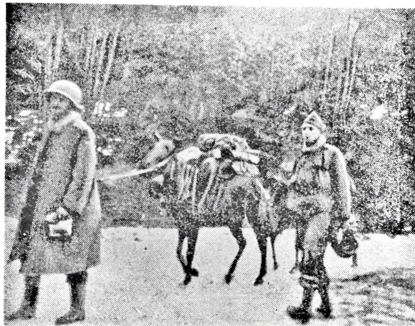
Дәстәја һәрби сурсат дашыныр.

О сонра Франса халгынын чәкдији әзаблардан, бунун мүбаризә тарихиндән данышараг вәтәнин азад-