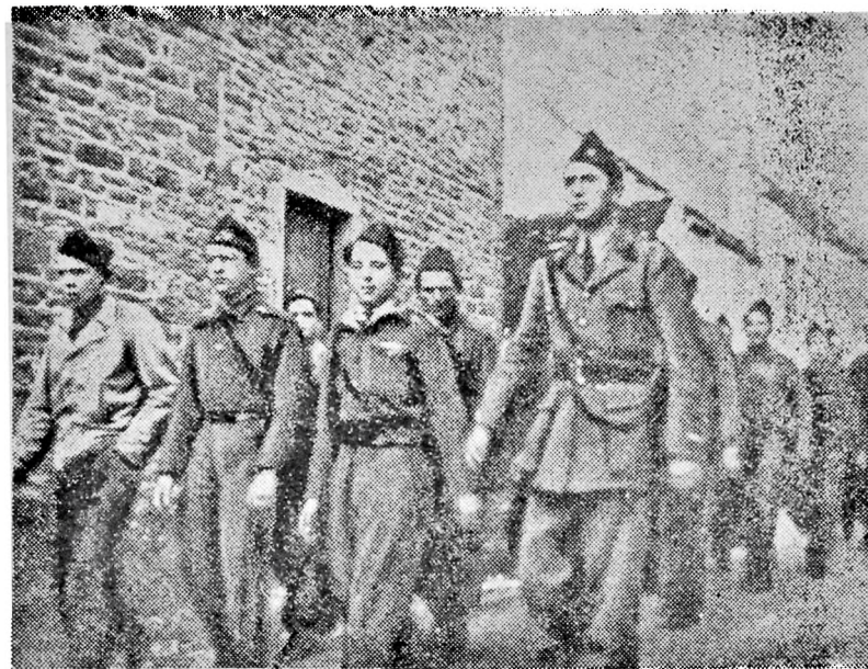
Лејтенант Бессек партизанлара көмәјә кәләнләри дәстәјә апарыр.

— Нәјинә лазымдыр, сәни хилас едәчәк адамлар.