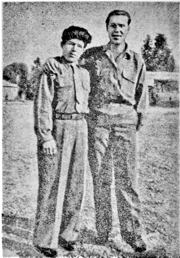
Дар агачыннан хилас едилдикдэн сонра.

баланда вердилэр, ја да јахшы јериндэн төкдүлэр. Со- рушанда ки: