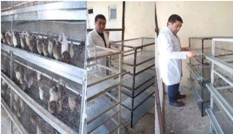
Şəkil 3. Talvar altında qəfəslərin yerləşdirilməsinin görünüşü

Fərdi təsərrüfatlarda bildirçin saxlanılan qəfəs ayda bir dəfə təmizlənməlidir. Bunun üçün bildirçin başqa yerə keçirilir. Qəfəsi isti su və təmizləyici vasitə ilə yuyub, sonra üstündən qaynar su axıdılır və qurumağa qoyulur (şəkil 3).