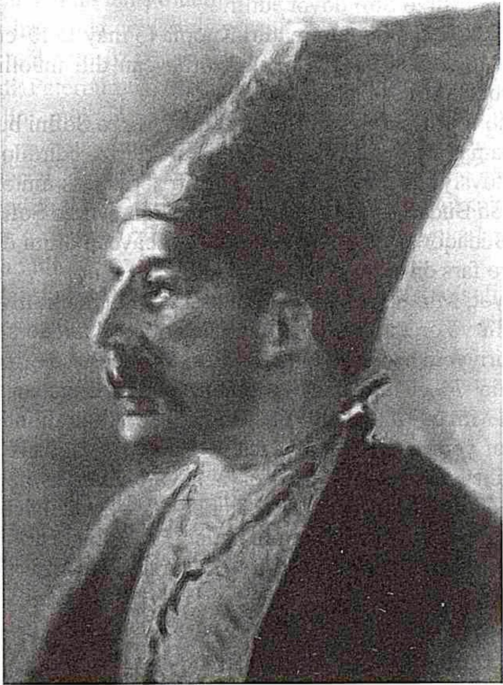
Mirze Şefi Vazeh