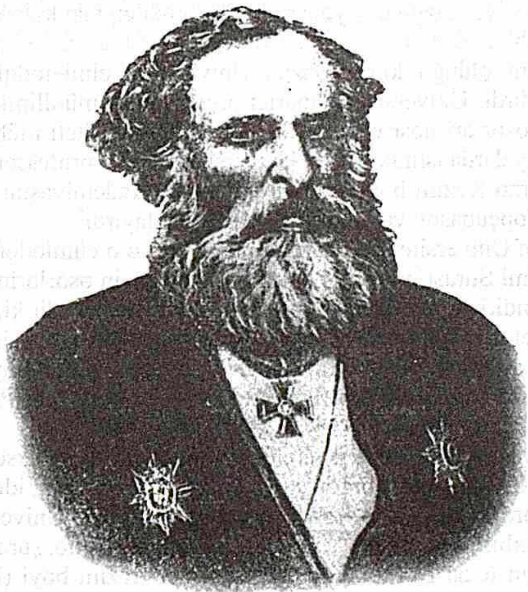
Mirzə Kazım bəy