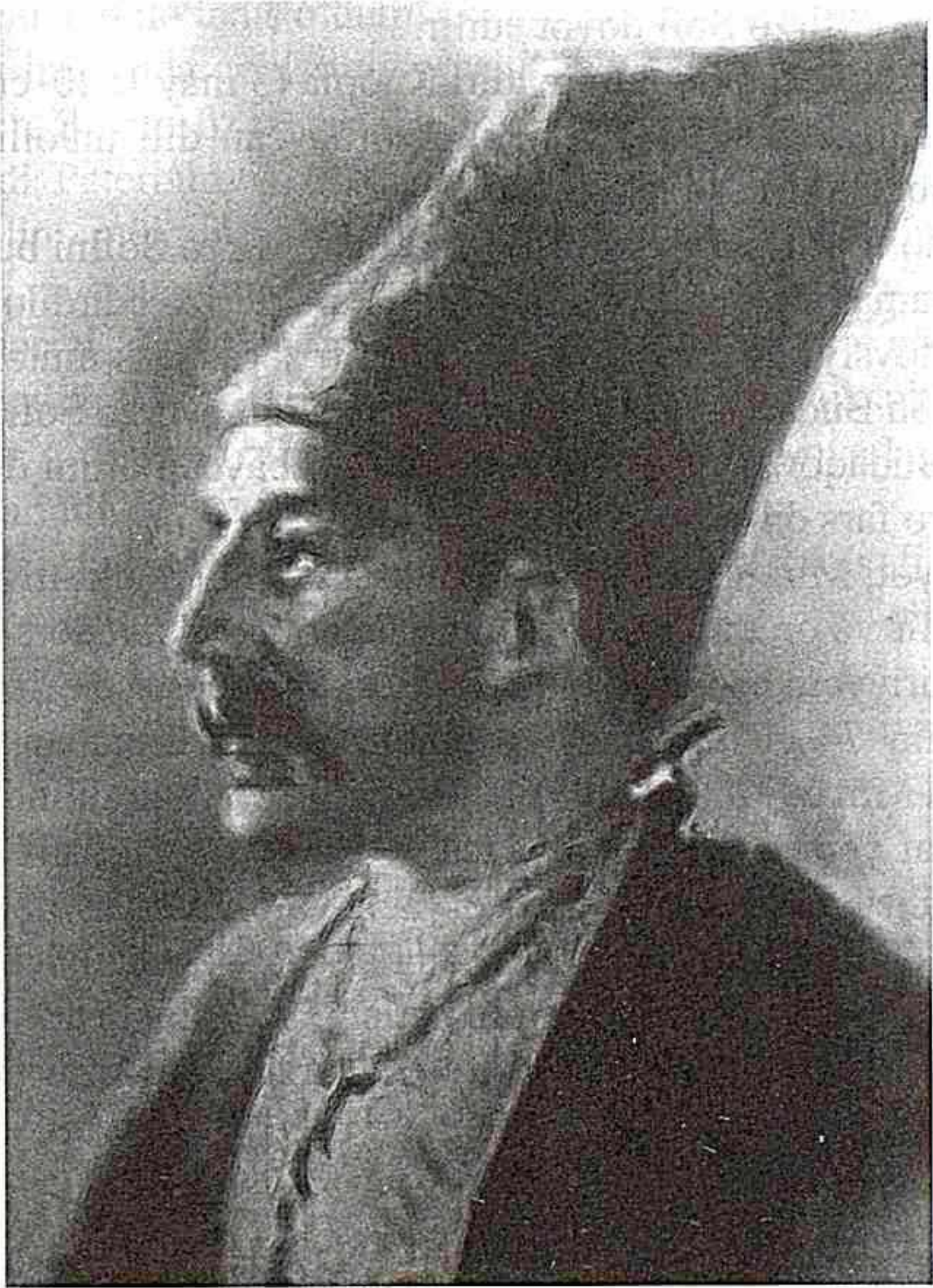
Mirzə Şəfi Vazeh