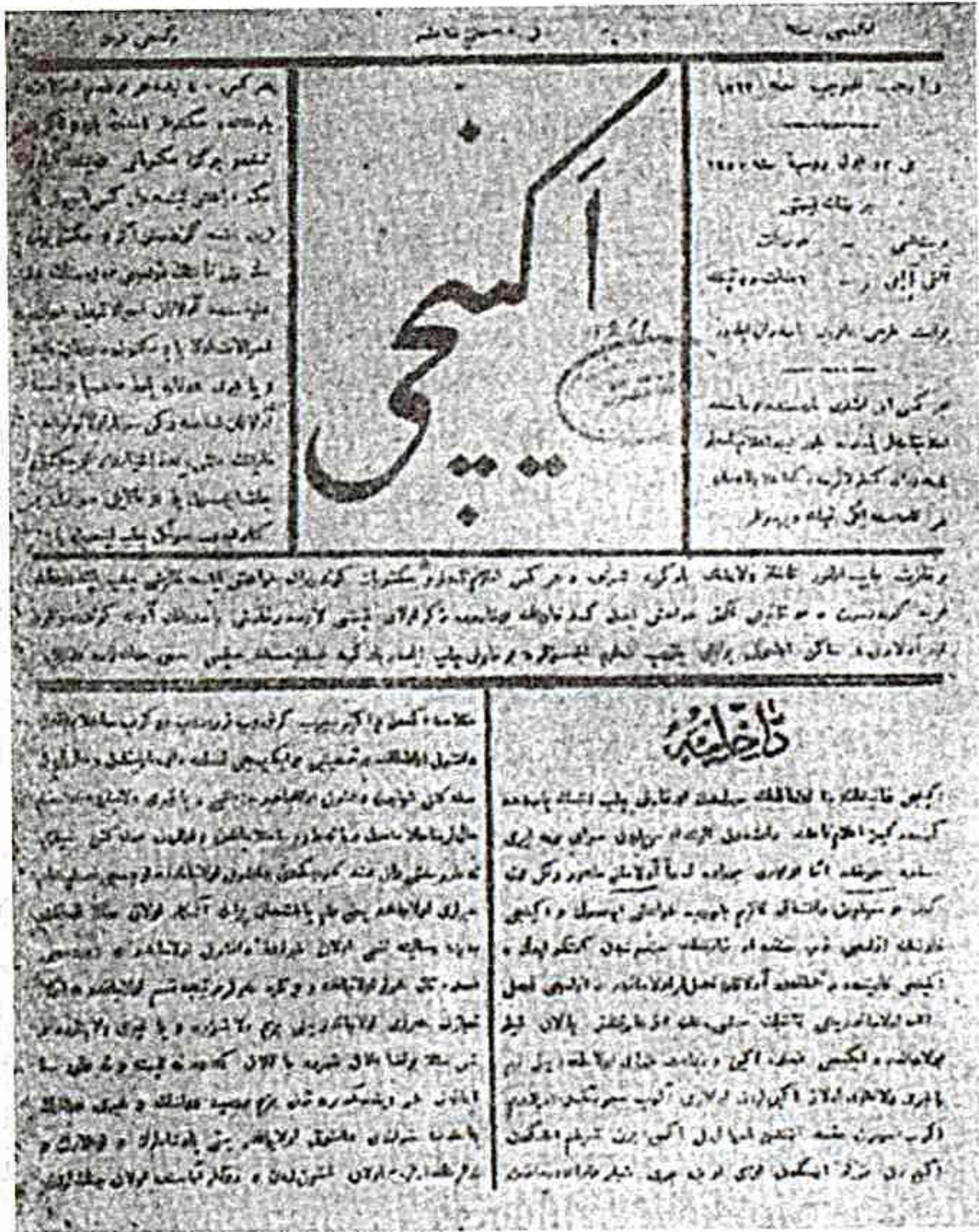
1875-ci il iyulun 22-də çapdan çıxmış "Əkinçi" qəzetinin ilk nömrəsinin birinci səhifəsi