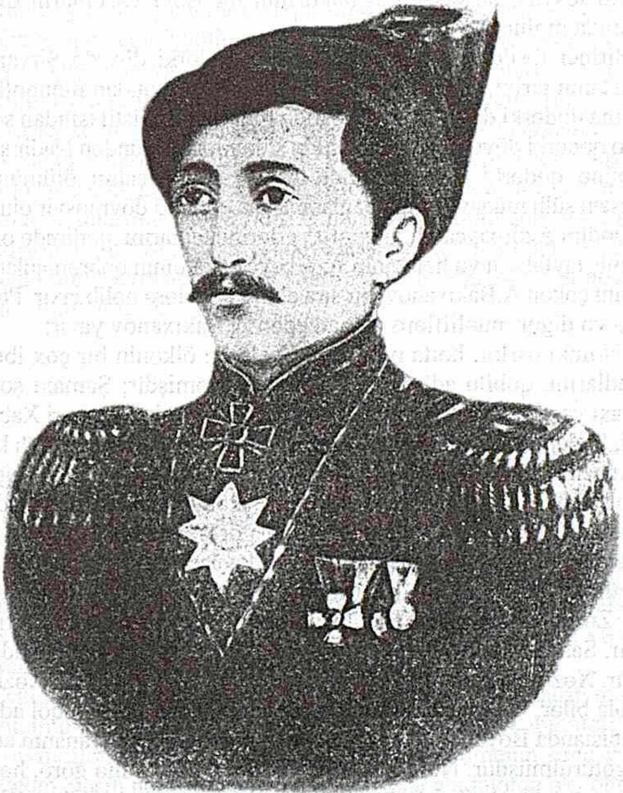
Abbasqulu ağa Bakıxanov