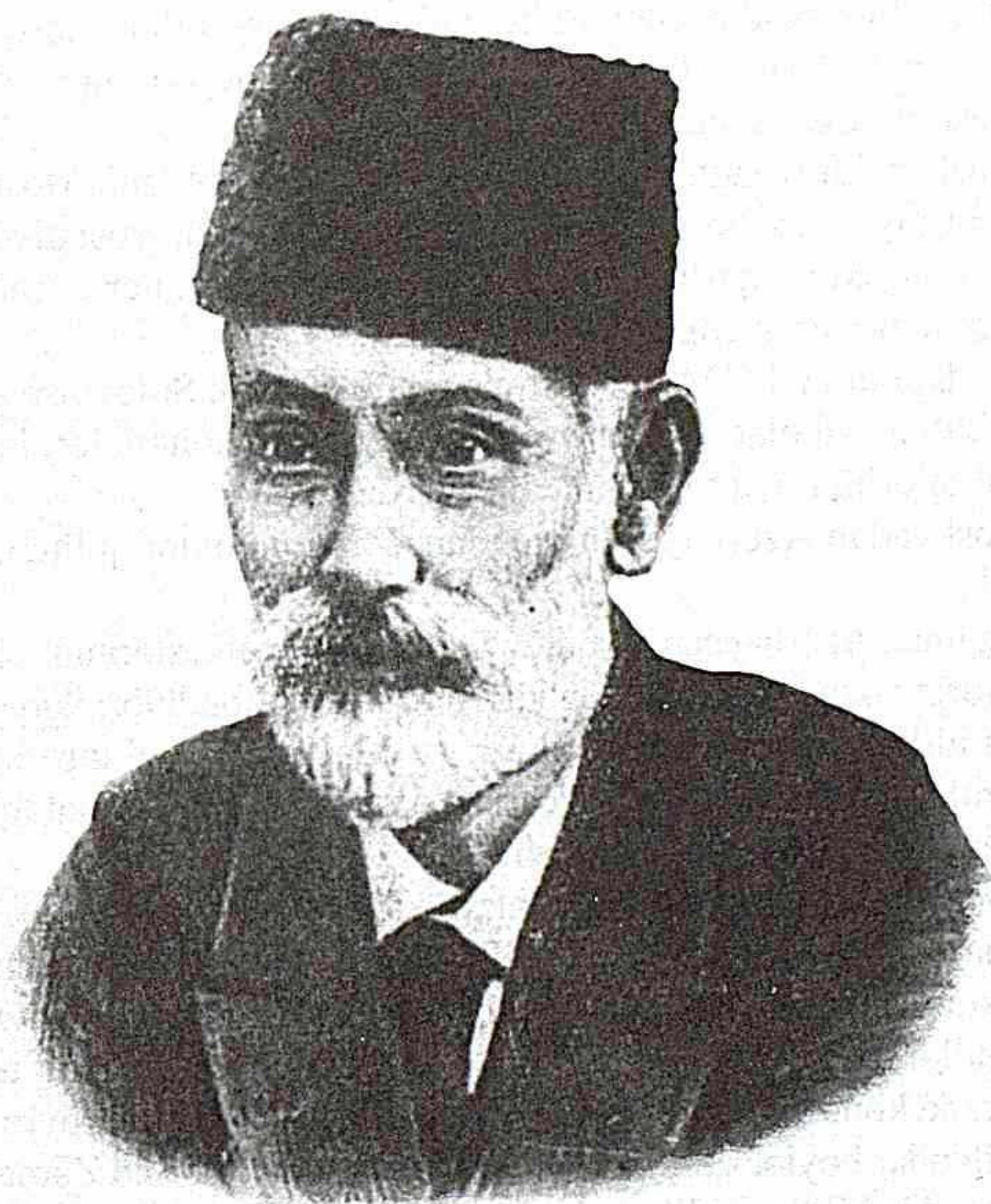
Həsən bəy Zərdabi