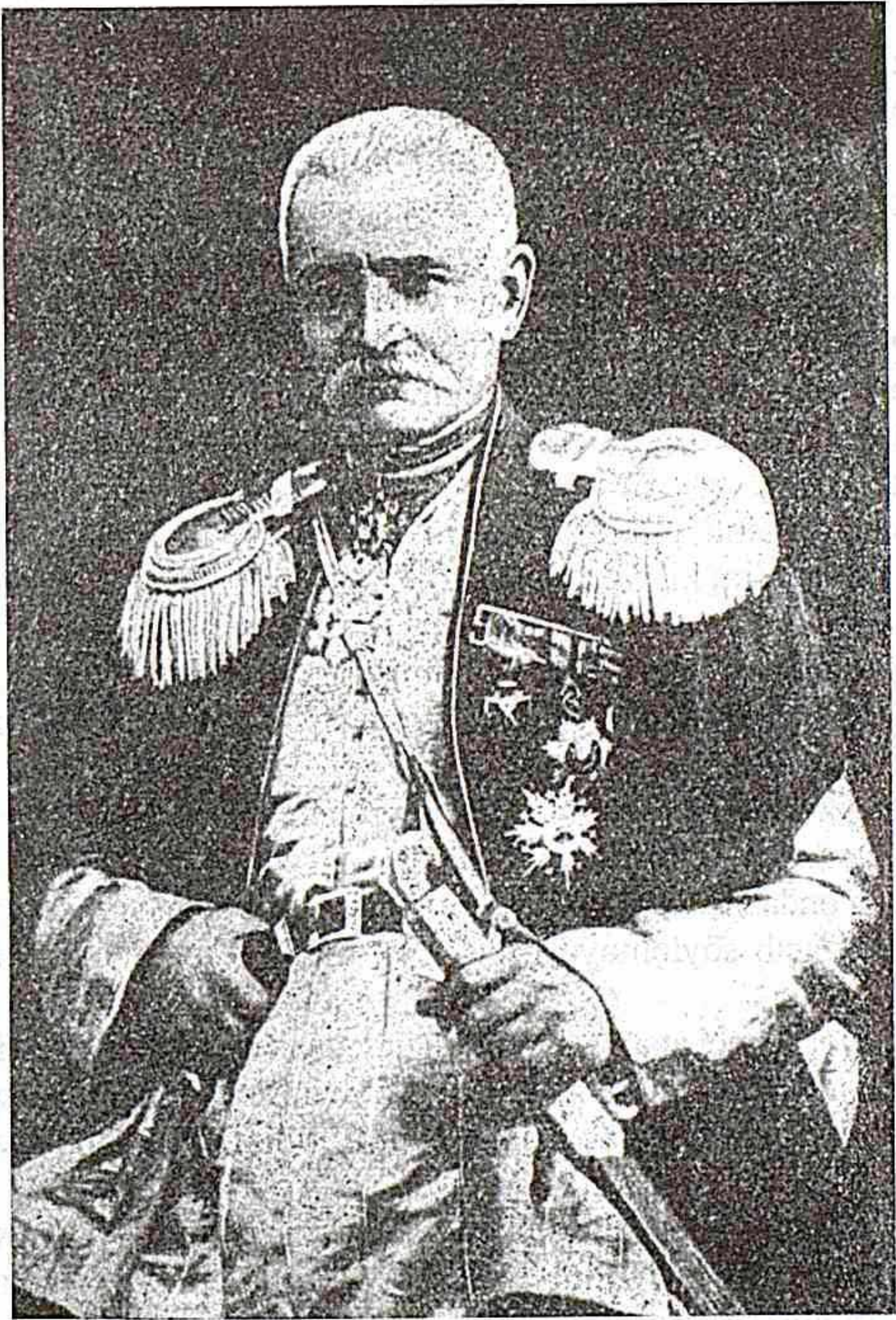
Mirzə Fətəli Axundov