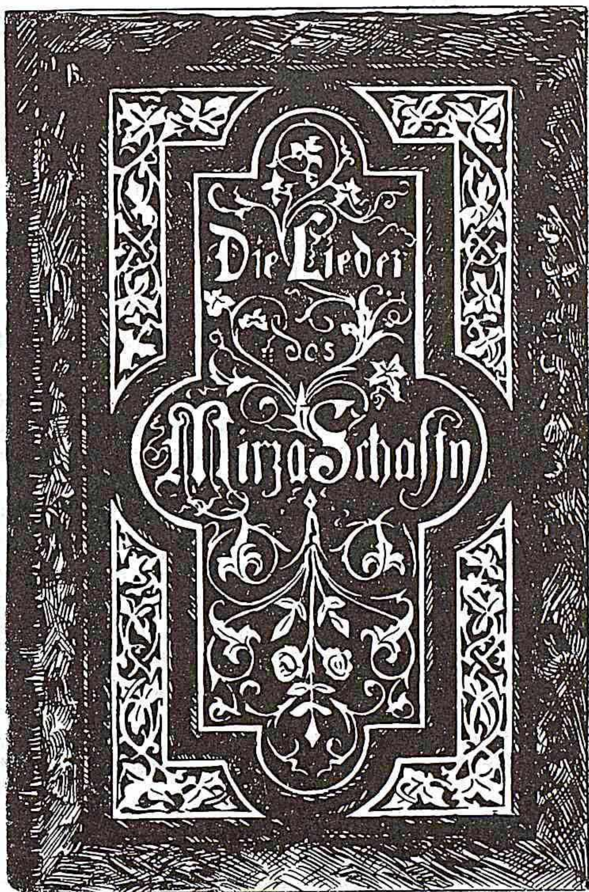
"Mirzə Şəfinin nəğmələri" kitabının üz qabığı.