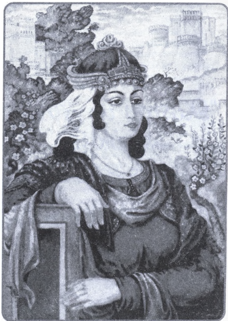
Rəssam Fəxrəddin Əli. “Mehriban” miniatürü