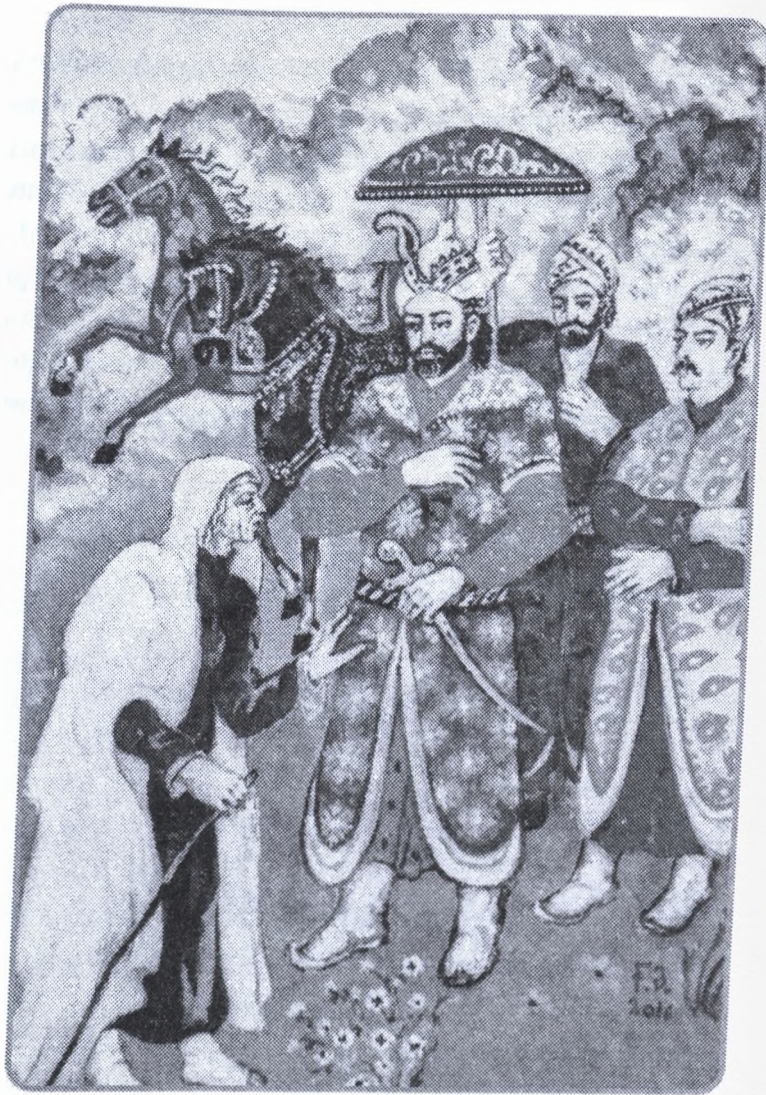
Rəssam Fəxrəddin Əli. "Sultan Səncər və qarı" miniatürü