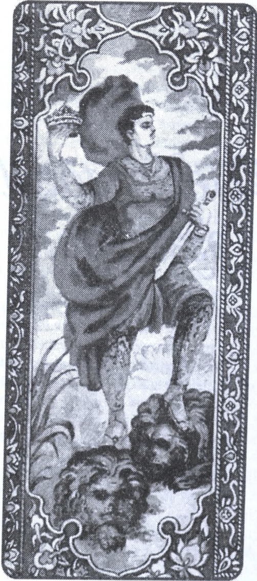
Rəssam Fəxrəddin Əli. "Yeddi Gözəl" miniatürü