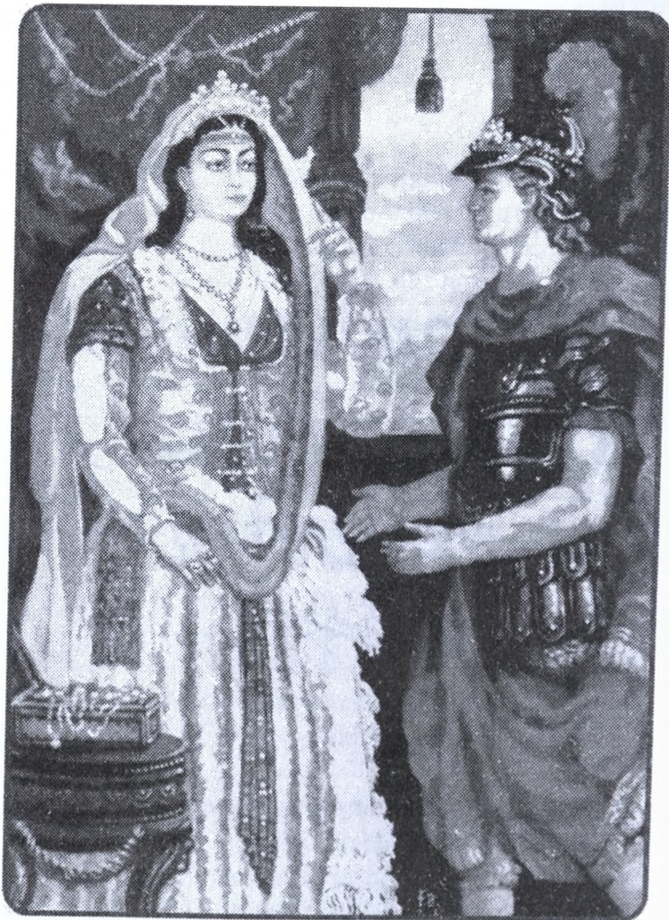
Rəssam Fəxrəddin Əli. “Nüşabə və İskəndər” miniatürü