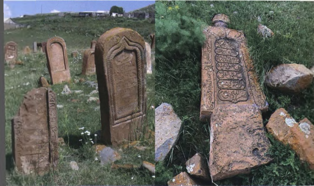
Ağbabada erməni vandalizmin törətdiyi vəhşiliklərə şahidlik edən məzar daşları.