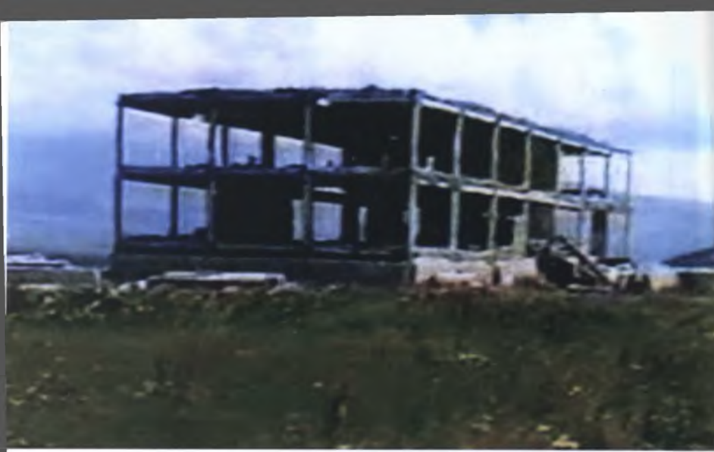
Müəllifin doğulub boya-başa çatdığı Çaybasar kəndində viran edilmiş orta məktəb binası.