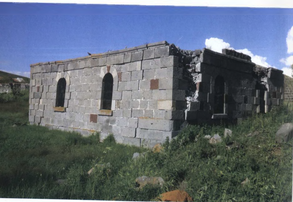
Ağbabadakı Balıqlı məscidi

sancılıb qalıb. Ustad yazır: “Səyyadın ömür kitabında əvvəlcə açılıb pardaqlanan, sonra kül kimi qovrulmuş bir Ağbaba dünyası var. Əvvəlcə taybatay açılan, sonra birdəfəlik bağlanan qapılar var. Əvvəlcə alışan, sonra birdəfəlik sönən ocaqlar var. Bu yerdə istəməz Balzakın məşhur bir fikrini xatırlayıram: “ Bir insanın tarixini yazmaq bir şəhərin tarixini yazmaqdan çətindir ”. Yurd-yuvası dağılan, qaçqınlıq-köçkünlük görən, gözü görə-görə Arpaçayı, Çaybasarı, Ağbabası əlindən gedən, dəfələrlə ölümün ağzından qurtaran, Ağbaba faciəsi azmış kimi, Qarabağın bütün ağrı-acılarını öz içindən keçirən bir vətəndaş ziyalı, yazıçı, jurnalist, qələm sahibi haqda yazmaq, əlbəttə, çətindir. Çətindir, amma şərəflidir. Çünki deməyə söz var. Mən Səyyadın yaradıcılığına bütün xırdalıqları ilə nüfuz edəndə görürəm ki, onun ictimai-siyasi fəaliyyəti, dövlətçilik təfəkkürü hələ neçə-neçə kitabın yazılmasına zəmin yaradan bir xəzinədir. Arzu edirəm ki, Səyyad Ağbabalı bu yolu davam etdirdin ”.